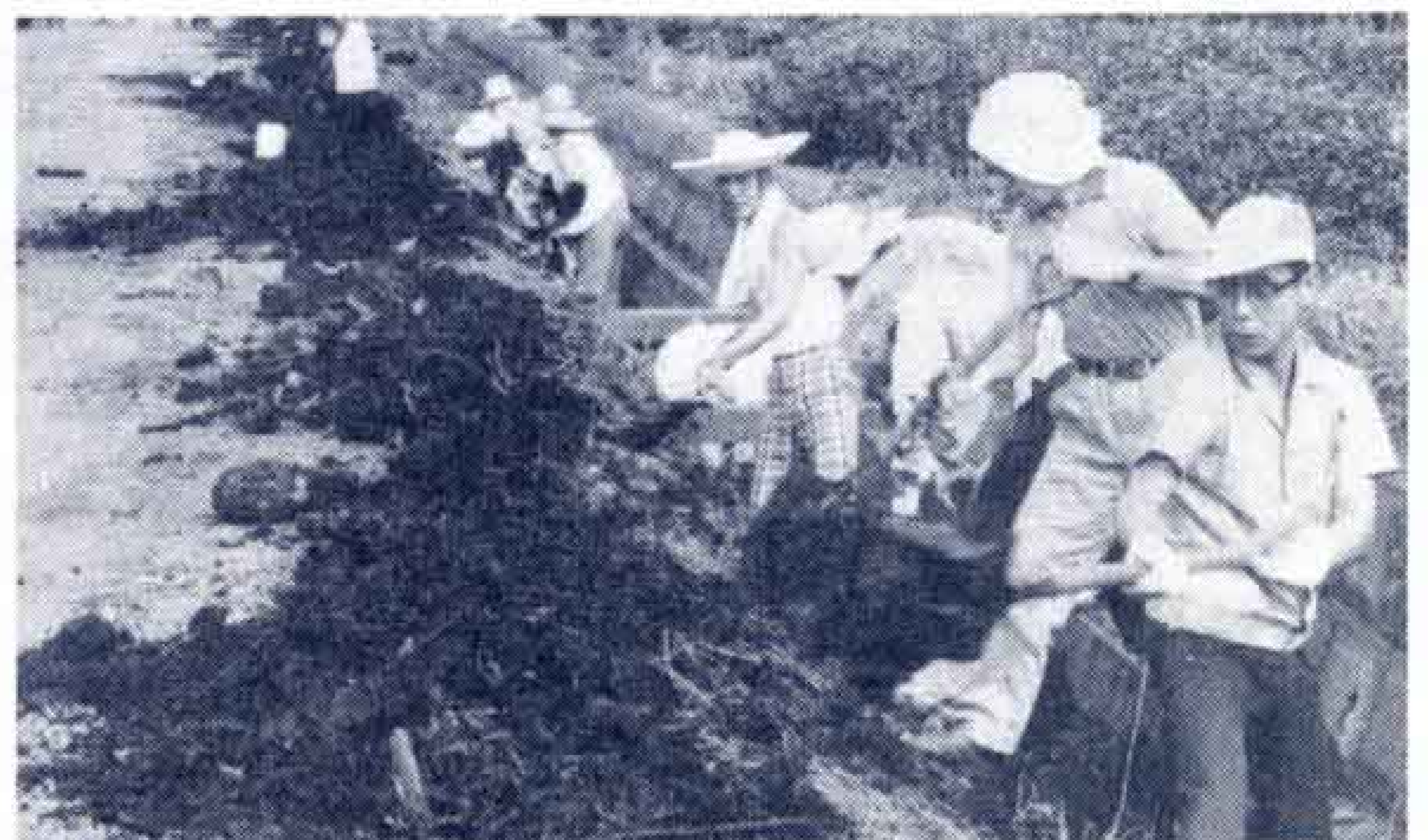
【町内総出の道路の側溝清掃】

道路を守る月間中の8月8日、市内中野町1丁目の町内会では、各戸から約230人が参加して道路側溝の清掃奉仕作業を行いました。むかしは、年に一度お盆前に道ぶしんをおこなっていましたが、道路が舗装されたためにその必要がなくなり、かわって自分達のまわりは自分達の手できれいにしようと、5～6年ぶりに道ぶしんを復活したものです。