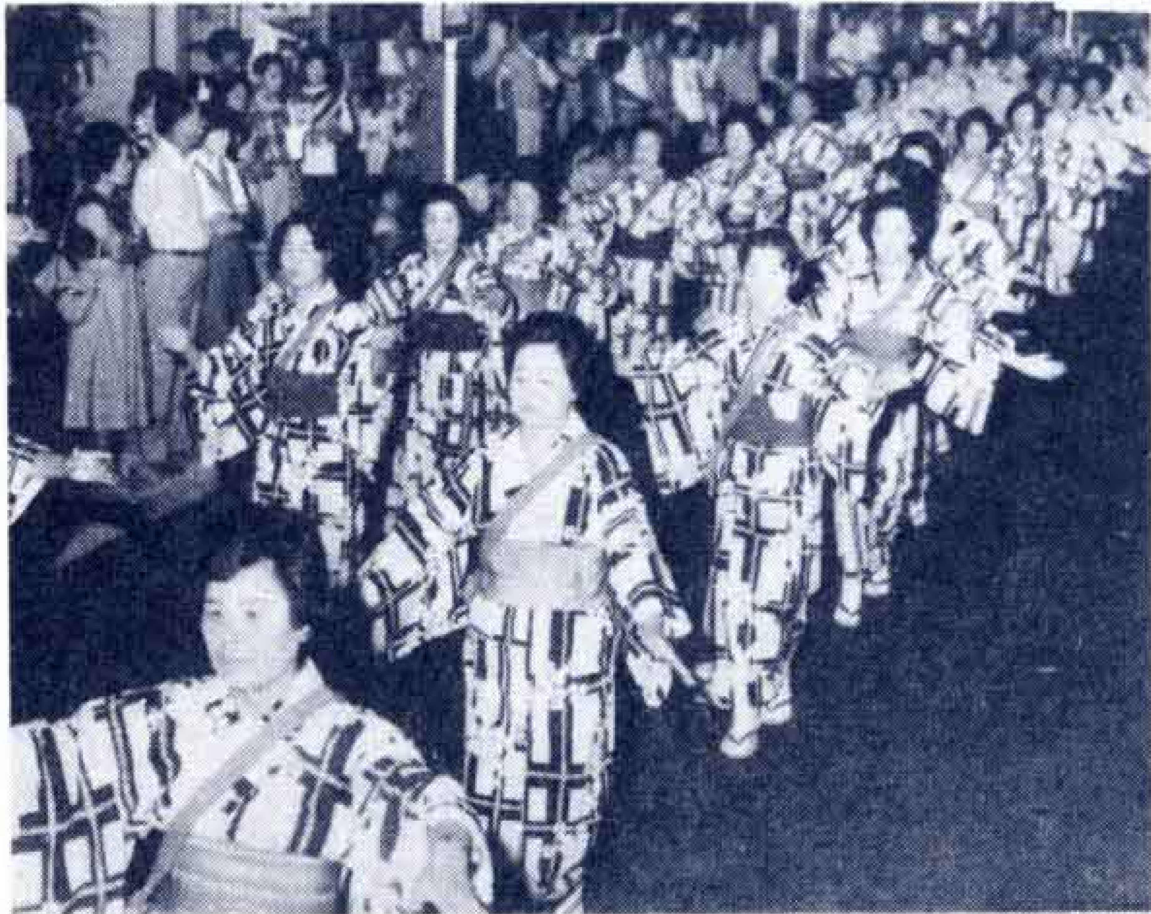
【おどり行進もにぎやかに】

恒例の富士まつりが、8月3日から5日までにぎやかに行われました。ことしは、とくに新しくできた「富士ばやし」が、いやが上にもお祭り気分を盛り上げ、子どもみこしや花火大会に一層のいろどりを添えました。