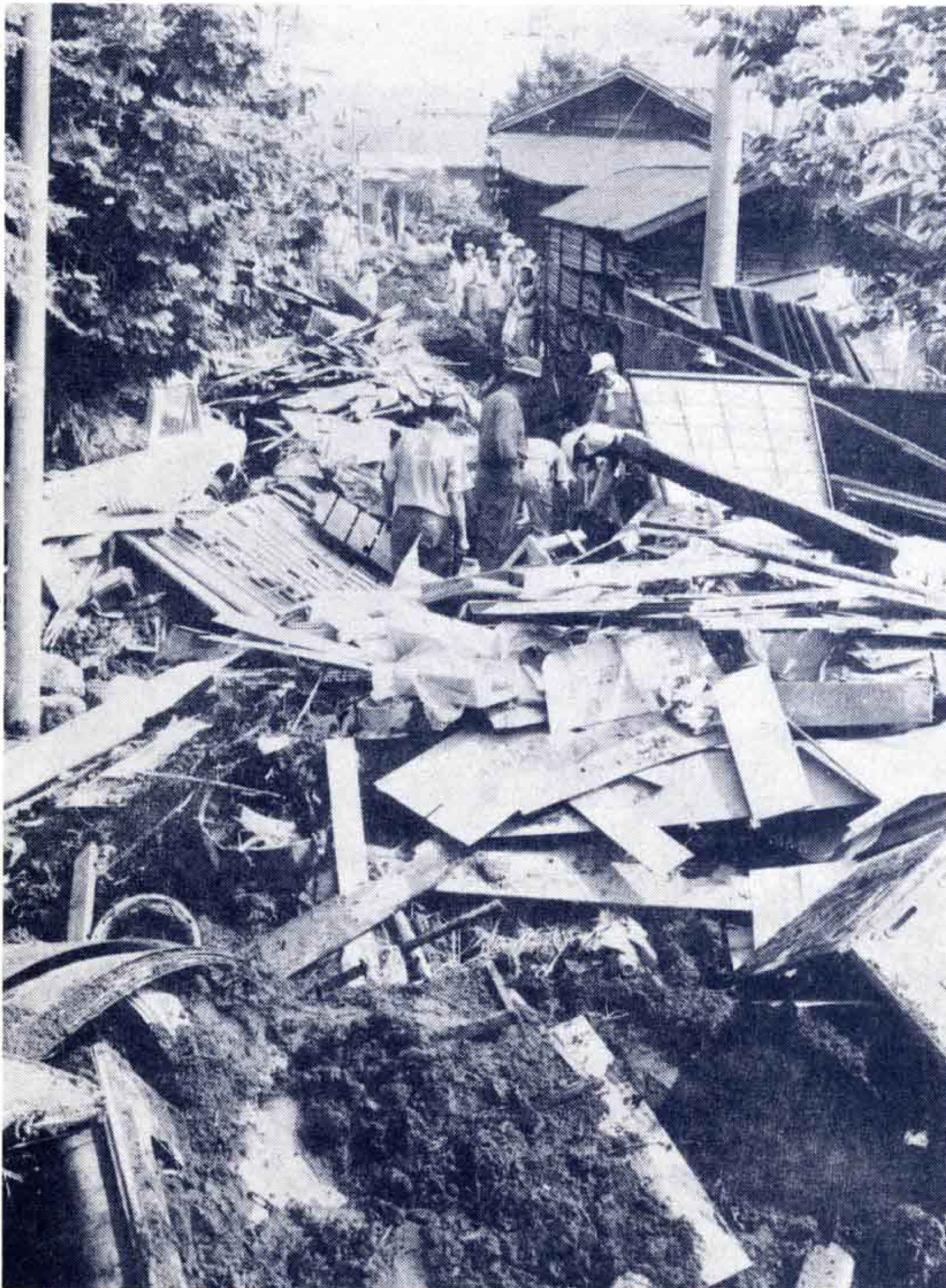
【鉄砲水でこわされた家の残がいで埋った道路＝富士岡地区＝】