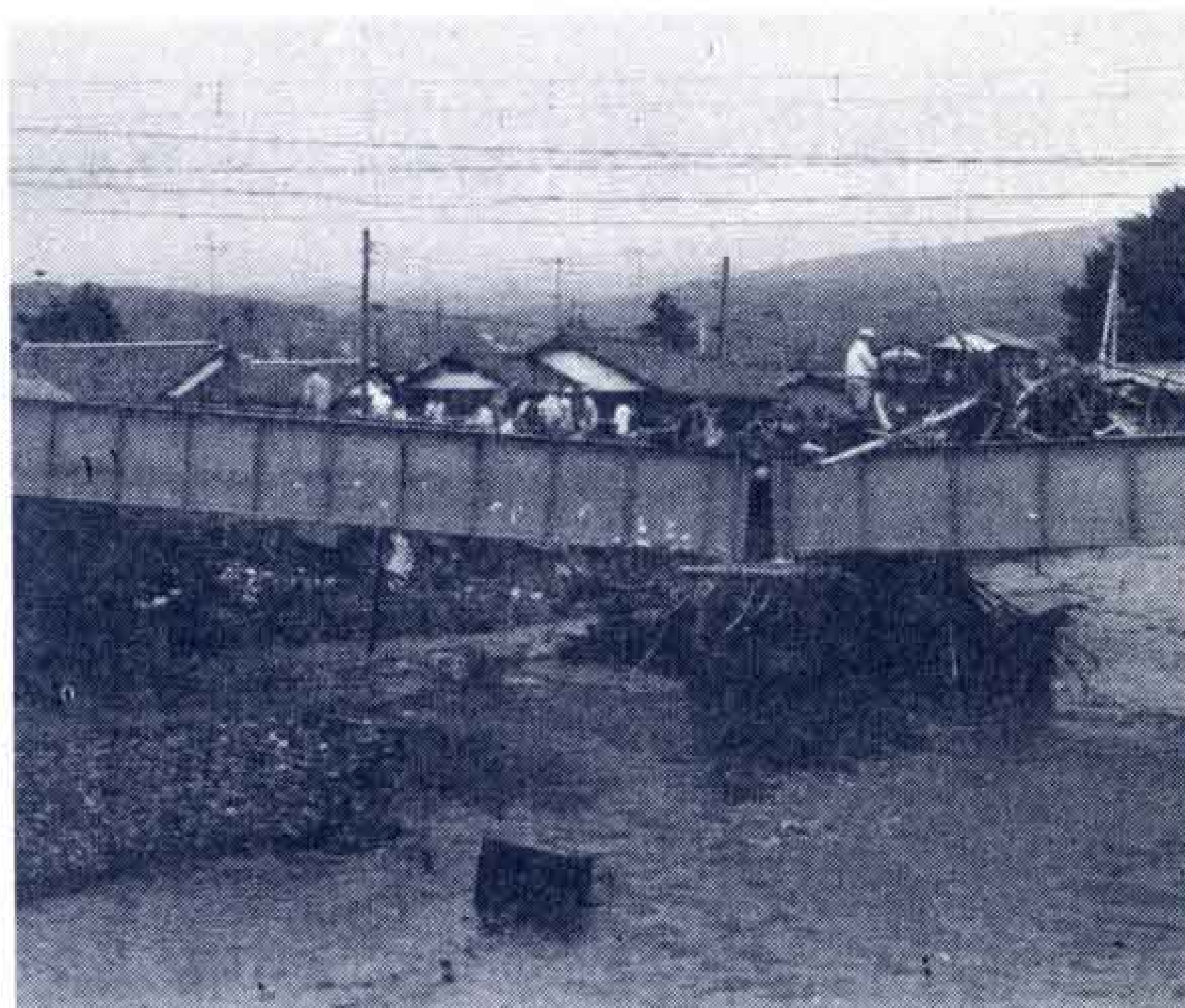
【岳南鉄道の鉄橋もまん中でポキリッ… =中里地区で】