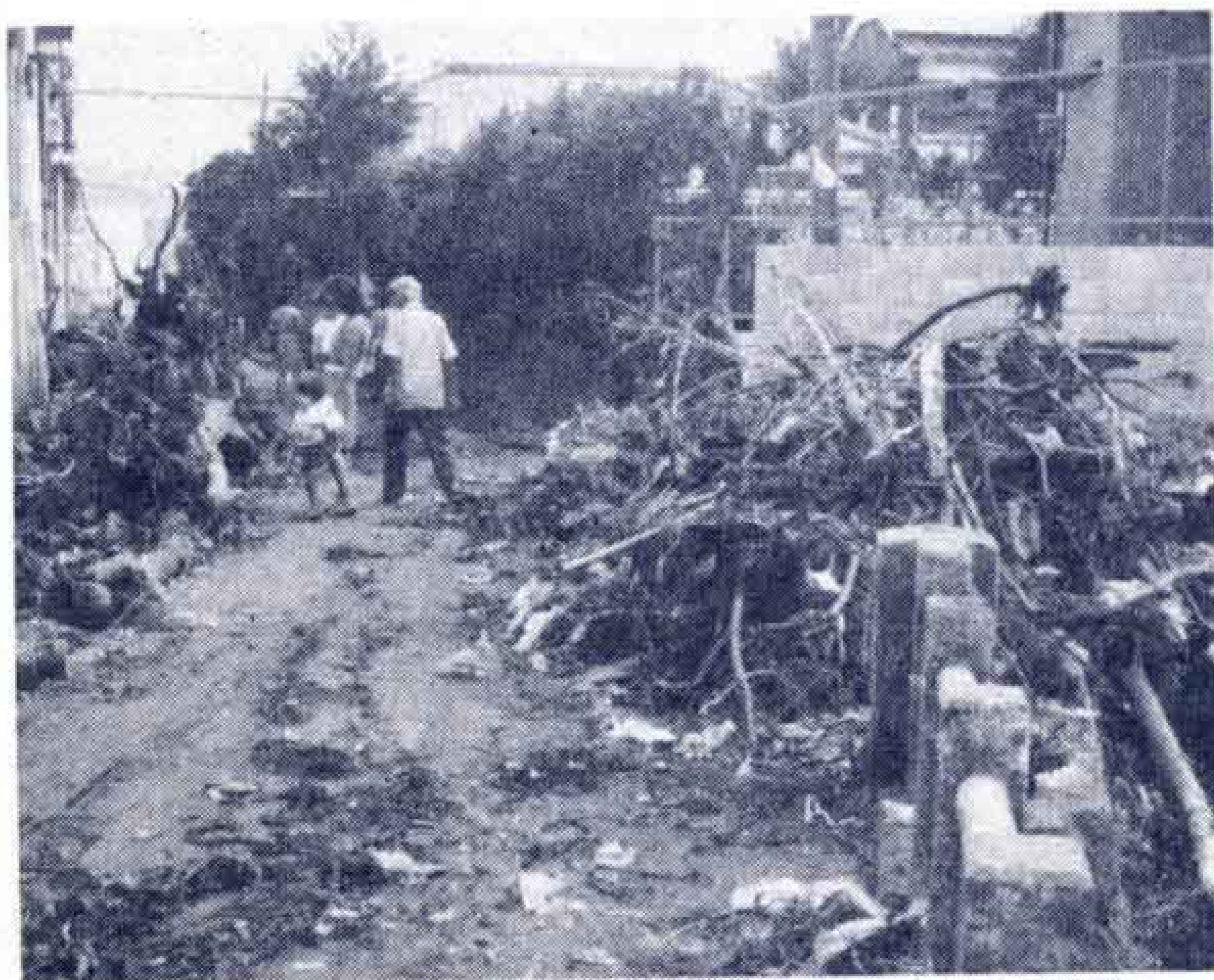
【滝川のはんらんで道路はゴミの山=原田地区で】