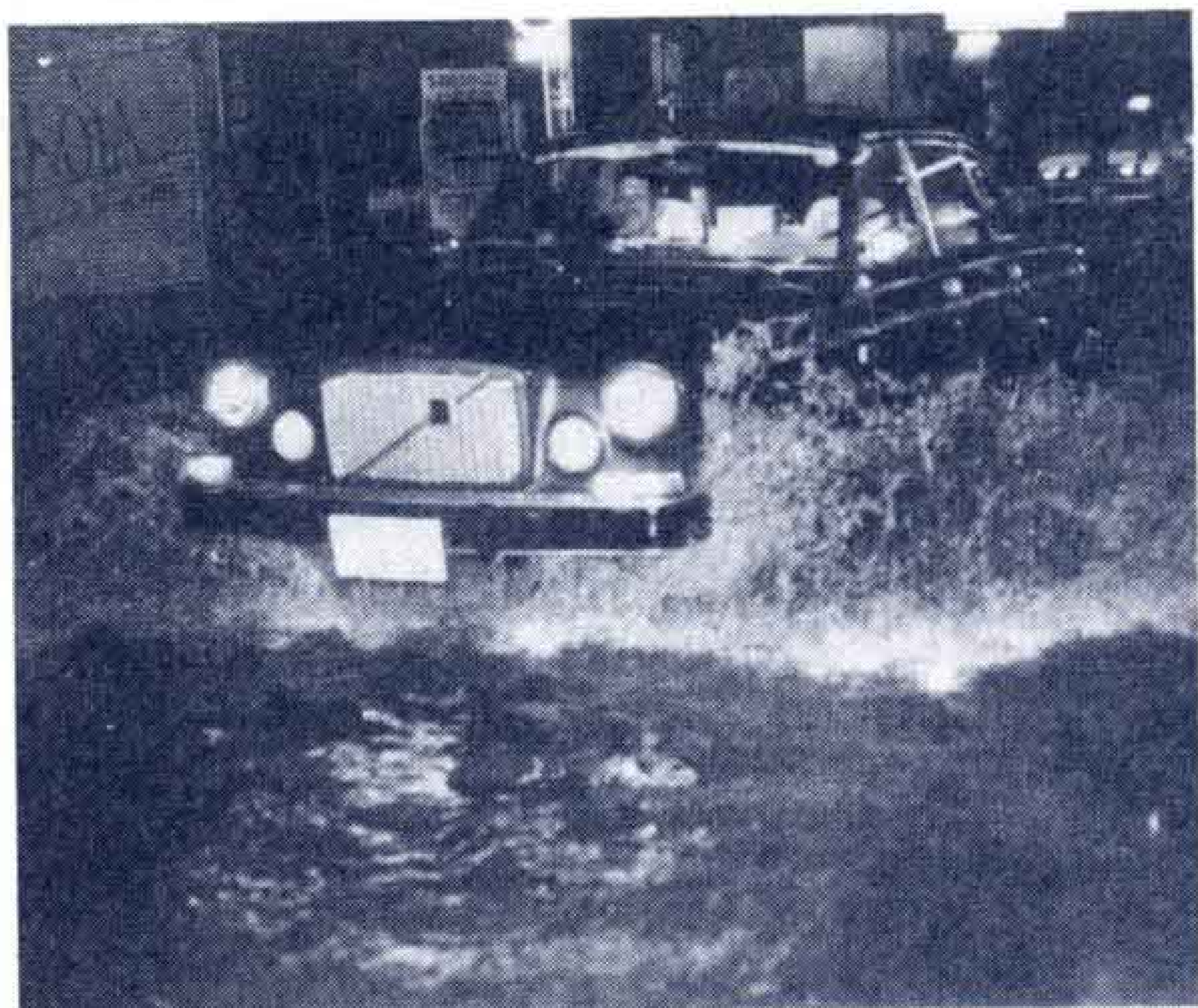
【水しぶきを上げながら走る車、車…… =吉原中心街で】