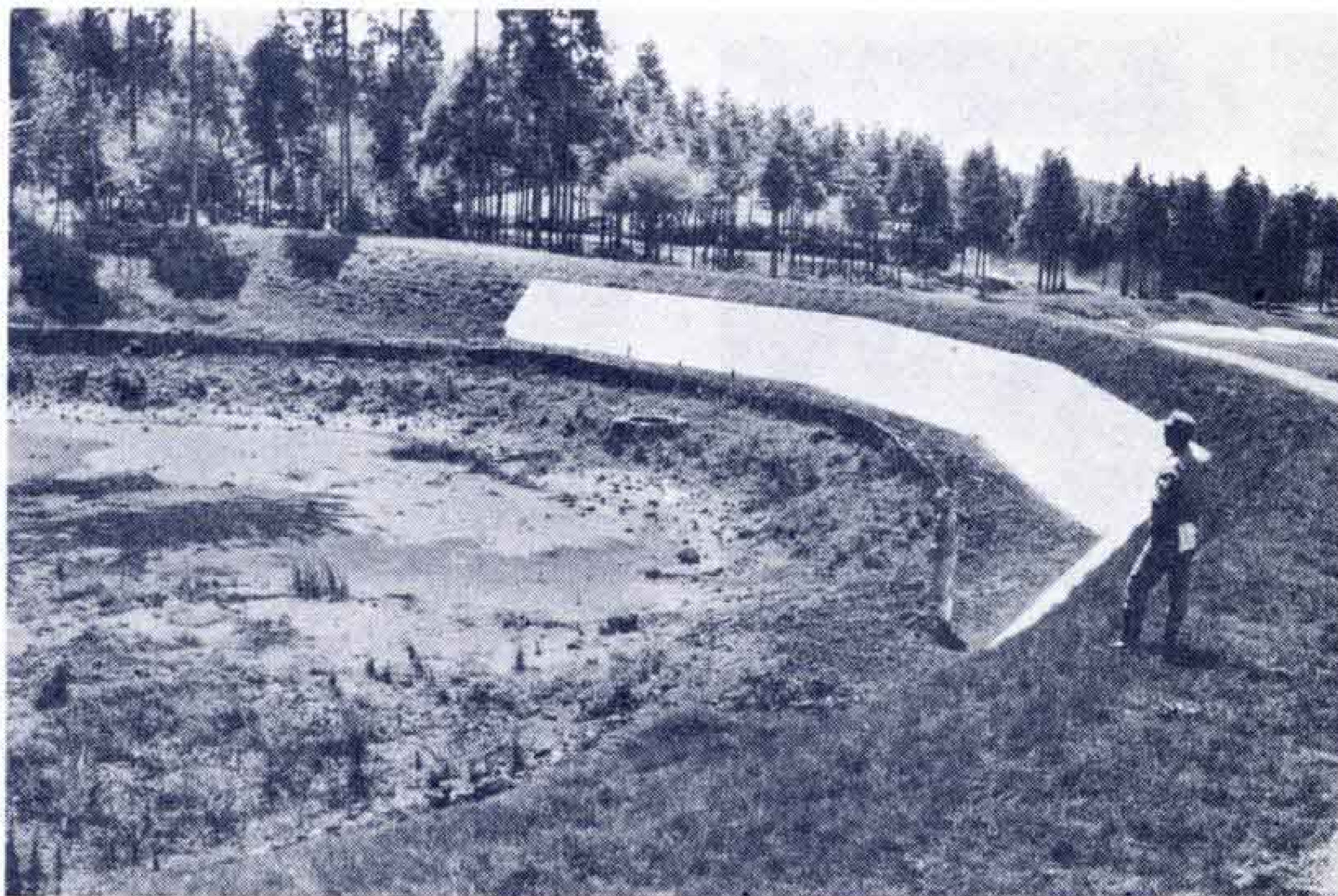
【防災のために拡張させた調整池】

しかし、とりうるあらゆる手段のなかで国、県とともに南富士ゴルフが造成地内にあった普通河川（滝川の上流）や里道（国有財産）を一方的に取込んでしまったり、こわしてしまったため、これらの復元を求めるとともに、告発や国有財産の明け渡しをさせる訴えをおこしました。