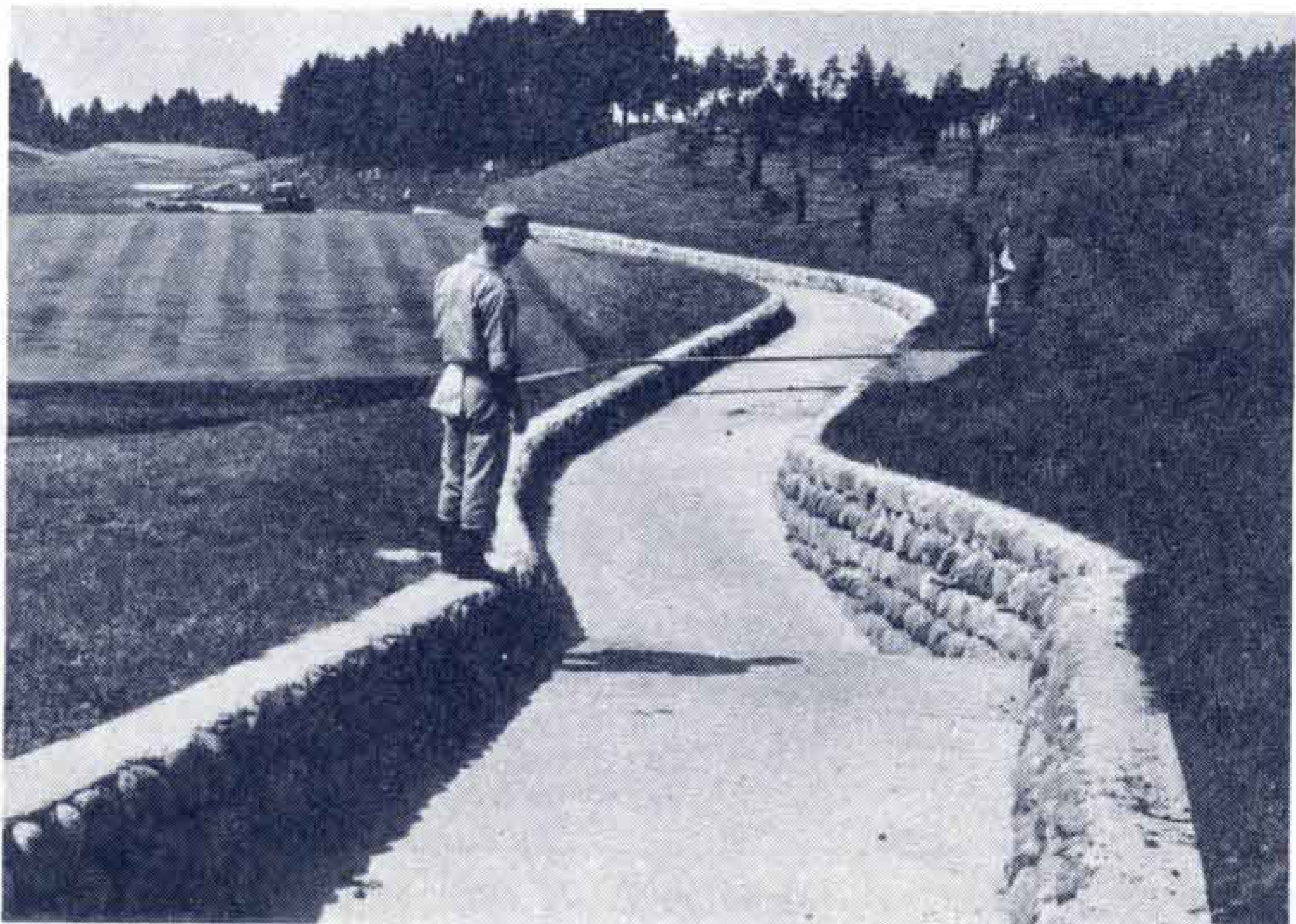
【コース内へ復元なった河川】

この行政方針を打出したことによって、異常な開発ラッシュも「小休止」する一方、また、石油ショックにより経済活動も停滞化し、土地問題もようやく鎮静化の傾向を見せはじめました。しかし、南富士ゴルフだけは、私有財産権の主張と、多くの会員をかかえていることを理由にして、49年8月ころから造成にとりかかり、50年10月には仮オープンの状態に至ったものであります。