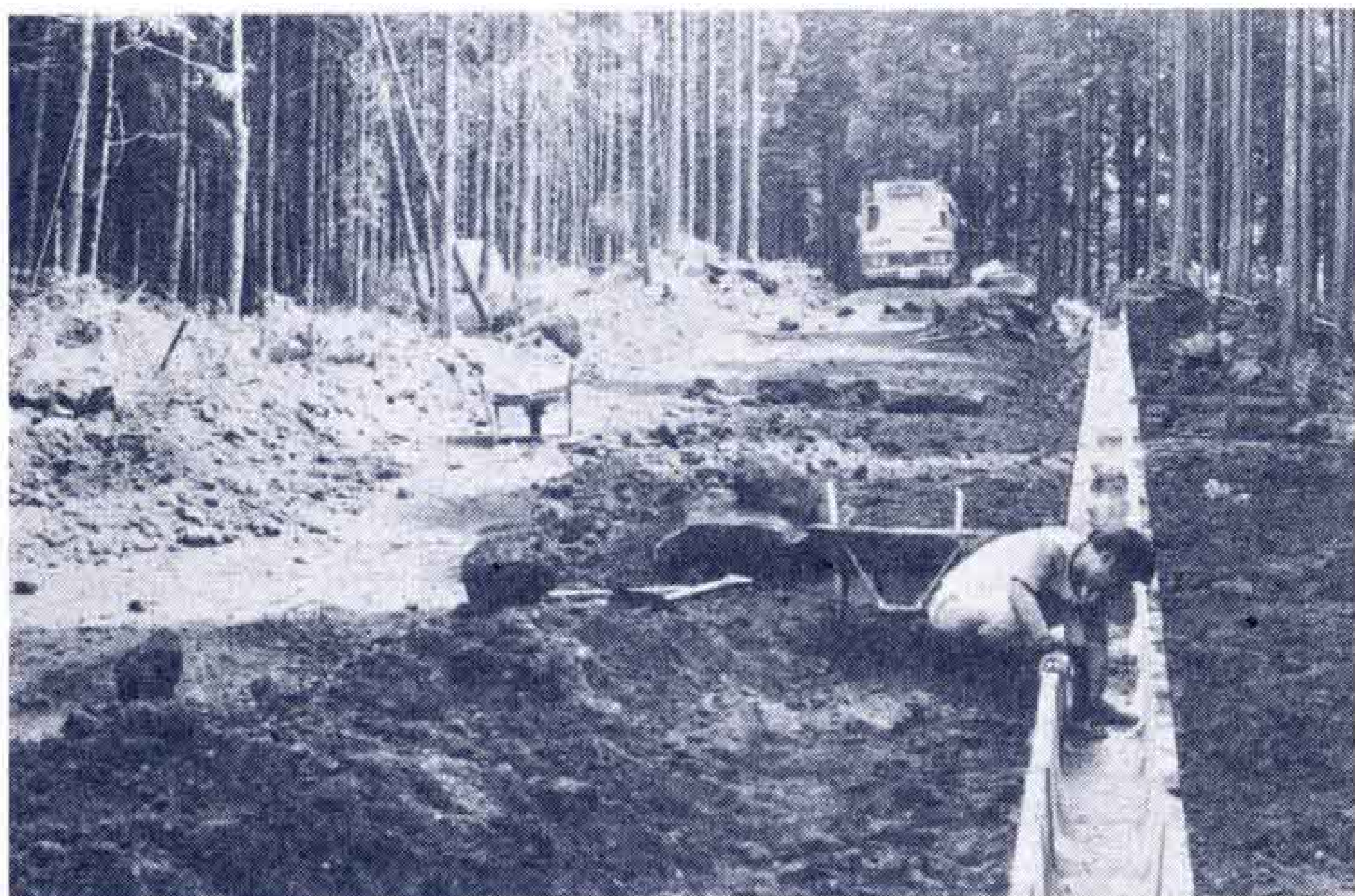
【南北に貫通する新設道路】

この協定は、51年7月16日にとりかわしたもので、ゴルフ場内を南北に貫通させる1路線の新設道路工事を施工させるためのもので、工事の完了期限は8月末。この施工保証として現金1,500万円が市に預託され