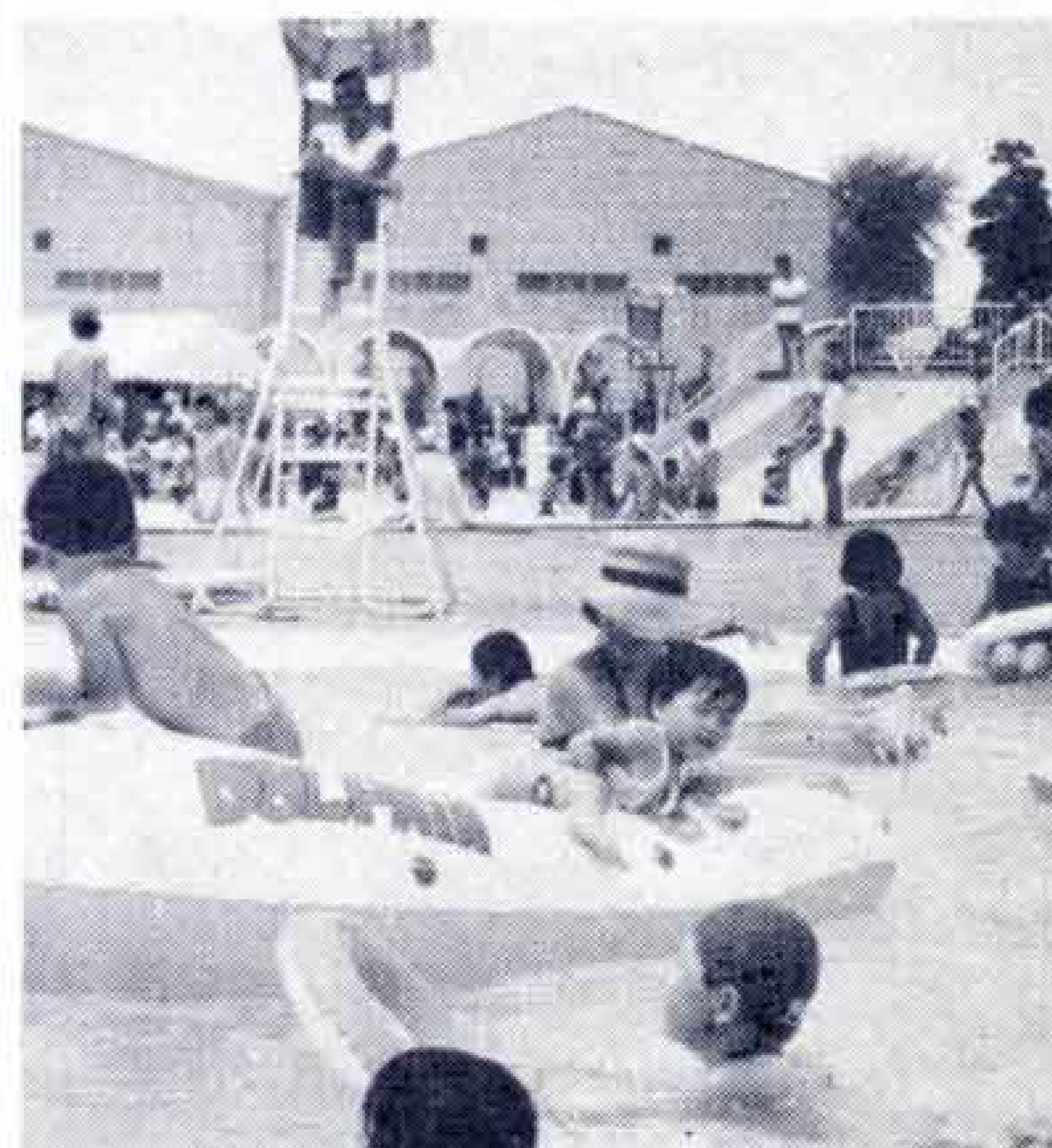
【超満員の市民プールでかたときも目をはなさず安全を見守る監視員】