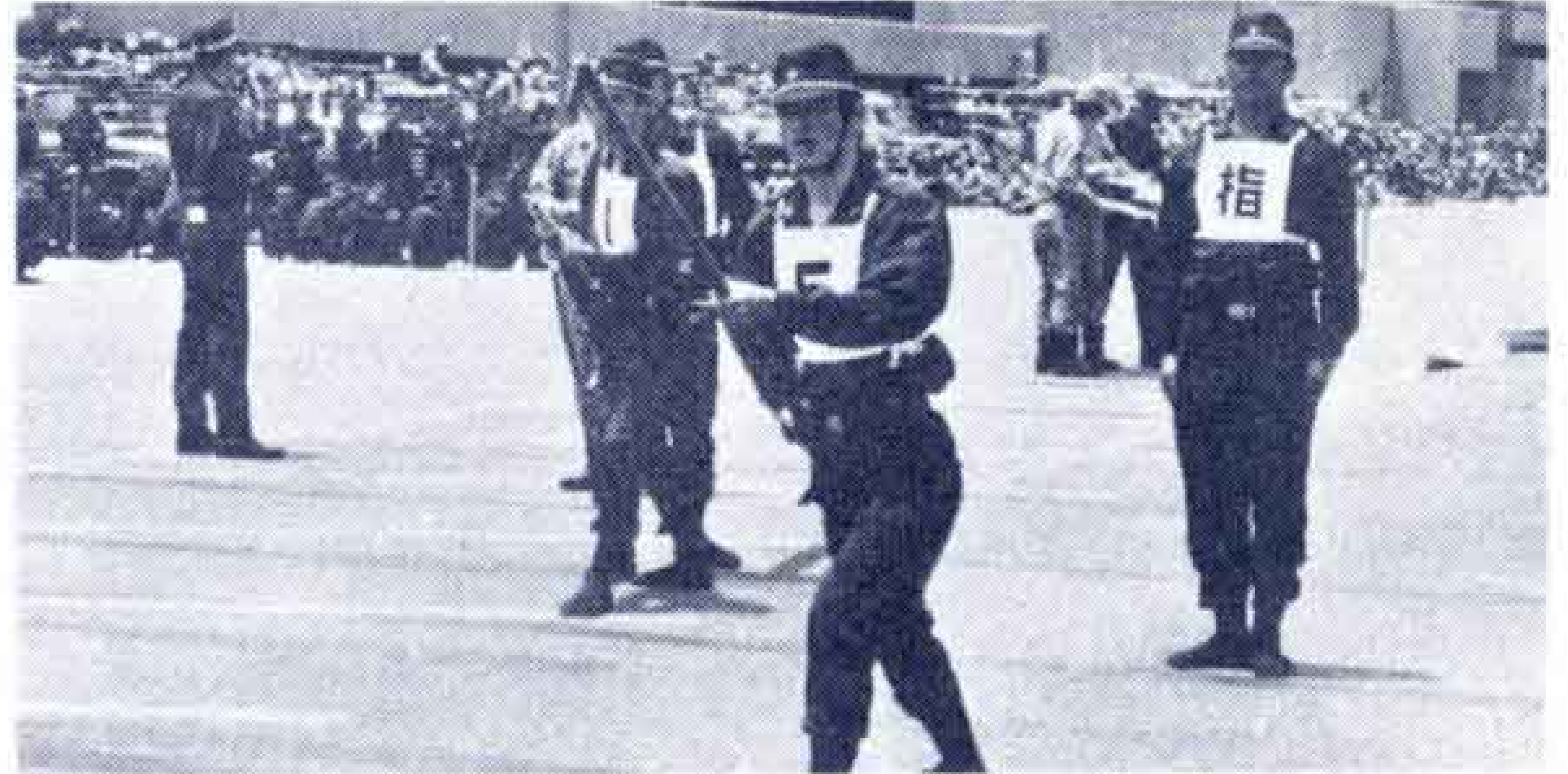
【小型消防ポンプ操法】

富士、富士宮、芝川、2市1町合同の県消防協会富士支部連合演習が、7月4日市庁舎北側広場で行われました。この演習には、消防車38台と約900人の消防団員が参加し、日頃の訓練成果を競い合いました。結果は訓練礼式と消防操法で富士市が、小型ポンプ操法で富士宮市が、それぞれ優勝しました。