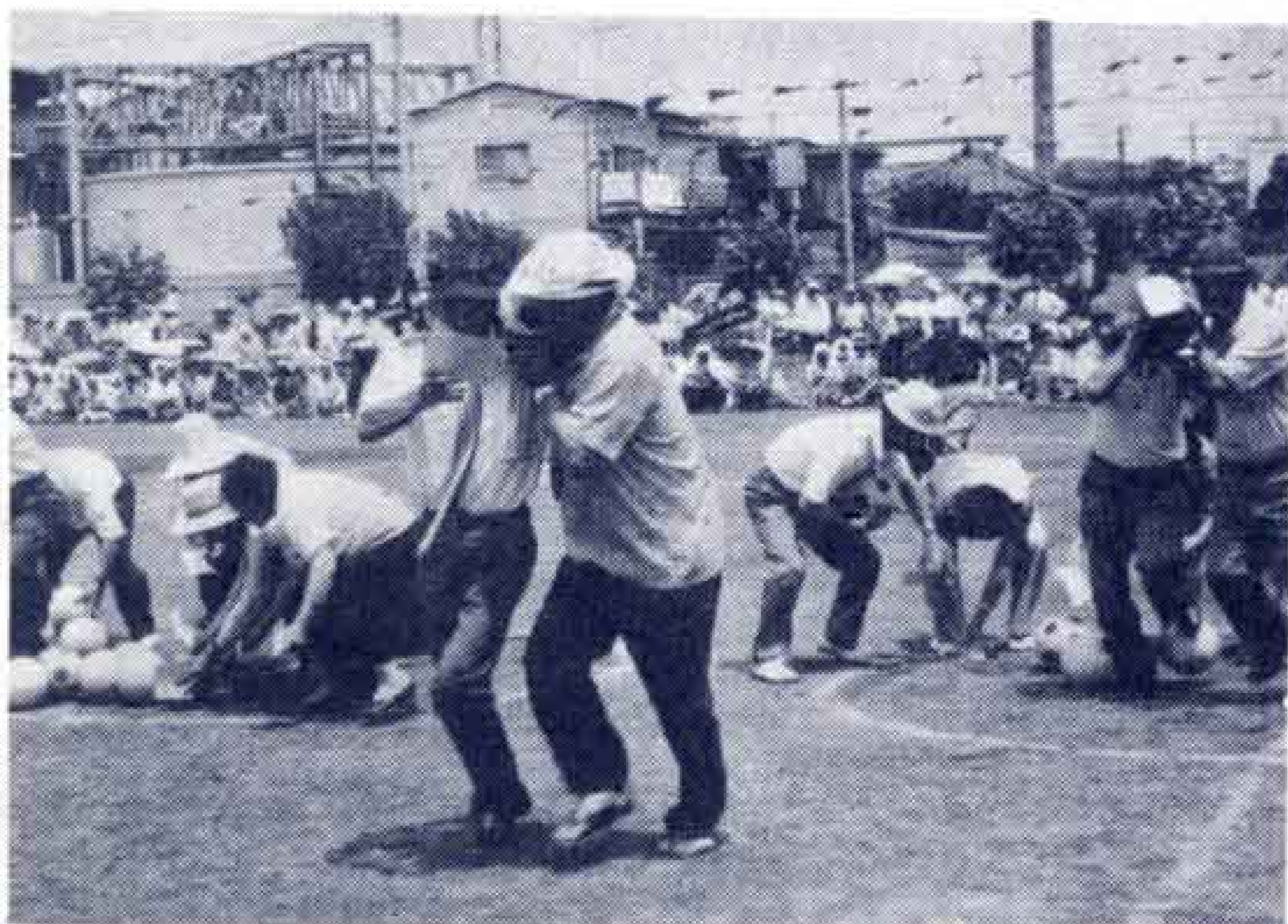
〔老人福祉活動にも…〕