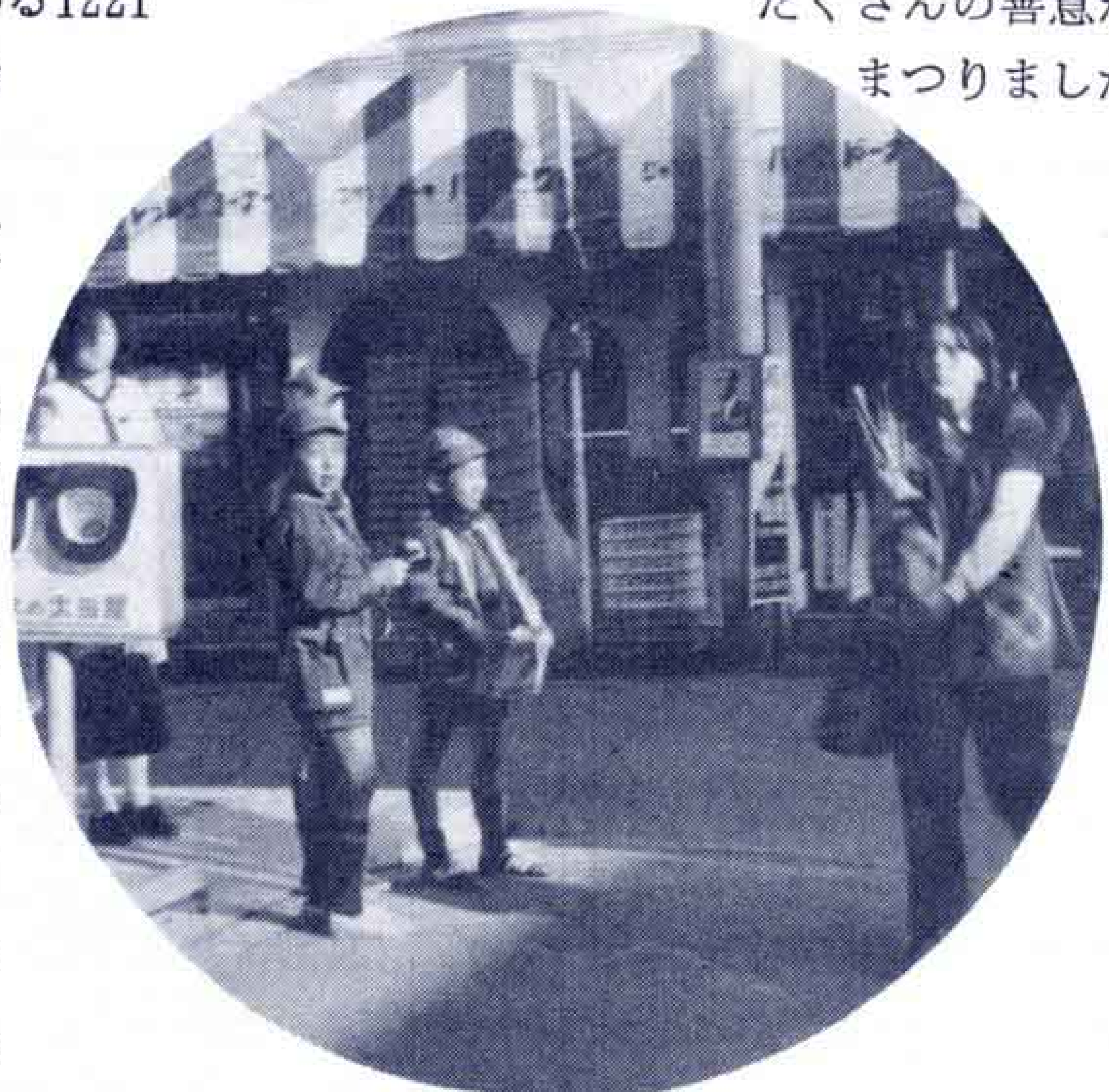
〔目標を上まわった共同募金〕

会が全家庭を対象に行った「歳末たすけあい袋」が好成績をおさめ、総額751万3531円のほか、衣類など、たくさんの善意があまりました。