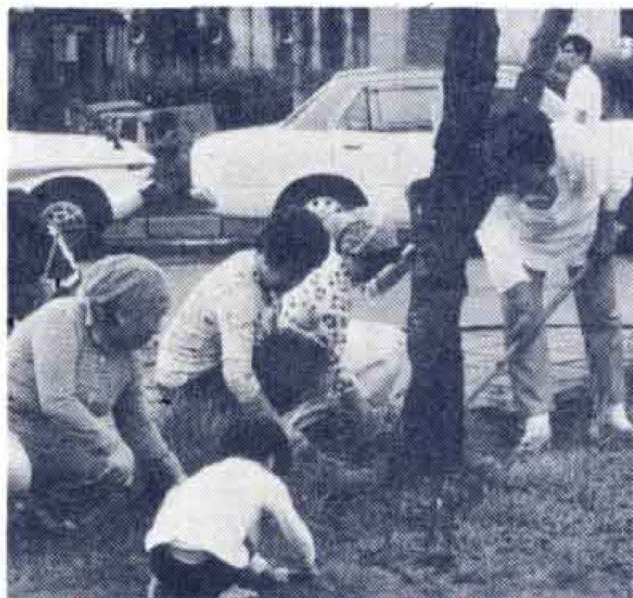
【東名富士インターの草とり】

■6日は、いま、守ろうこの環境…をテーマに連合婦人会員約3300名が中心となって老人会や花の会、青少年グループ連絡協議会などの協力で東名高速道路の富士インターや公園神社など公共施設の美化清掃を重点的に行いました。このほか市内8つ