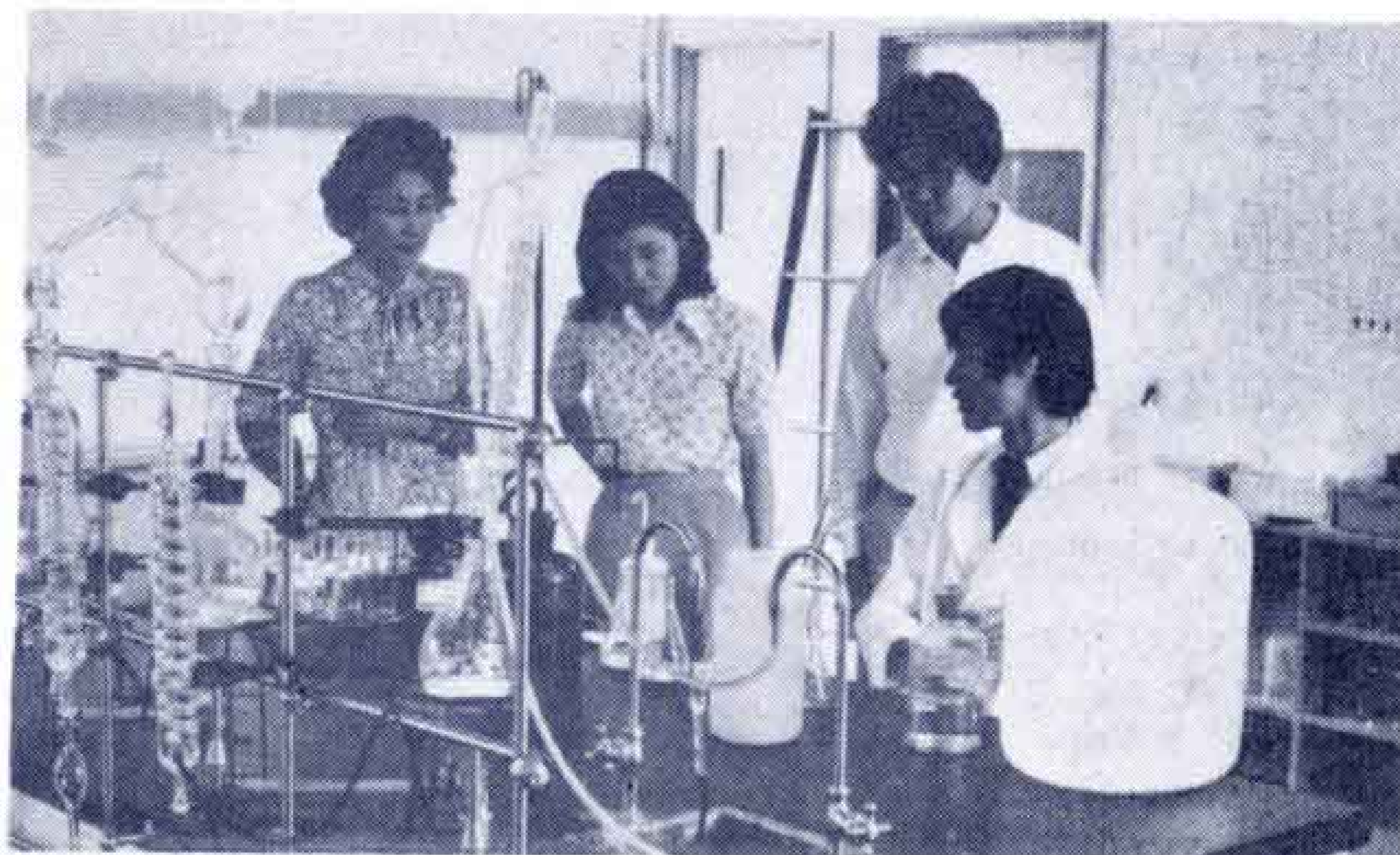
【公害分析センターを一般に公開】

学校では、美しい環境づくりの願いをこめて、タンザクや花の種をつけた風船を790名の児童が一斉に大空へ放ちました。(表紙写真)このあと5・6年生250名が市の環境測定車を見学しました。