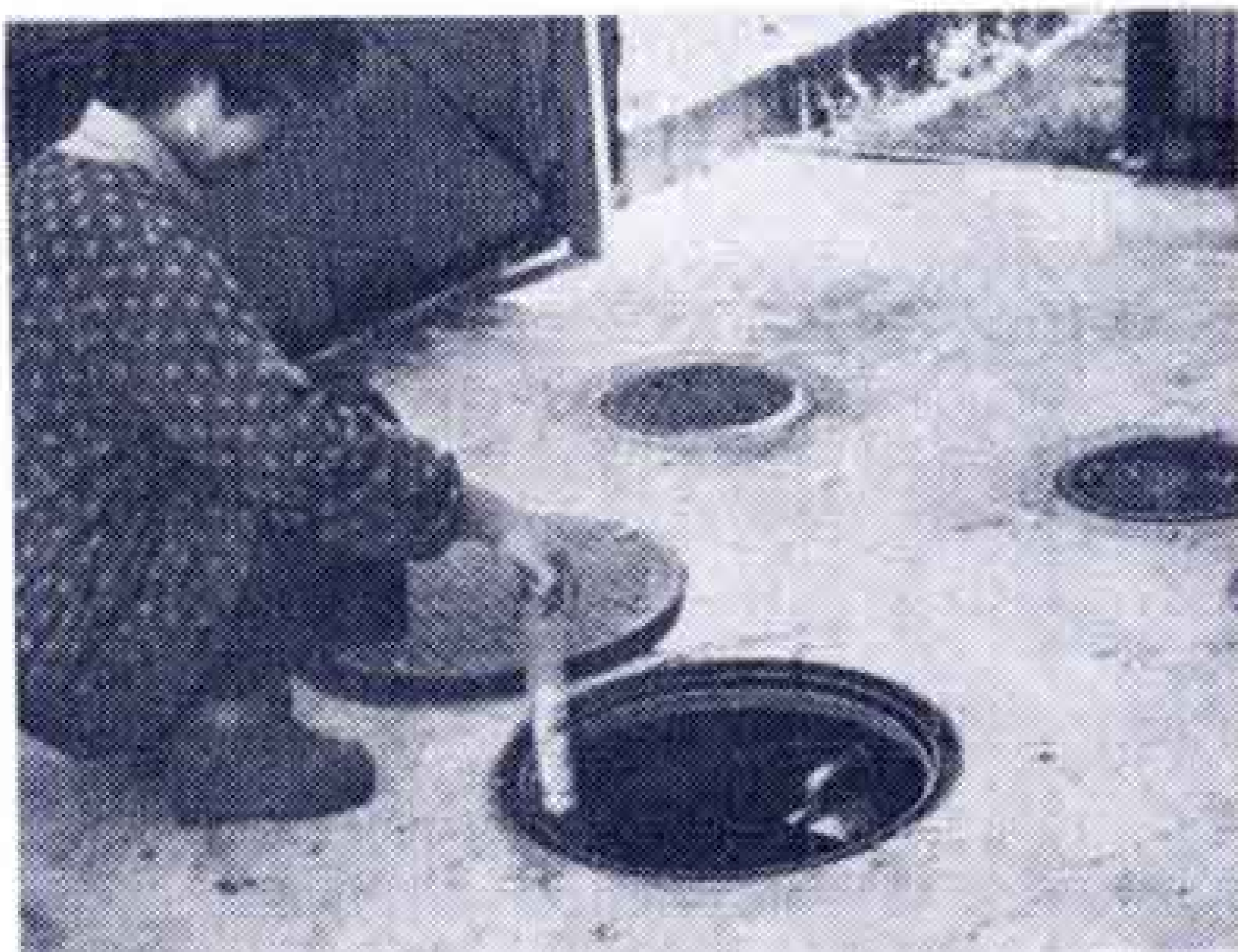
【消毒薬の点検補給も定期的に…】