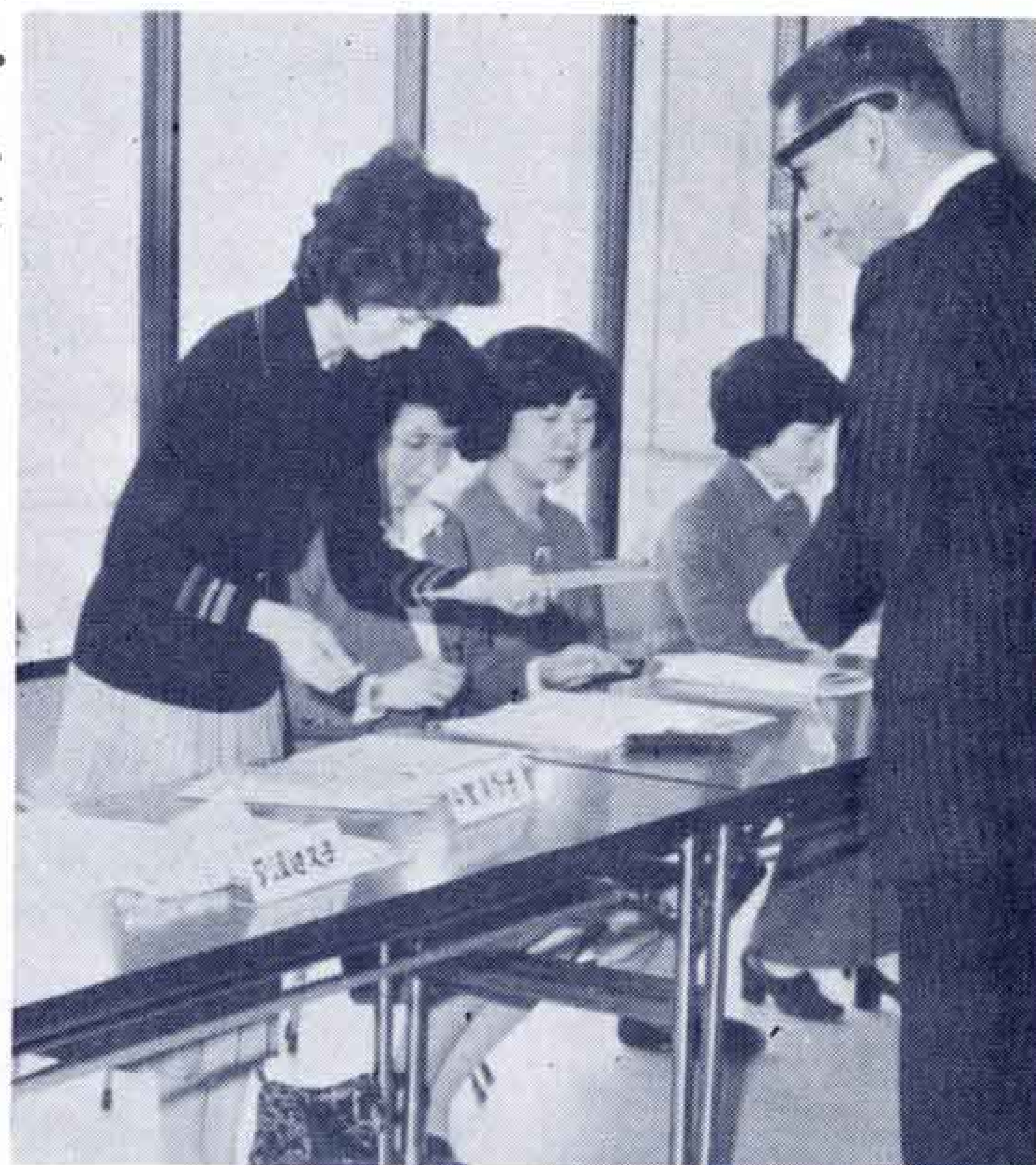
【委嘱状を受ける消費生活モニター】