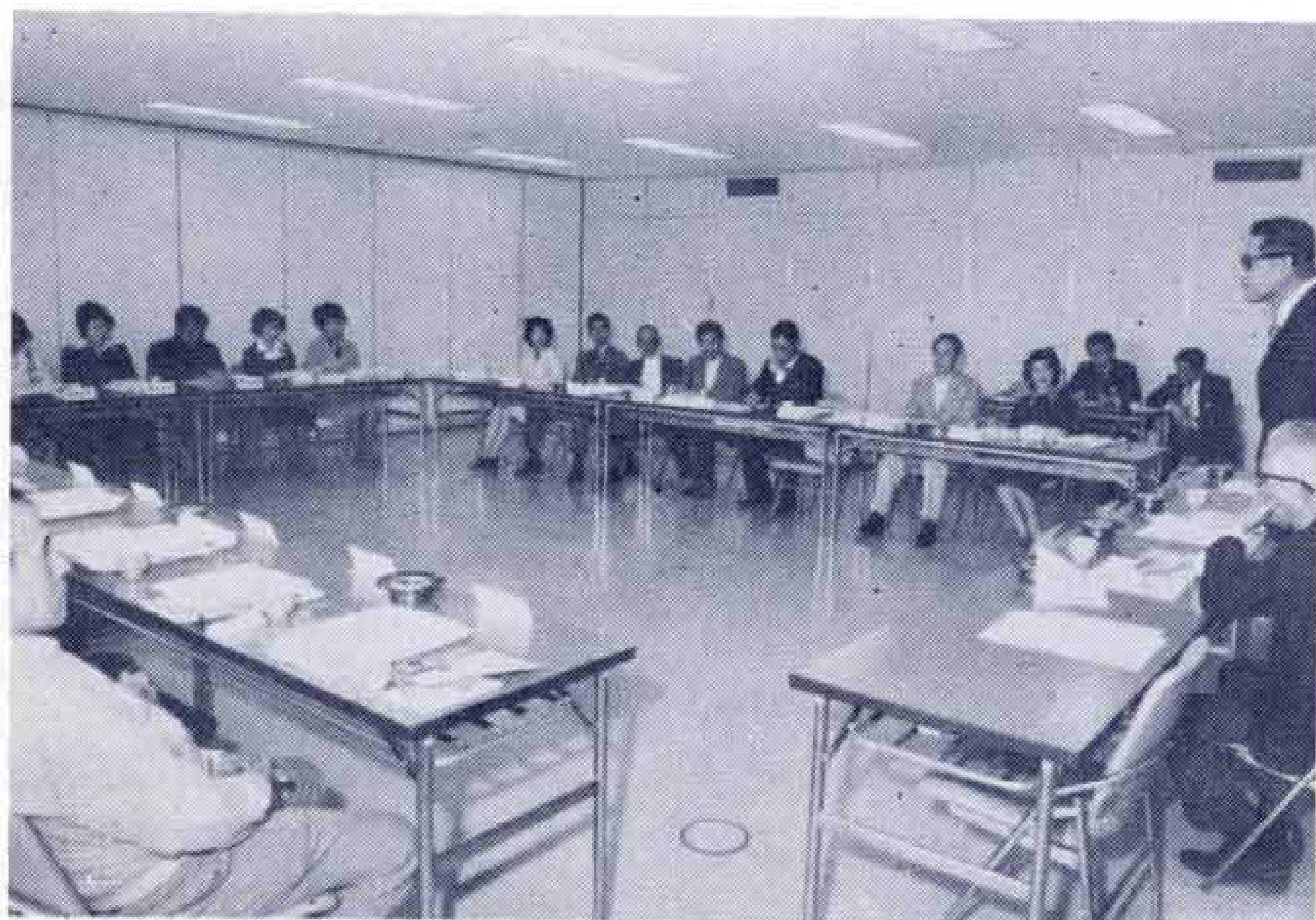
【市政モニターのみなさん】

の意見、要望、苦情などをモニター通信で出していただきます。なお、これらの情報もさることながら、「かしこい消費者」となるための研修や実践活動で、市民ひとりひとりの知識の向上にも努めていただきます。