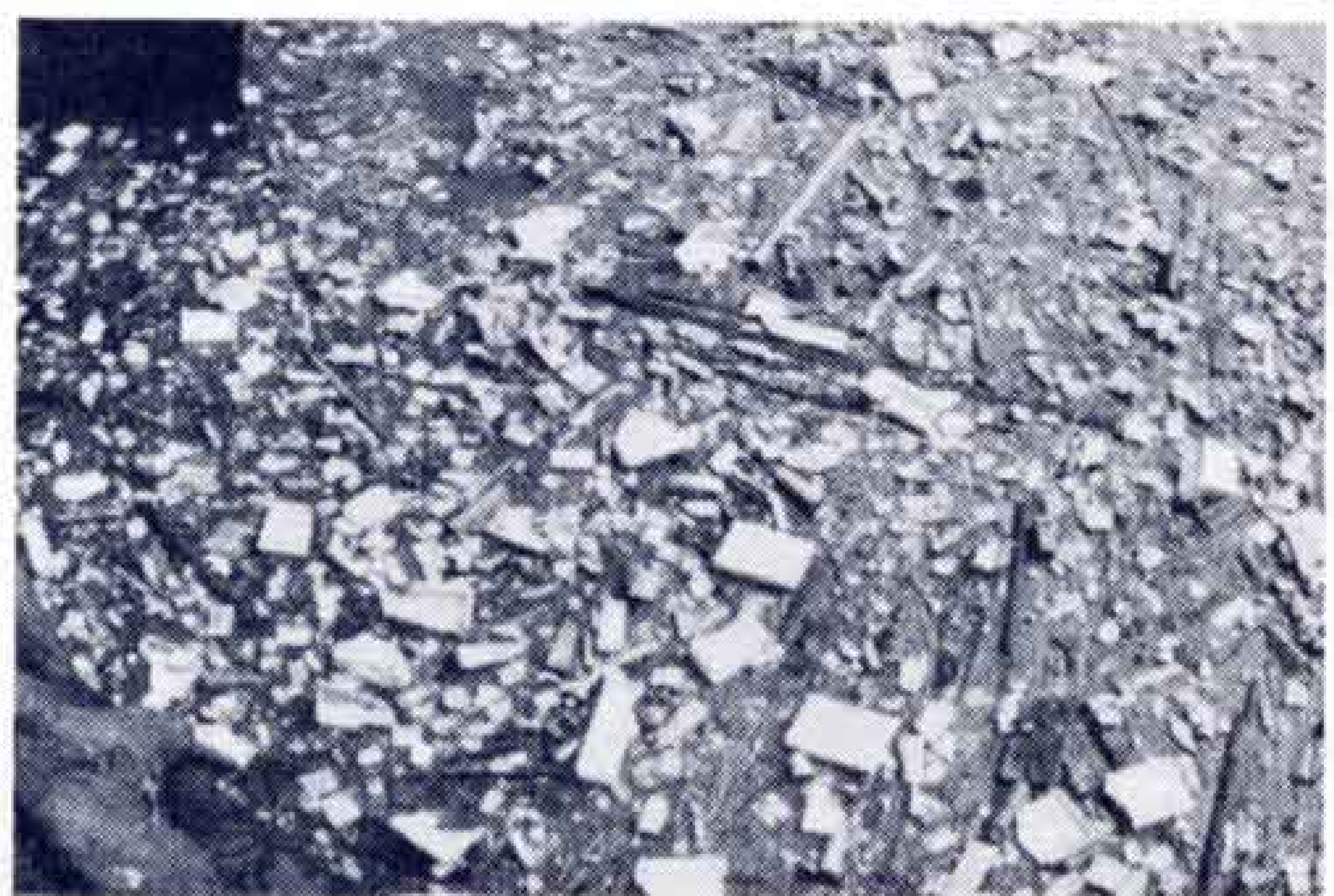
【ゴミは美観をそこねるばかりか災害の原因に】