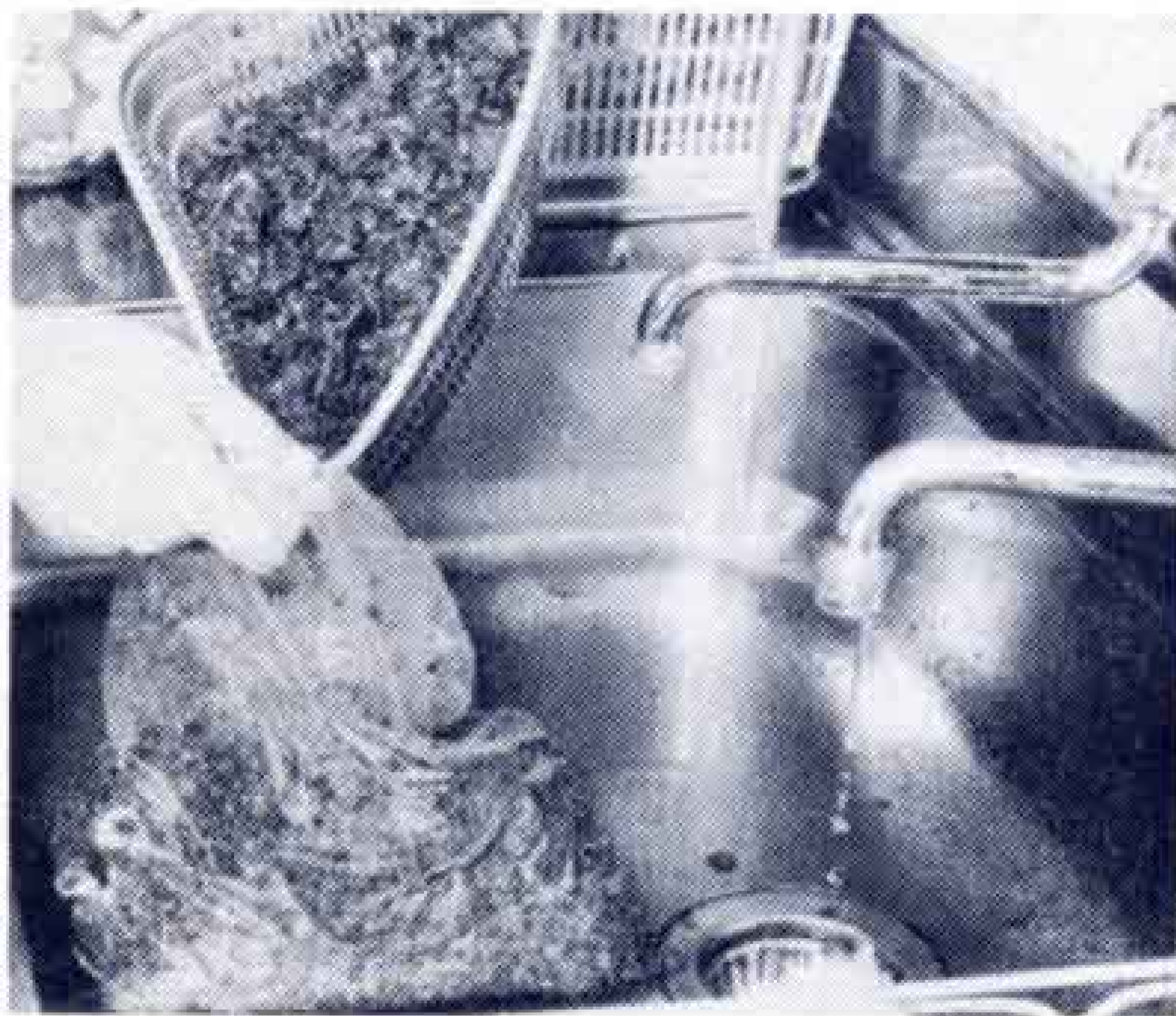
【ビニール袋へ燃えるゴミを入れないで】