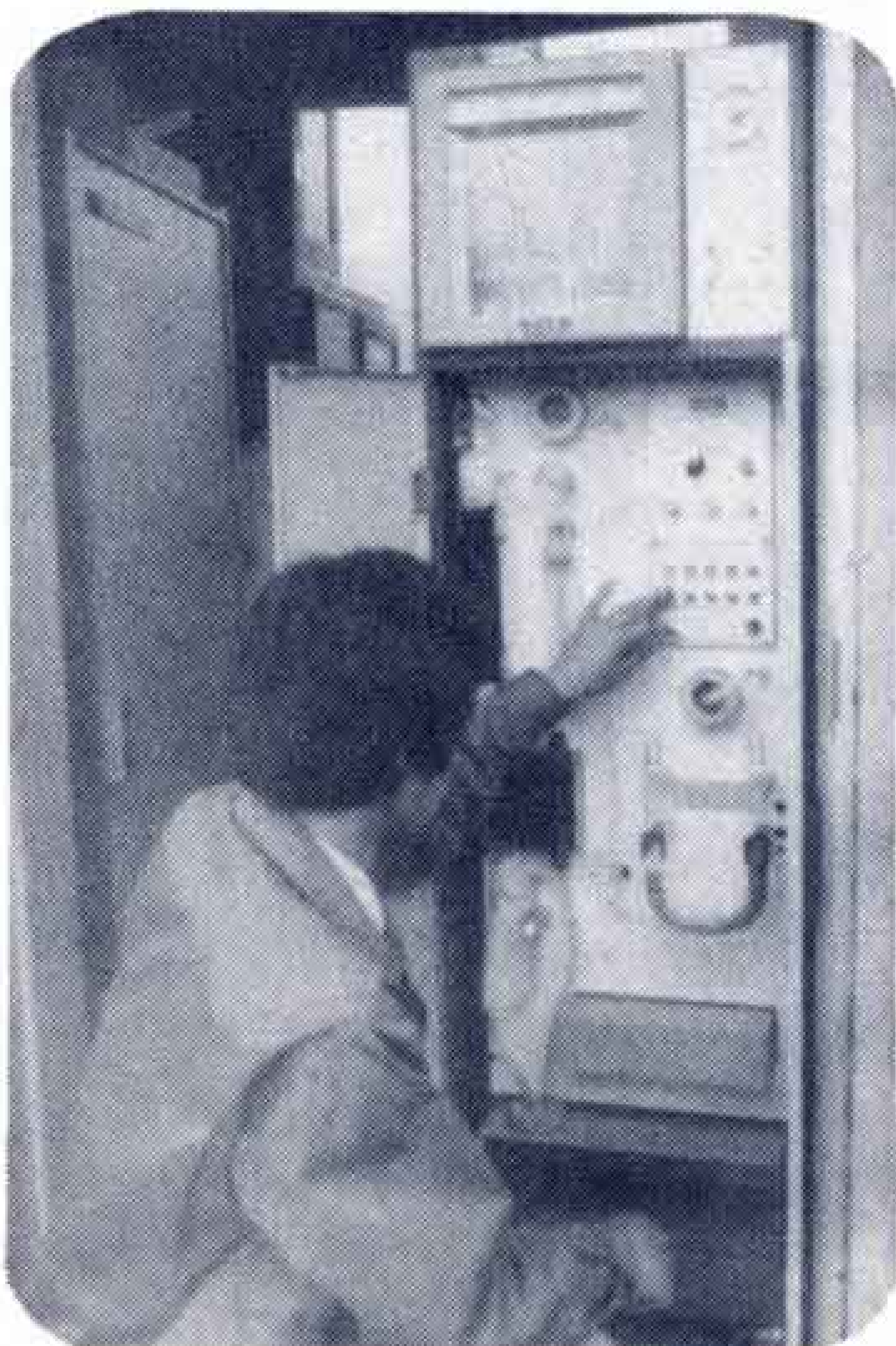
常時測定点でオキシダント濃度を測定し、テレメーターに送り、高濃度になると注意報や警報などを発令します