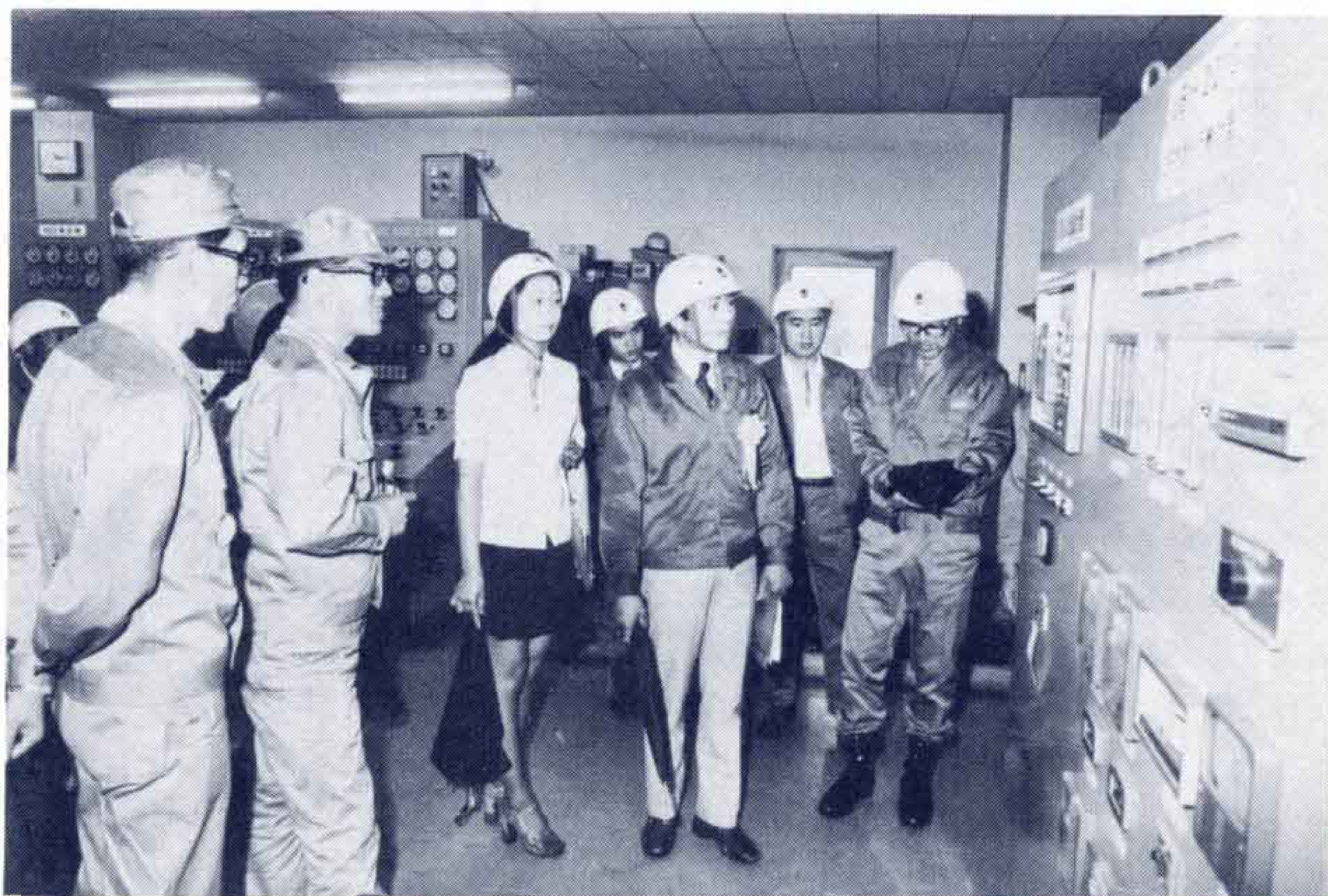
【公害防止施設の視察を行なう1日機動隊員】