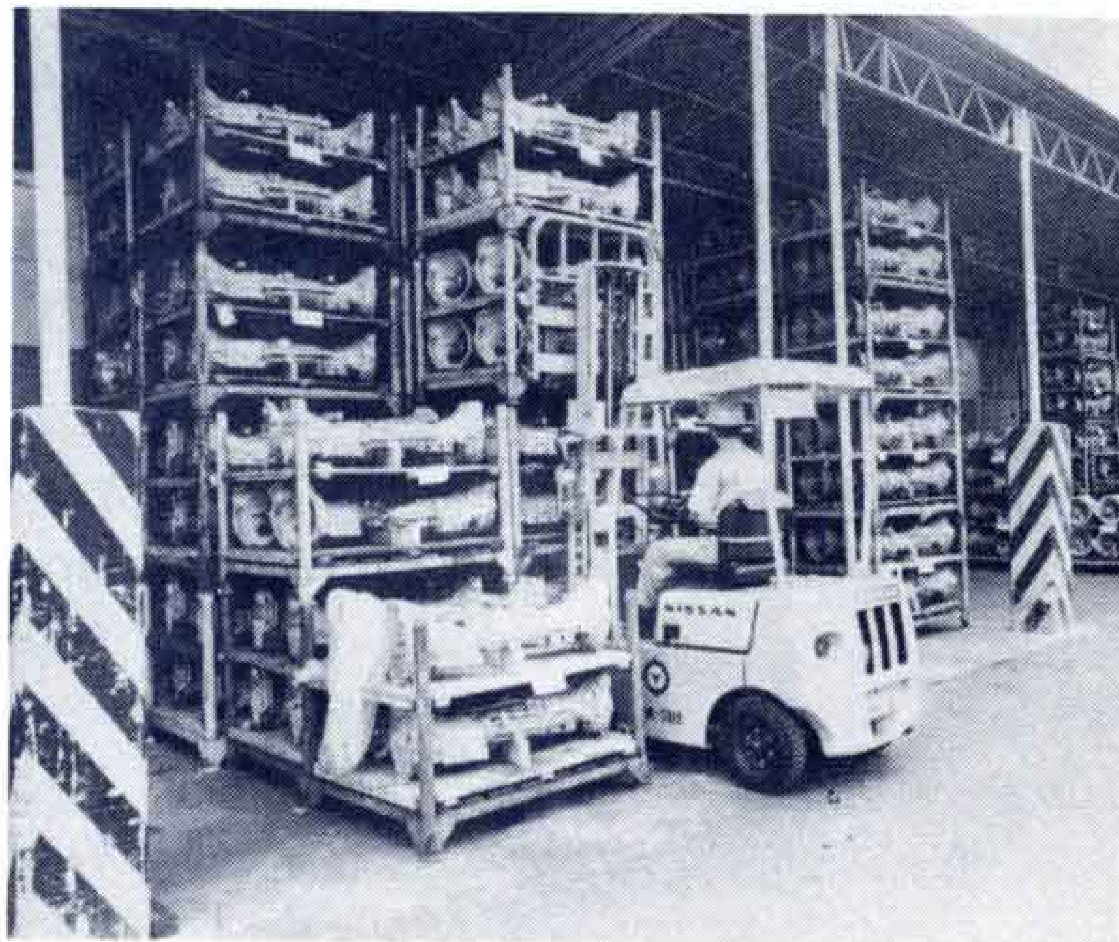
【輸送用機械の出荷額は1258億円】