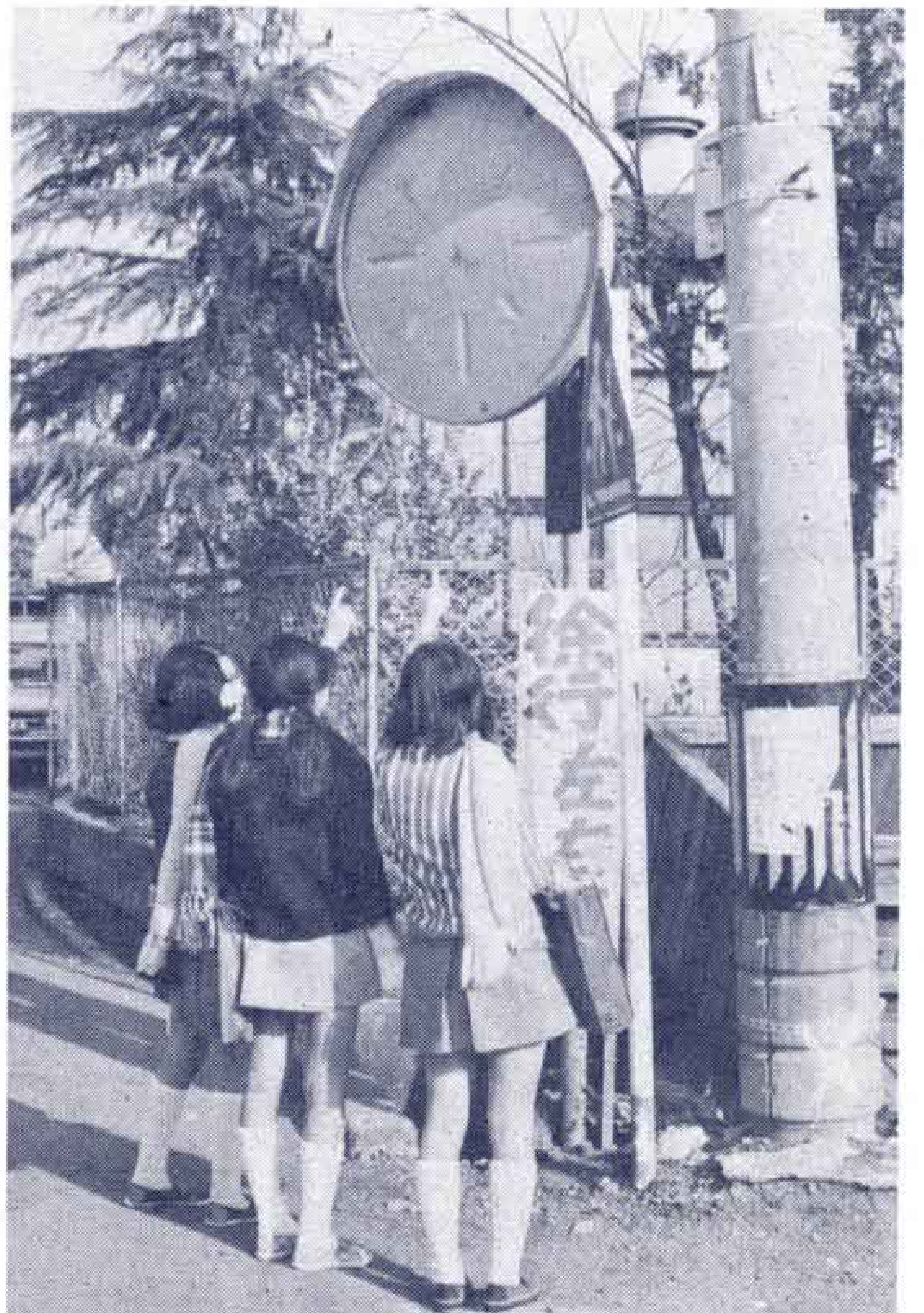
■1年間で10カ所もこわされたカーブミラー