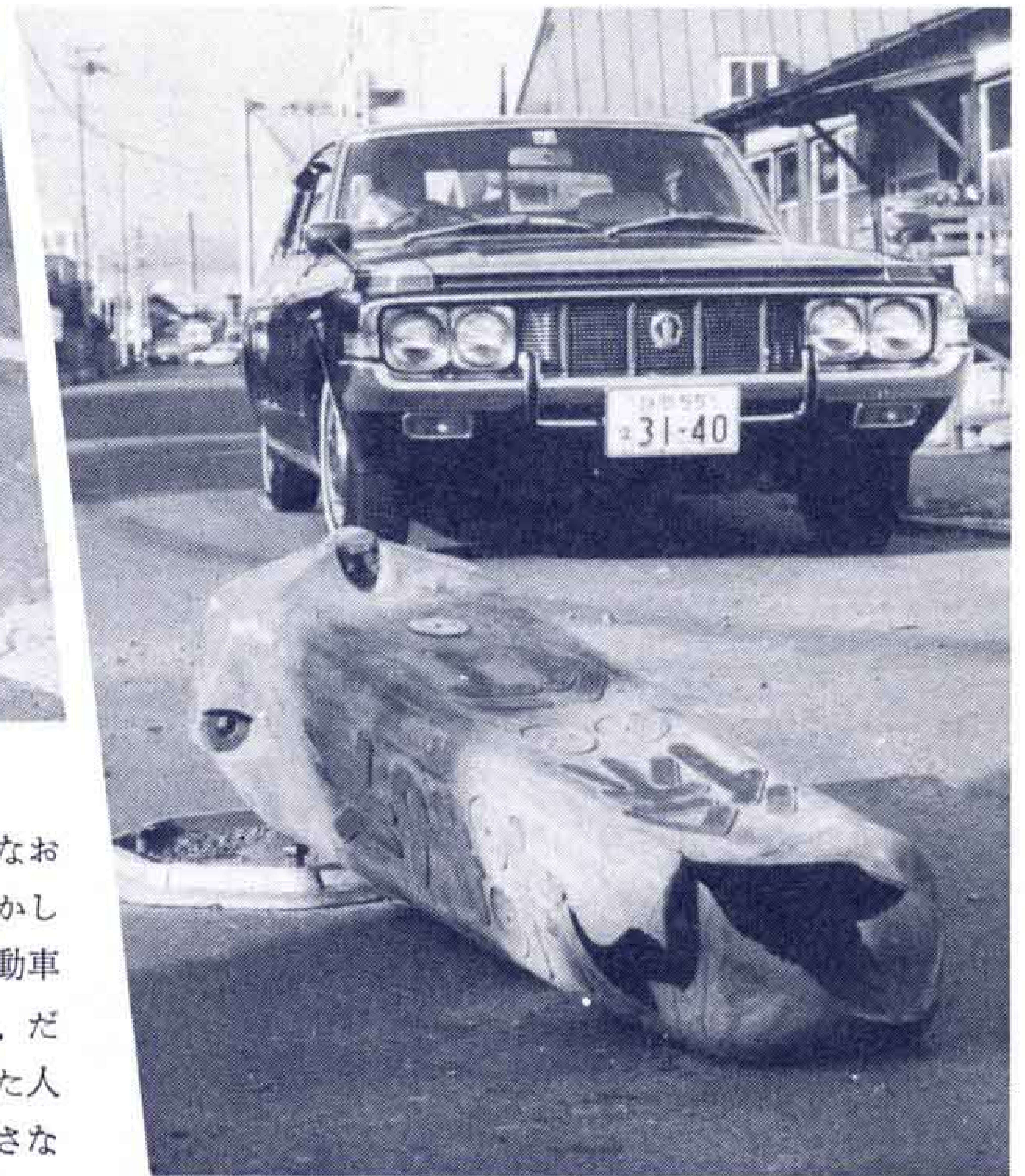
■センターポールは25本こわされ補修費が23万円かかりました

そうした費用のことばかりでなく、安全施設は危険な場所や注意してほしい所に設置してありますから、こわされても補修しなければなりません。いたずらでこわしたりするのは、絶対やめてください。