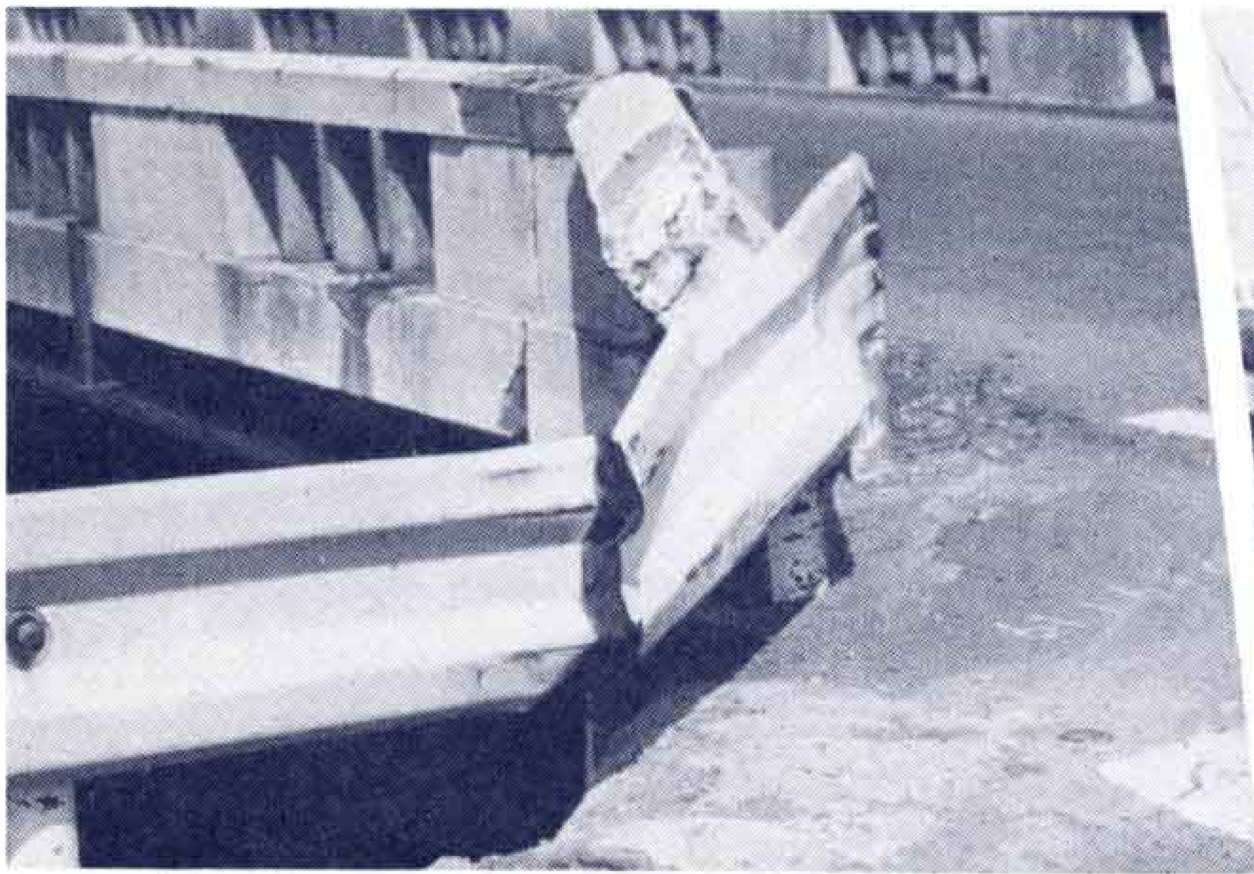
■事故のまきぞえに合ったガードレール

市内で現在登録されている自動車は7万4279台（49年3月31日現在）これに自軽車を含めるともう数えきれません。自動車台数の増加にともない交通事故も増え続けてきました。このため道路や交通安全施設の整備を進め、増加する事故対策を行なっています。ところが、交通安全施設が多くなるにしたがい、こわされる施設も増えてきました。