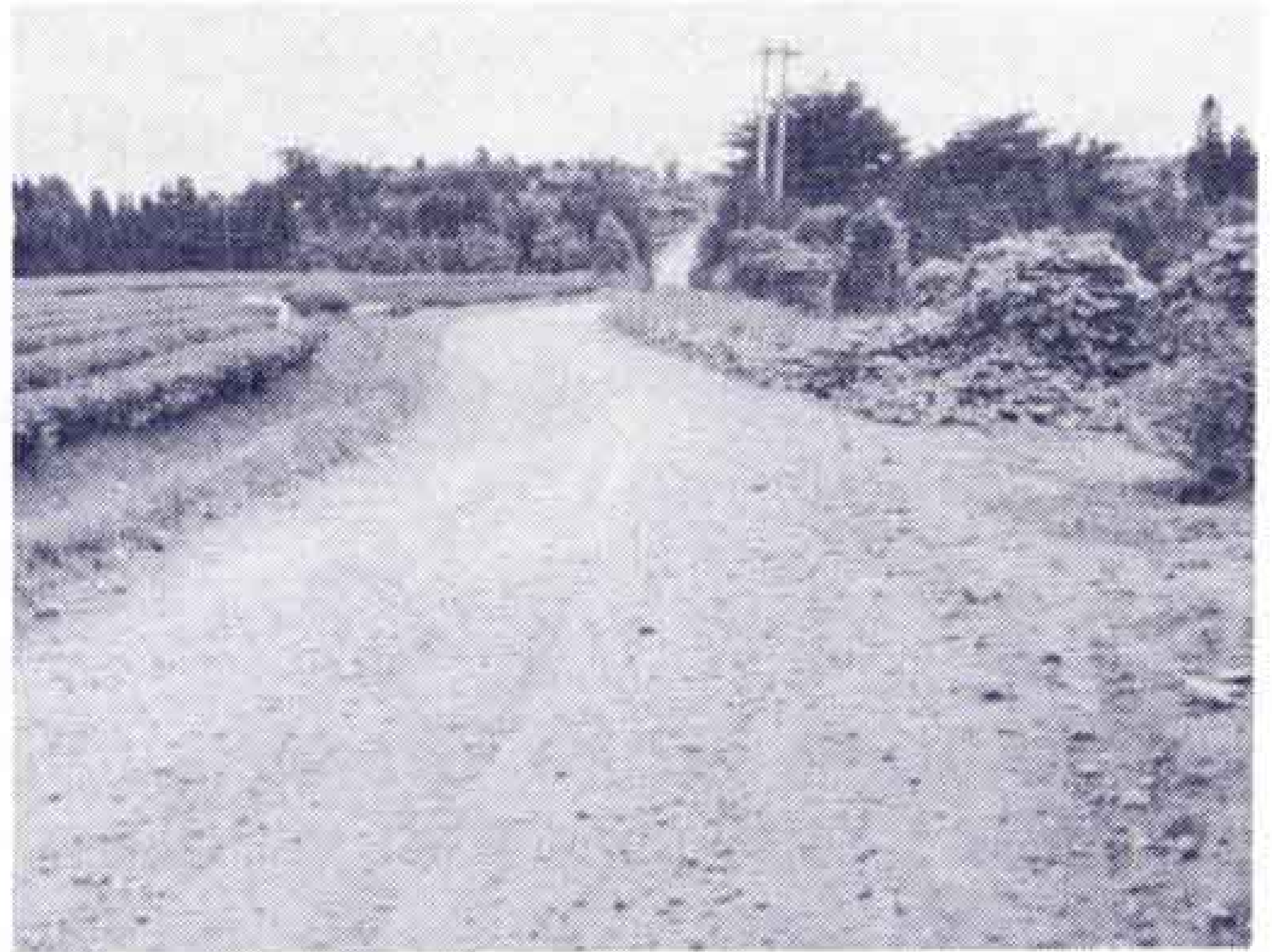
【洗濯板を早く解消して】