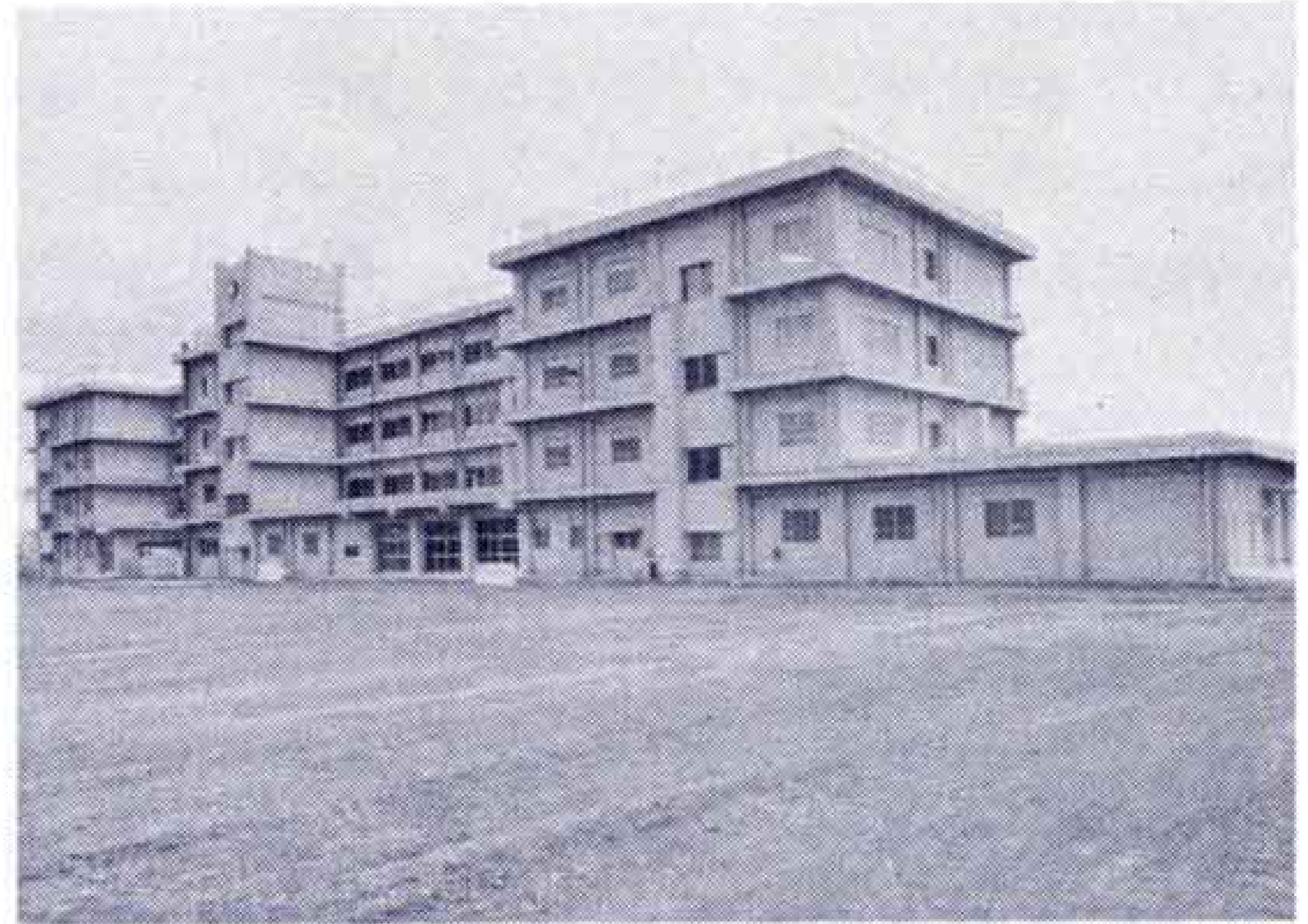
【3月議会で田子浦中の用地費などを補正】

昭和47年度の一般会計当初予算は87億390万円でしたが、最終予算は116億9322万円となり、当初予算にくらべ27億8932万円が追加補正されました。追加補正された主なものは次のとおりです。