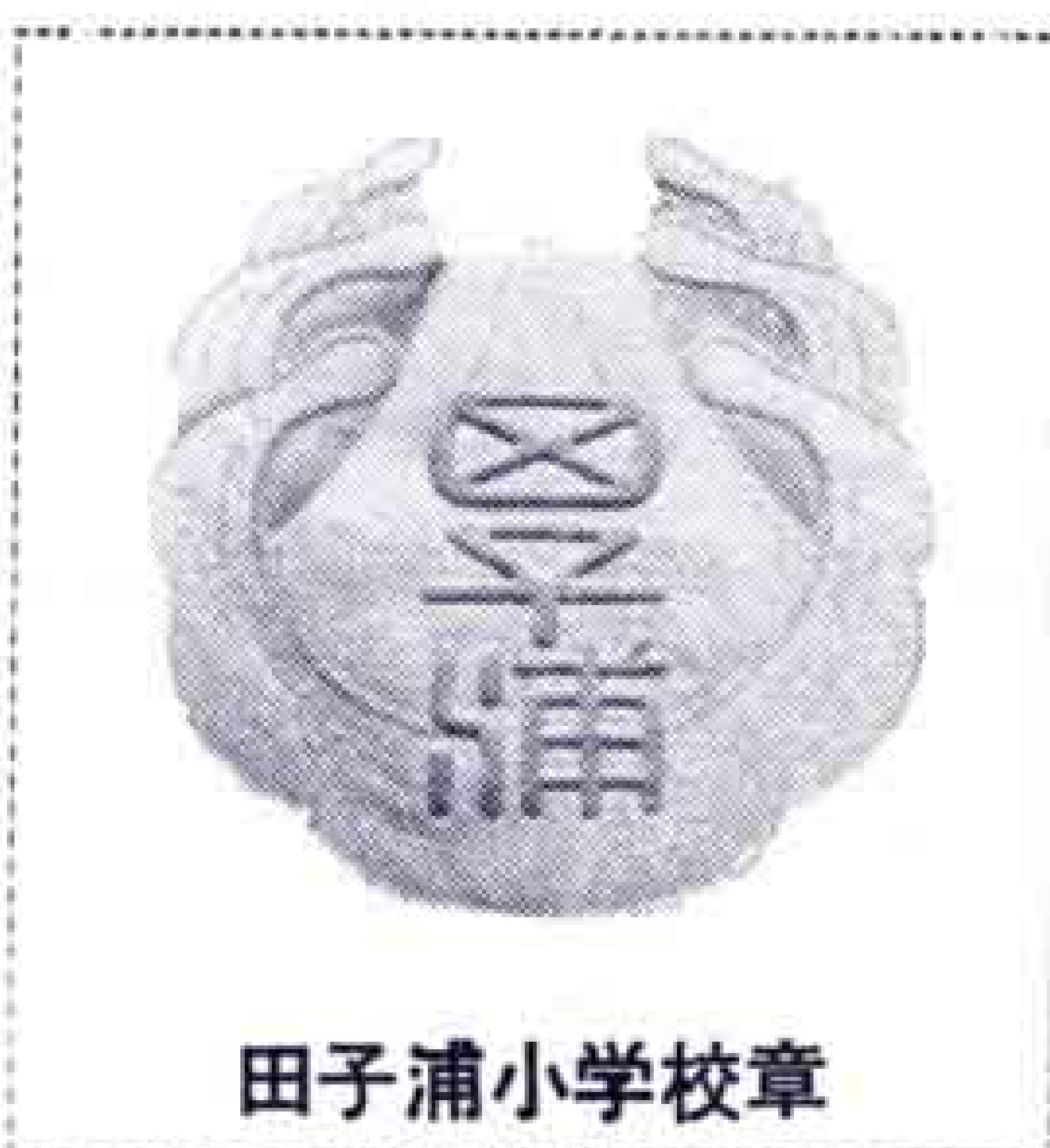
田子浦小学校校章

わたしたちは、マラソンをやつたあとそのまま半そてつでいます。冬は、マラソンで運動場を730しゆうまわります。それは、富士から東京までのきよりと同じです。みんなは東京をめざしてがんばろうといつています。わたしは、大そてつのような人になりたいとどうじにこの学校は日本一、いや世界一いい学校だと思ひます。