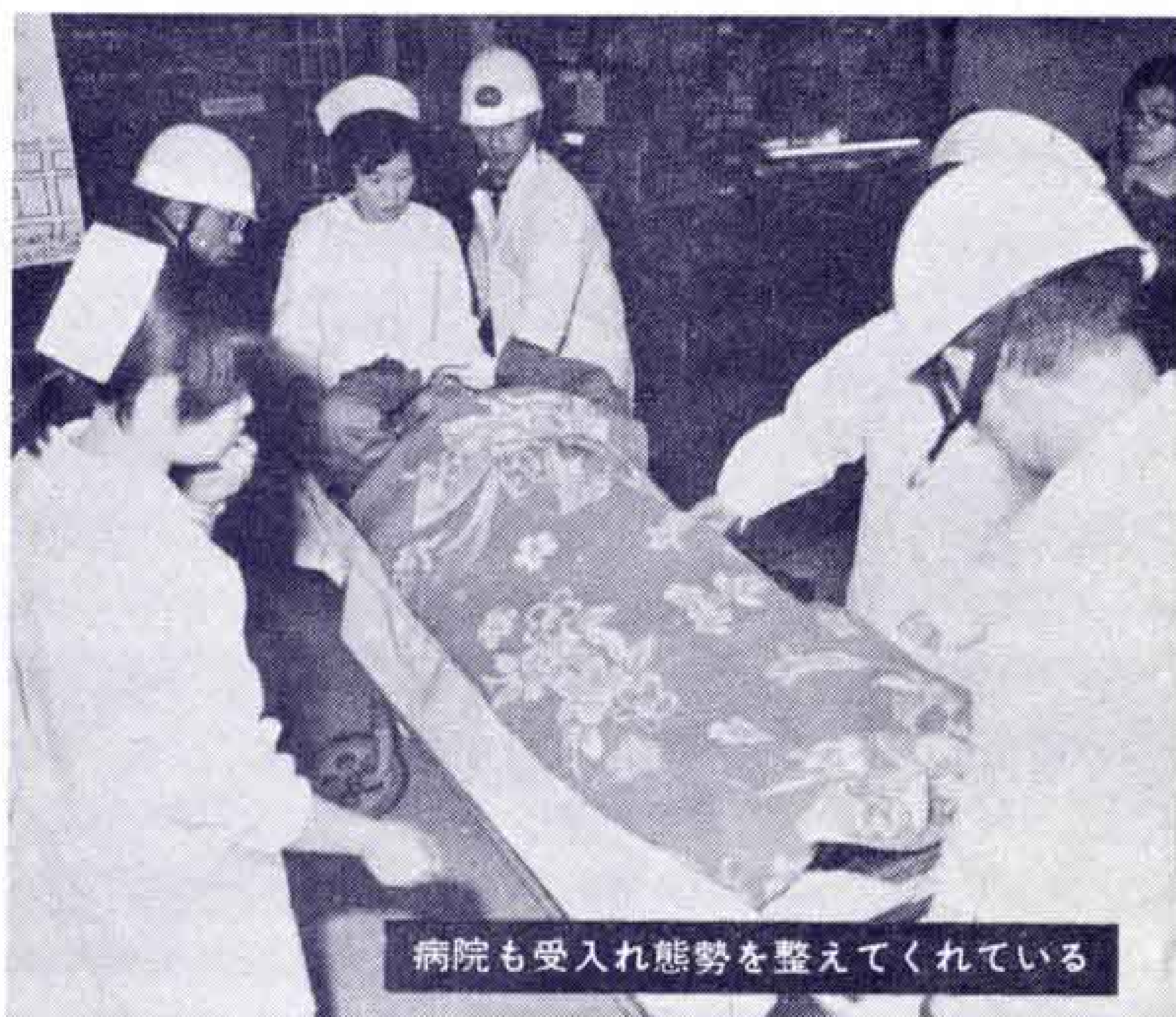
病院も受入れ態勢を整えてくれている