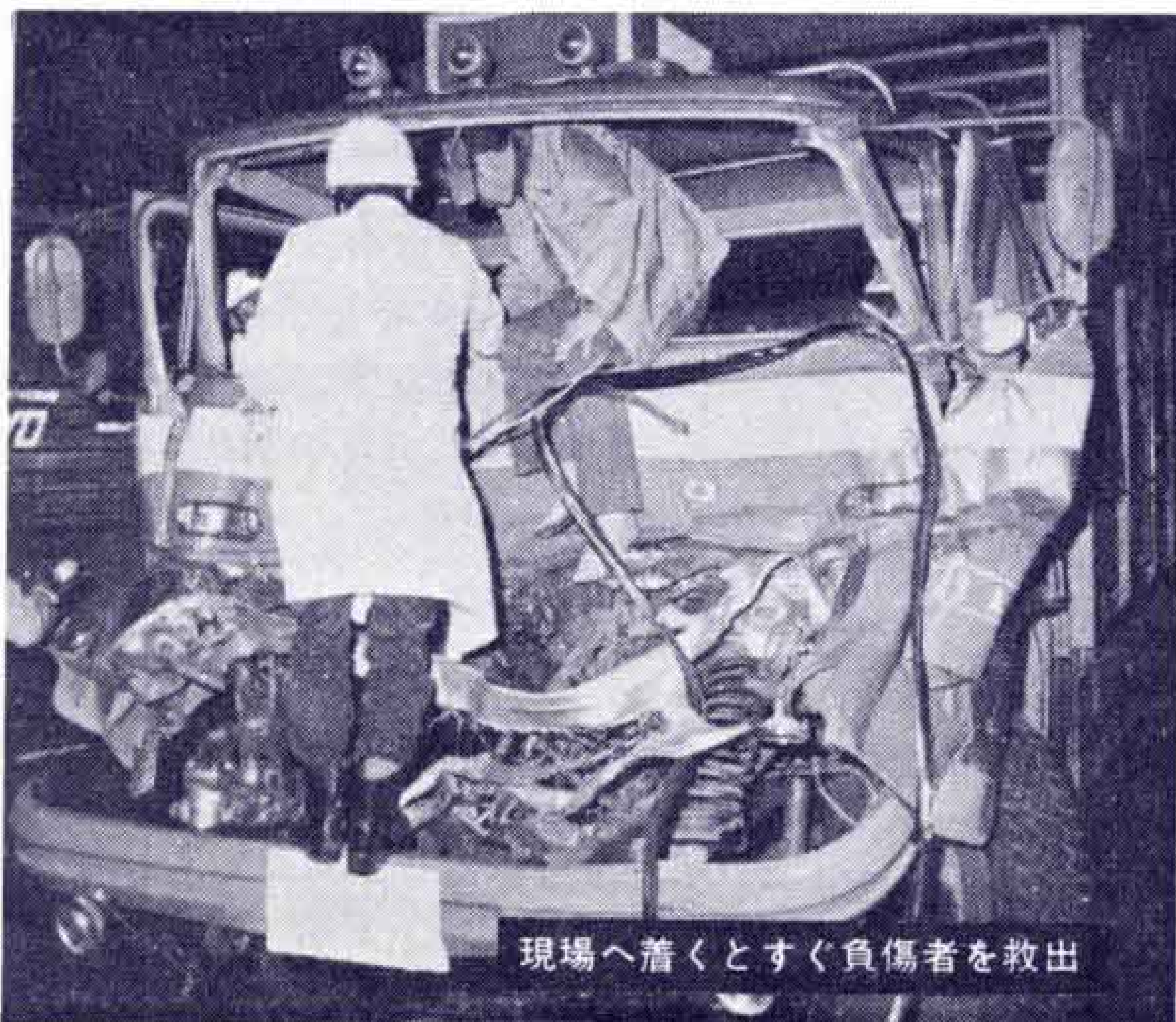
現場へ着くとすぐ負傷者を救出