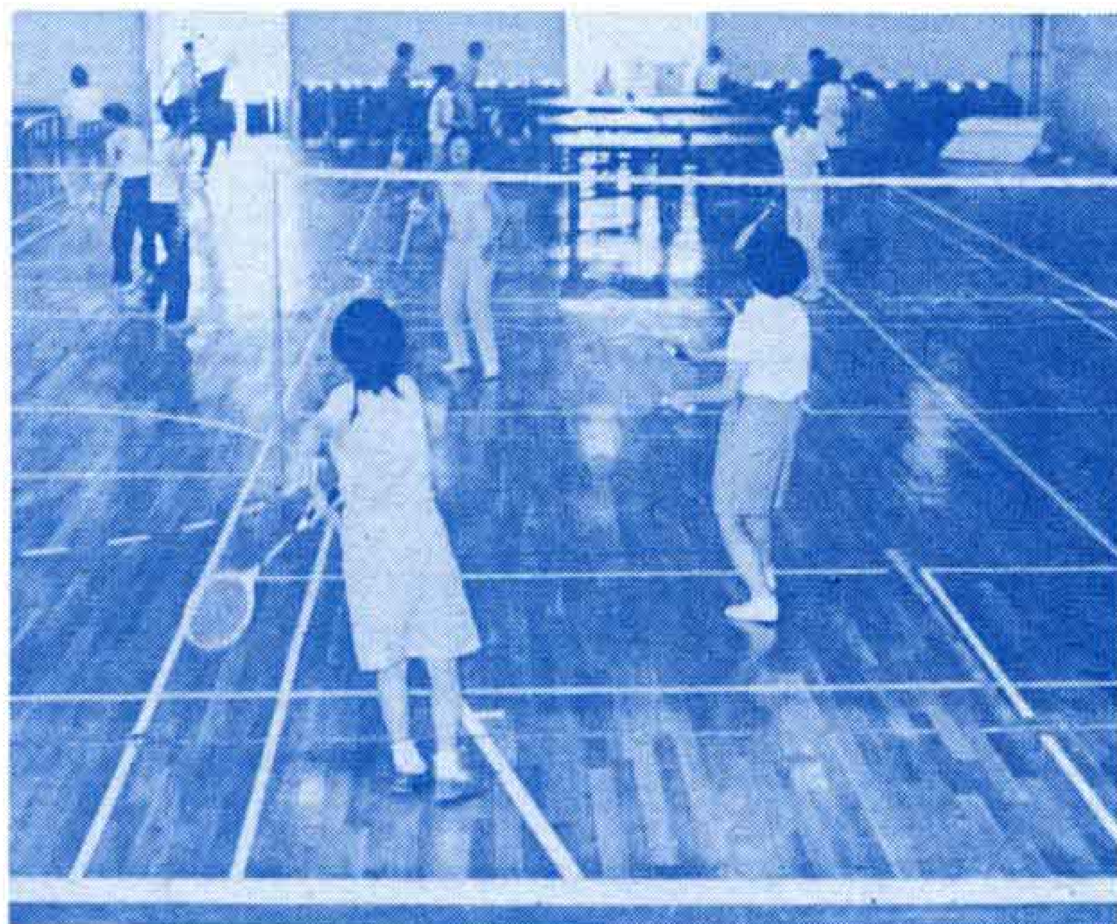
【スポーツ教室で体力づくり】