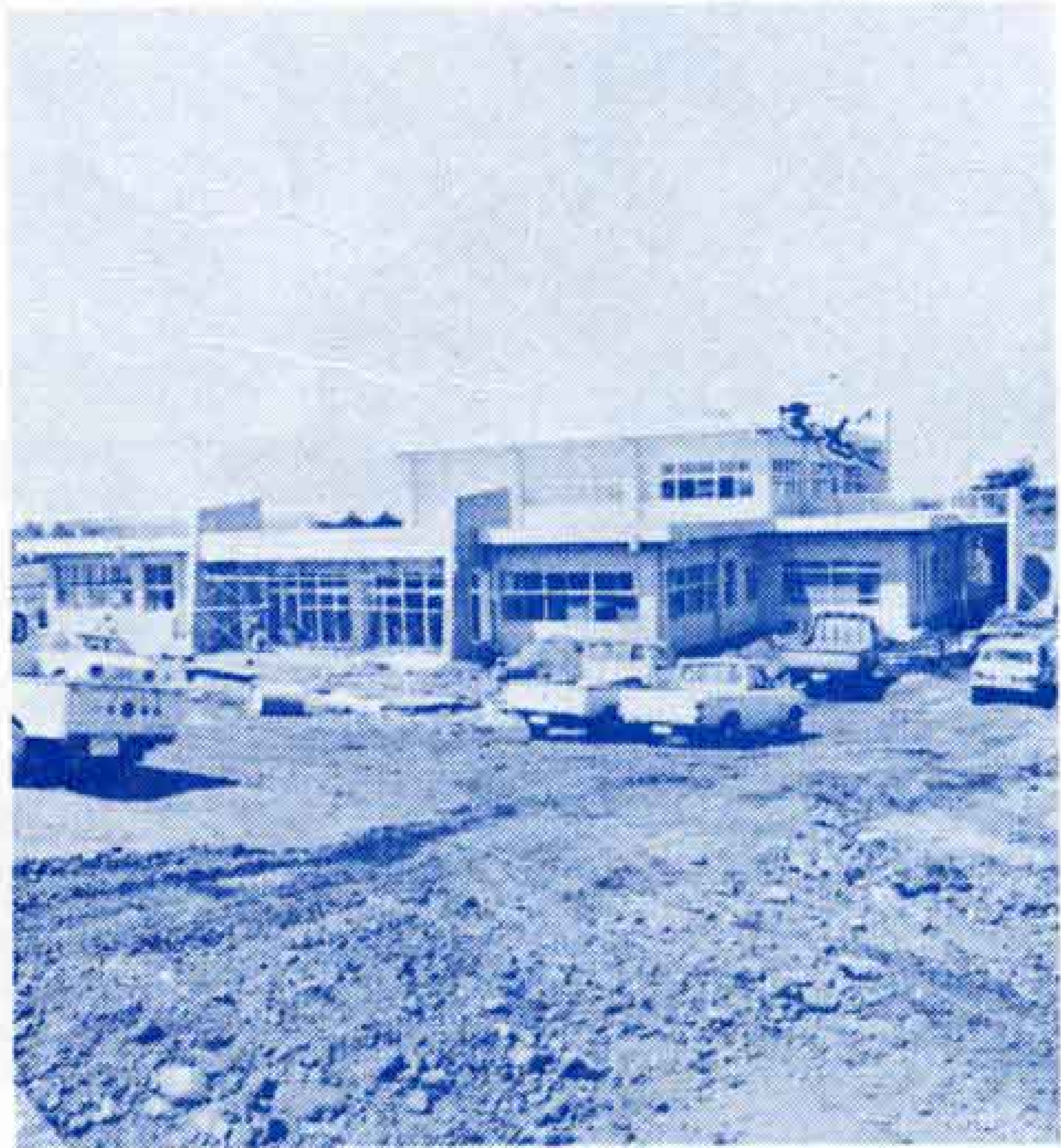
【最後の仕上げを急ぐ社会福祉センター】