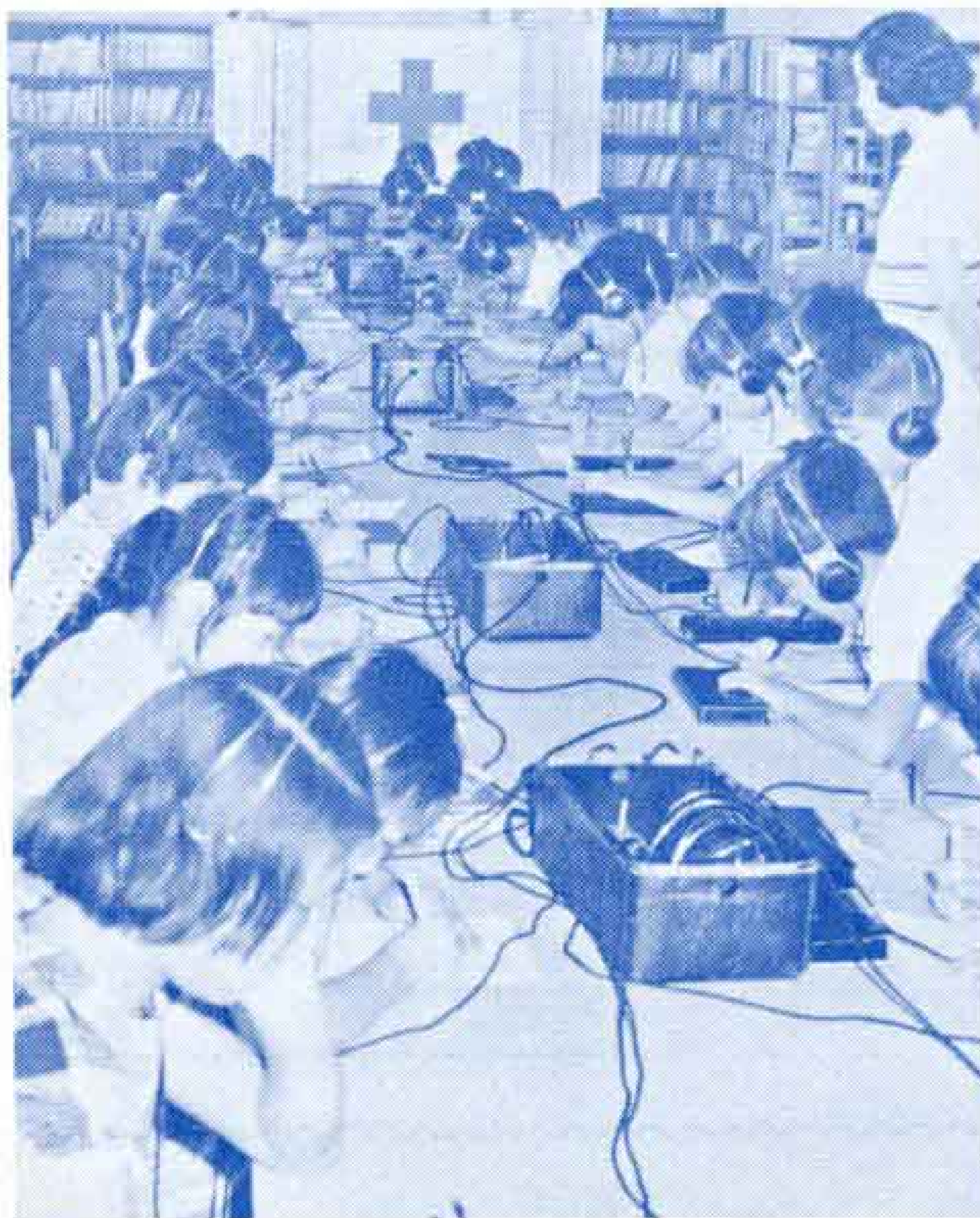
【とかく発見しにくい聴力の測定などを行なっています=富士第1小で=】