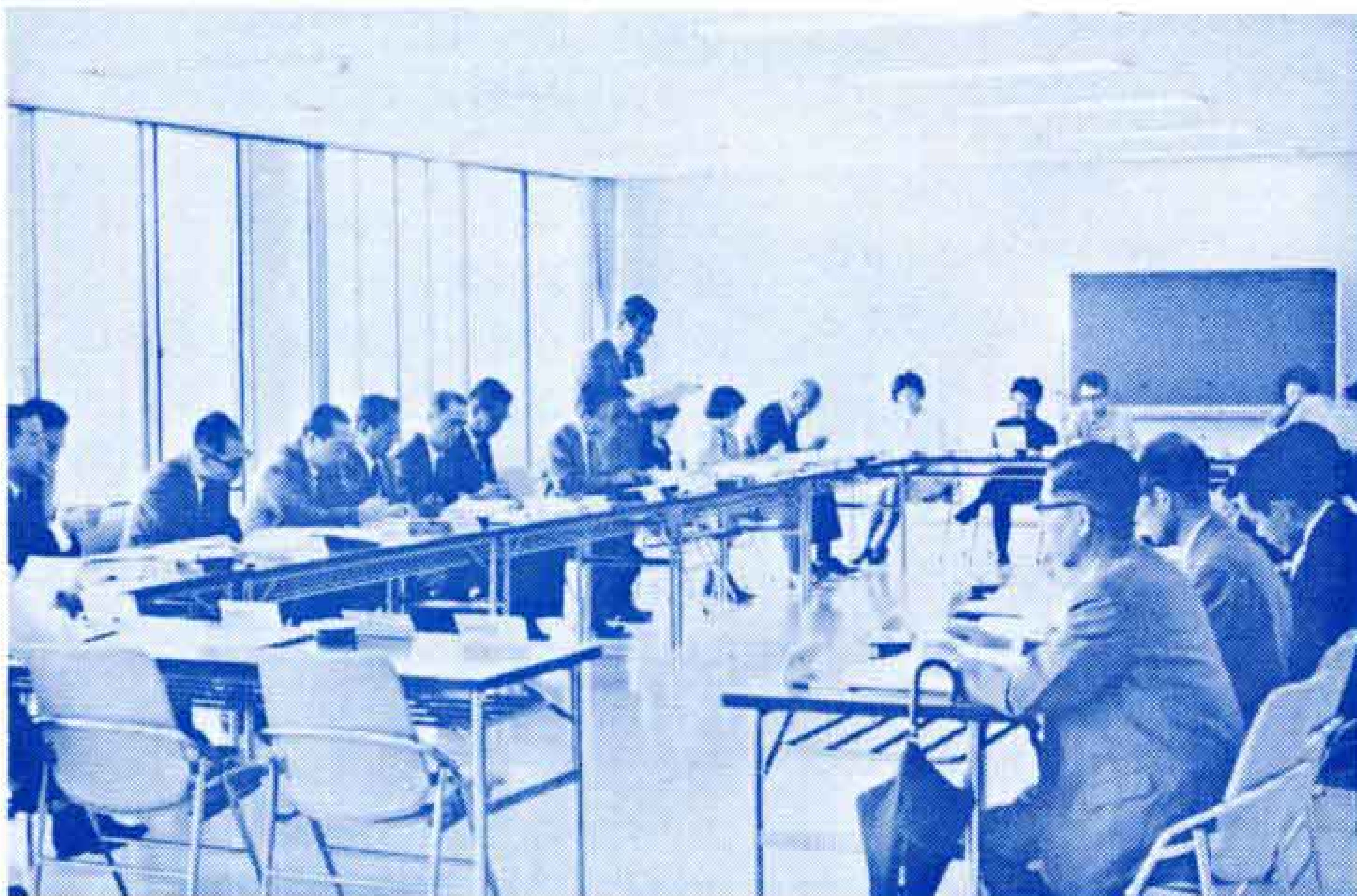
【活発に意見の交換が行なわれた 第1回モニター会議】

モニターの任期は48年3月31日まででこの間、市政に対する意見や苦情などをモニター通信で寄せていただいたり、モニター会議への出席、アンケートに対する回答などの仕事をしていただきます。市ではモニターのみなさんから出された意見をできるだけ市政に取り入れ、だれもが住みたくなる富士市の建設に努力してまいります。