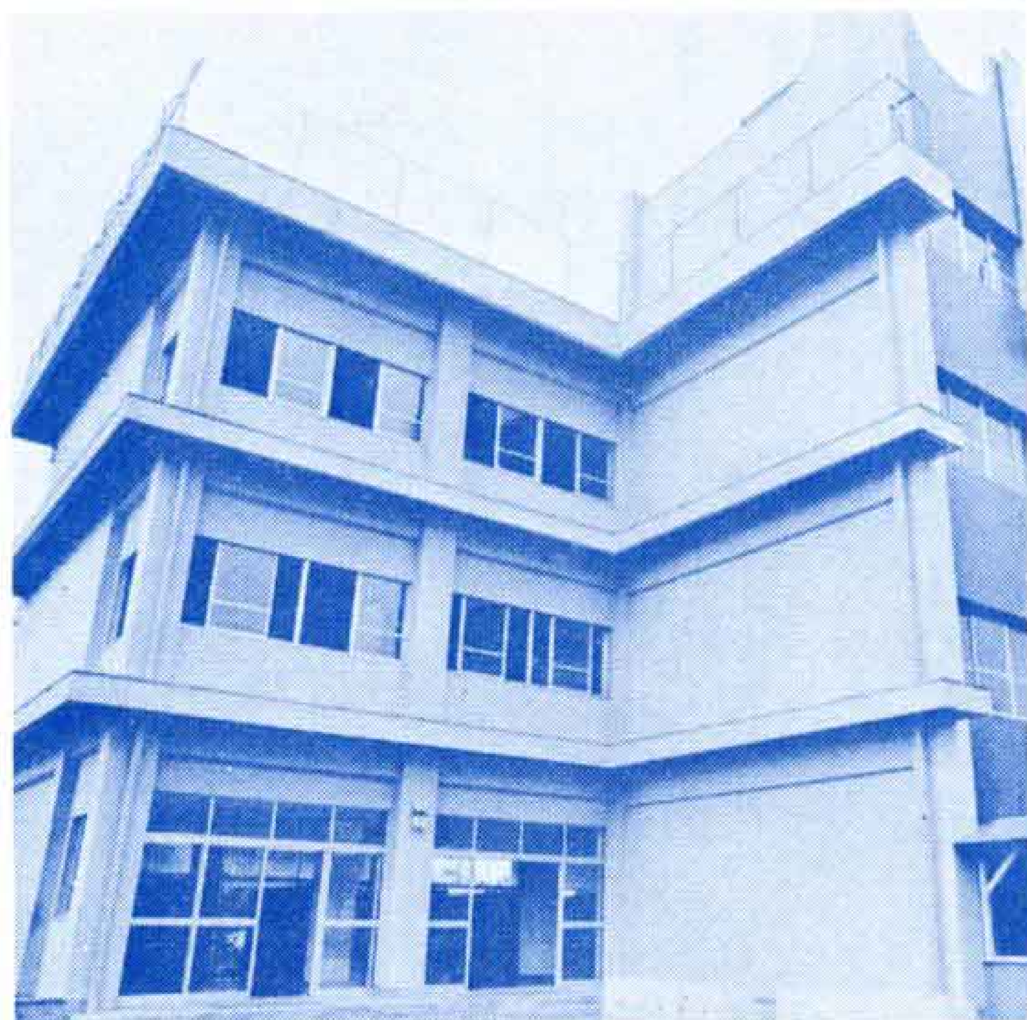
【今年一部完成した大淵小学校】