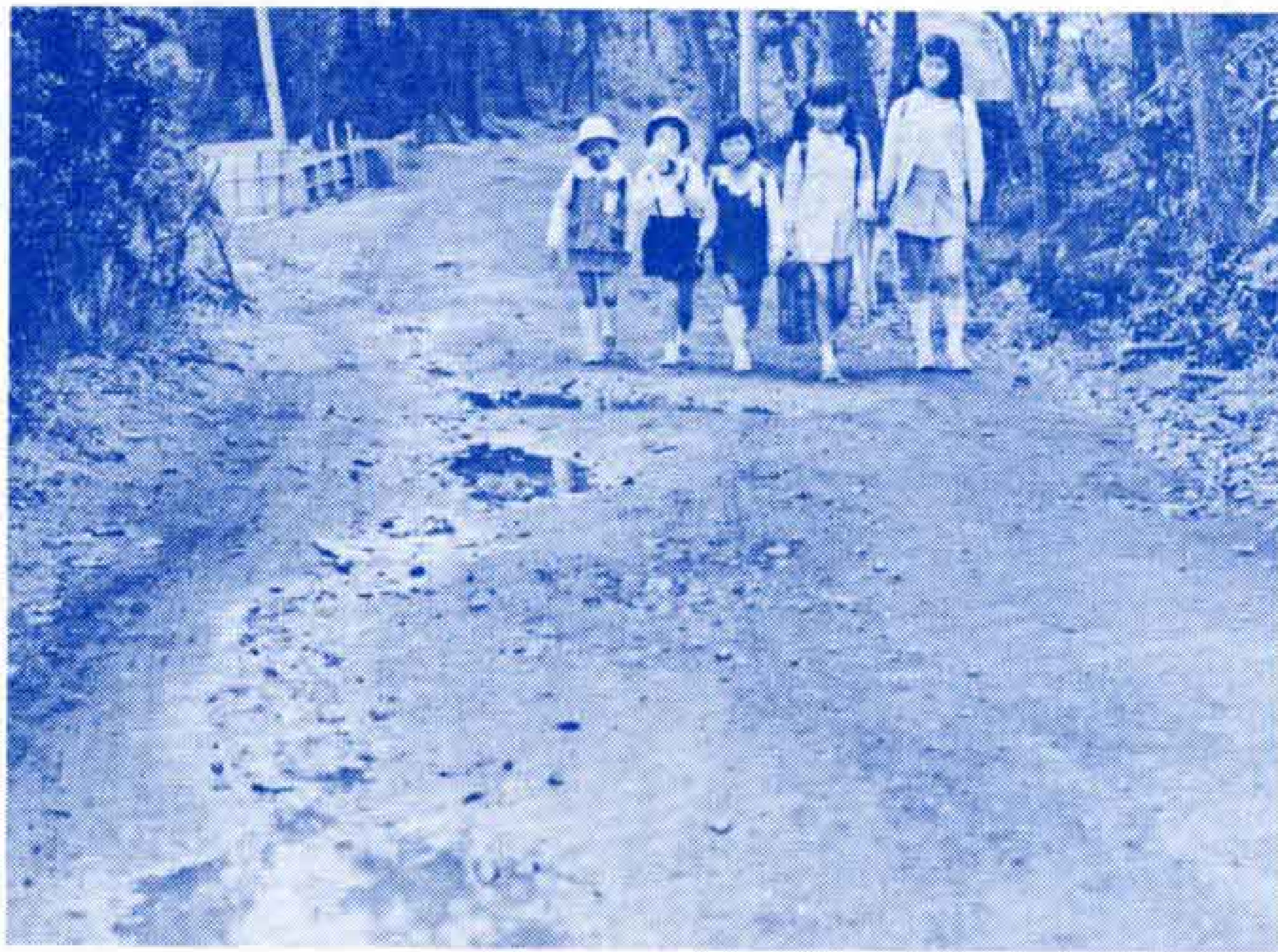
【通学路の総点検で悪路を追放して】

新入学児童も登校しているのです。子どもを交通事故から守り、安全に登下校できるように1日も早く通学路を整備してほしいと思います。ほかの学区にもこうした悪路がまだ多いと思います。ぜひ