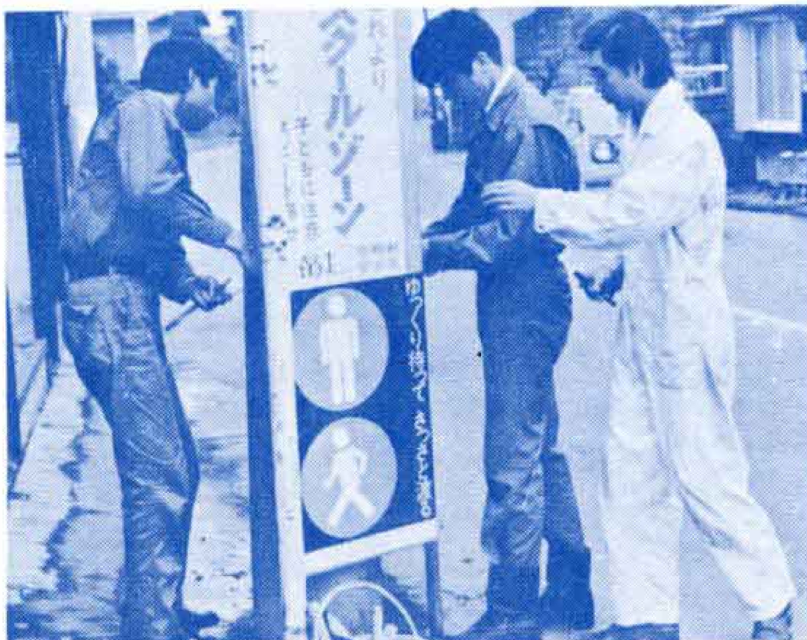
【スクールゾーンを8カ所に設置】

さて、子どもの事故防止に効果を上げたスクール・ゾーンは、現在広見小学校をはじめ富士中第1小学校など8校に設定してあります。今後、市内の全小学校を対象にスクールゾーンを設け、子どもを事故から守る施策をすすめていきます。