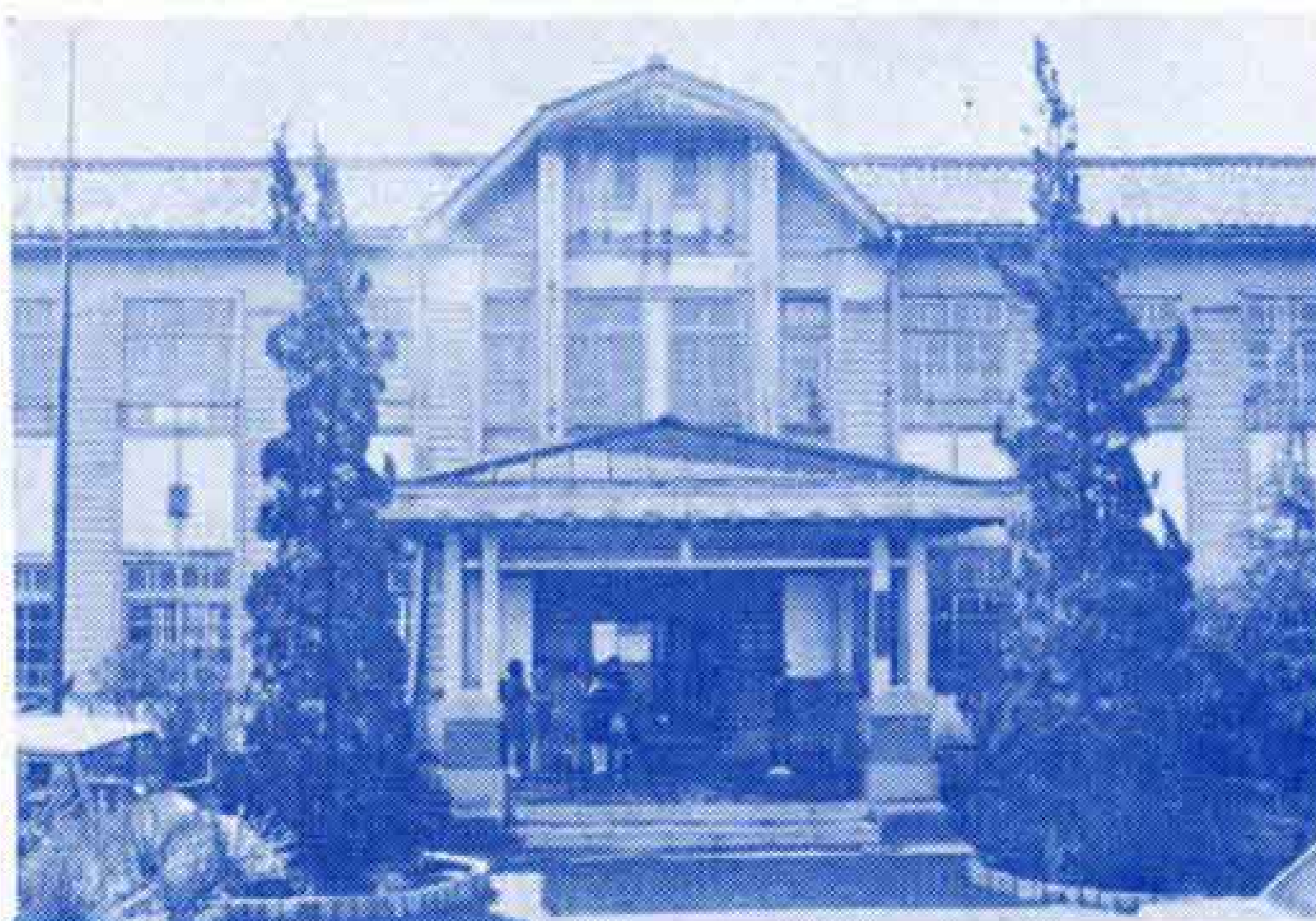
【元吉原小の改築などを行ないます】