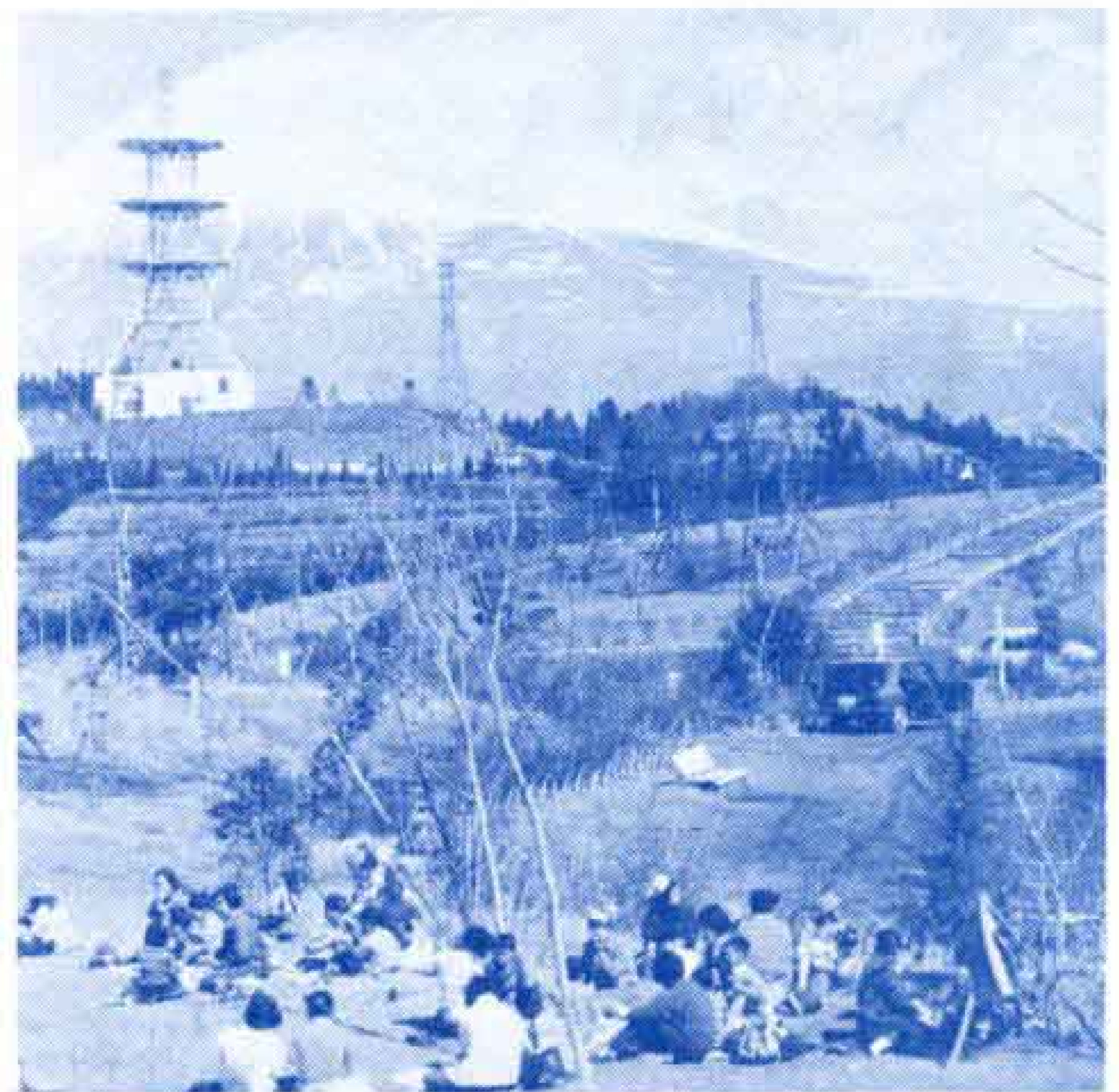
【公園整備など緑化運動をすすめます】