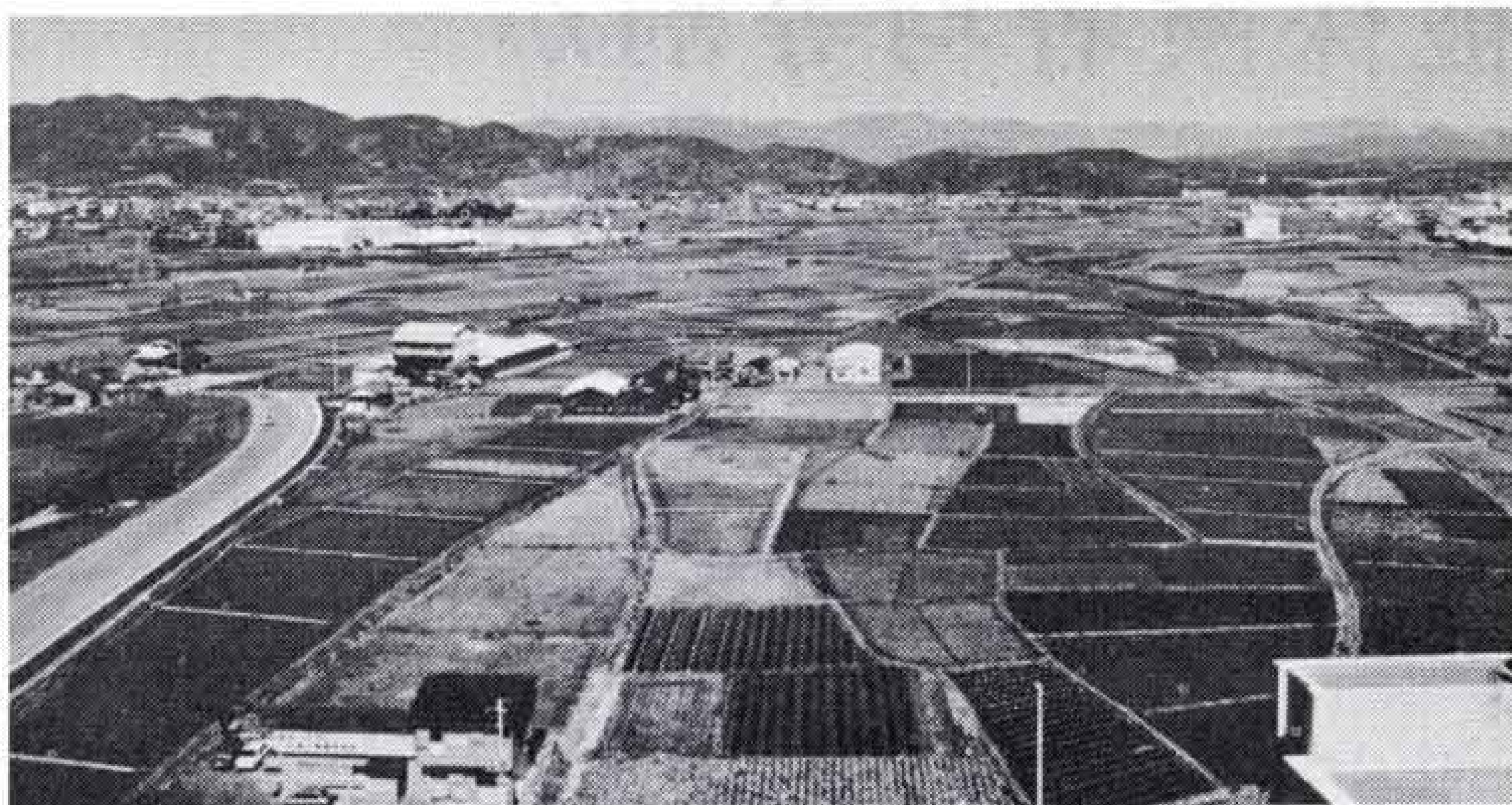
【市庁舎西側の区画整理区域】

道路・公園・排水施設など公共施設を整備するとともに、一つ一つの土地を整形して土地利用の増進をはかり、美しく健康的で安全な住みよいまちづくりを進めるために、今年度から依田原新田区画整理事業を進めます。