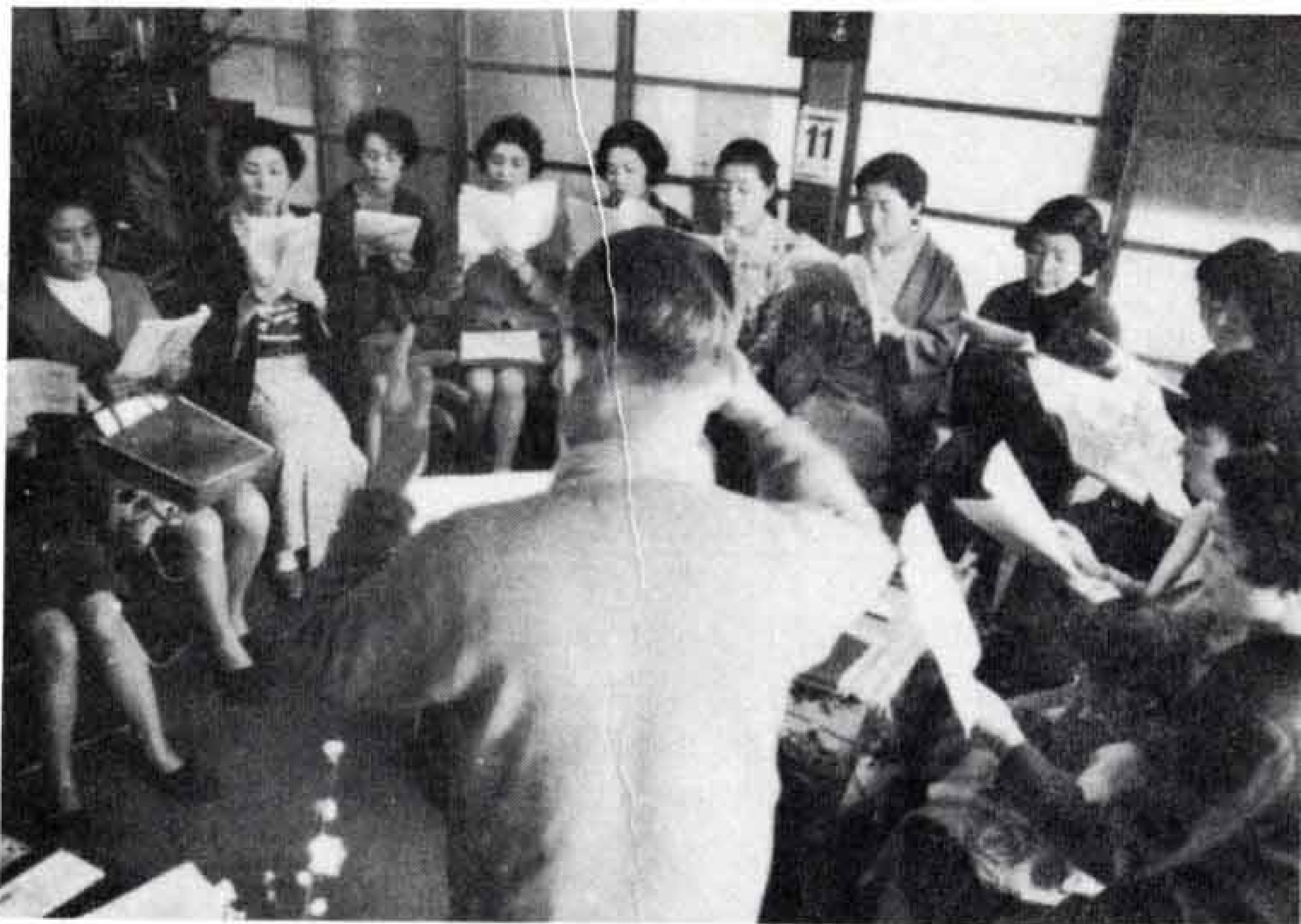
ママさんコーラス