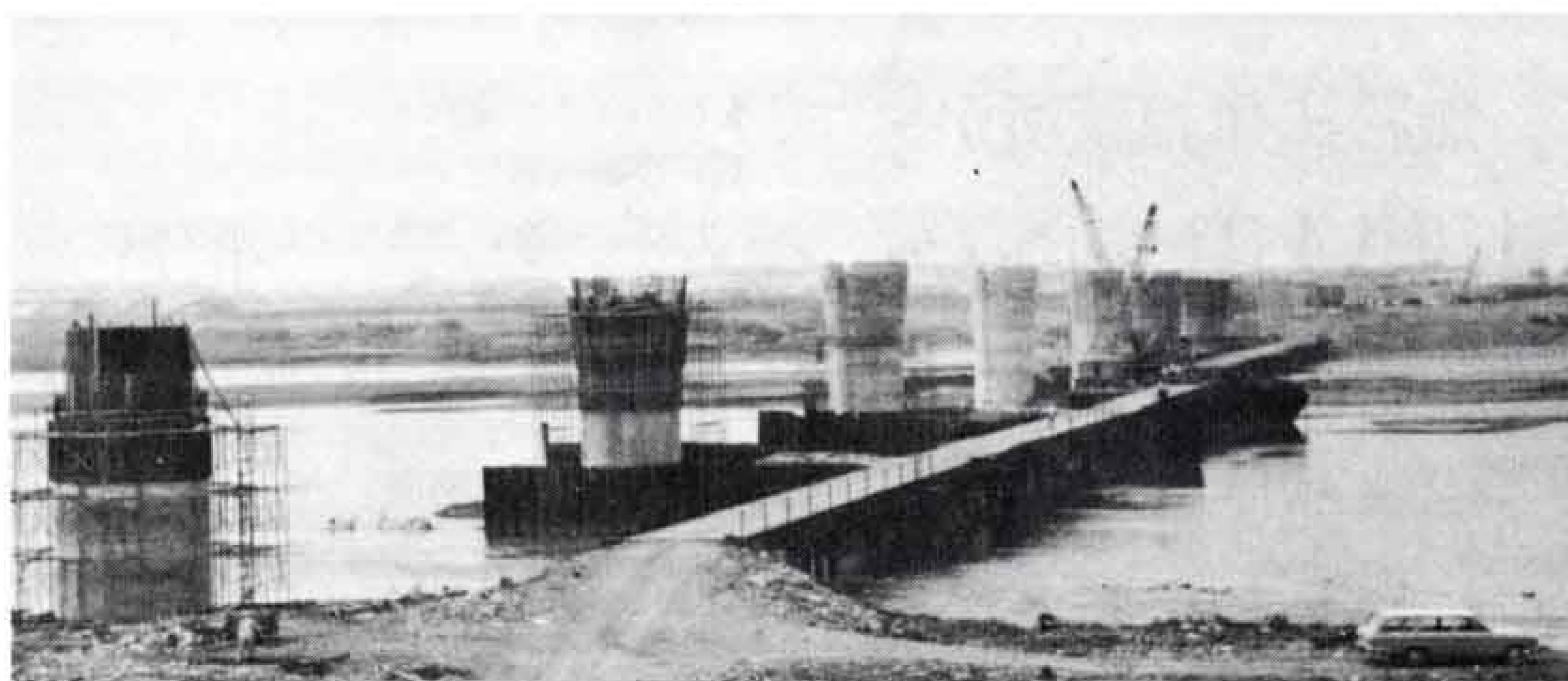
富士由比バイパスの富士川橋工事現場