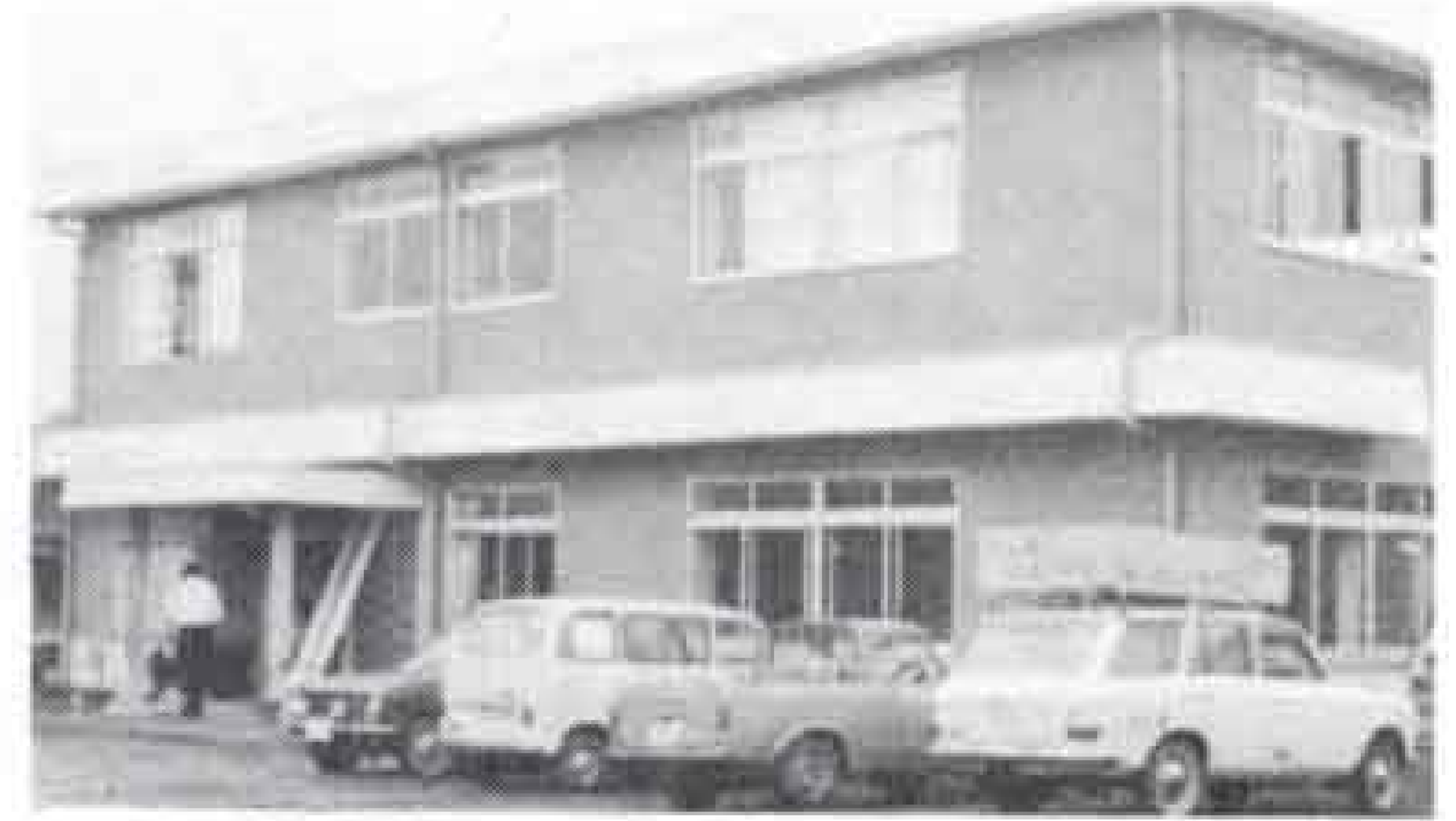
(写真上は新装なった田子浦公民館 下は展示物に見いる斉藤市長)

なお、同公民館の建築面積は332平方メートルで、1階には事務室、料理室、図書室が、2階は和室、大小会議室があります同施設を社会教育活動に使用する場合は無料。