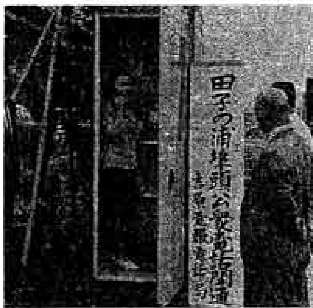
〈吉原ふ頭に備えられた公衆電話〉