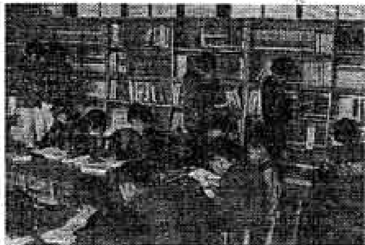
写真は休み時間に善意の本を読むこどもたち

赤い羽根共同募金は昨年10月から行なわれましたが、市内では約594万円のみなさんの善意が寄せられました。内訳は吉原地区が402万円、富士地区148万円、鷹岡地区44万円となっており、目標額に対し171%（吉原204%、富士127%、鷹岡132%）の実績をあげました。また、歳末助け合い運動には現金約182万円と、もち、砂糖などの篤志がありました。集められた金品は、市内の老人ホーム、誠心少年少女の家や英客会などの児童収容施設、保護世帯に配分されました。