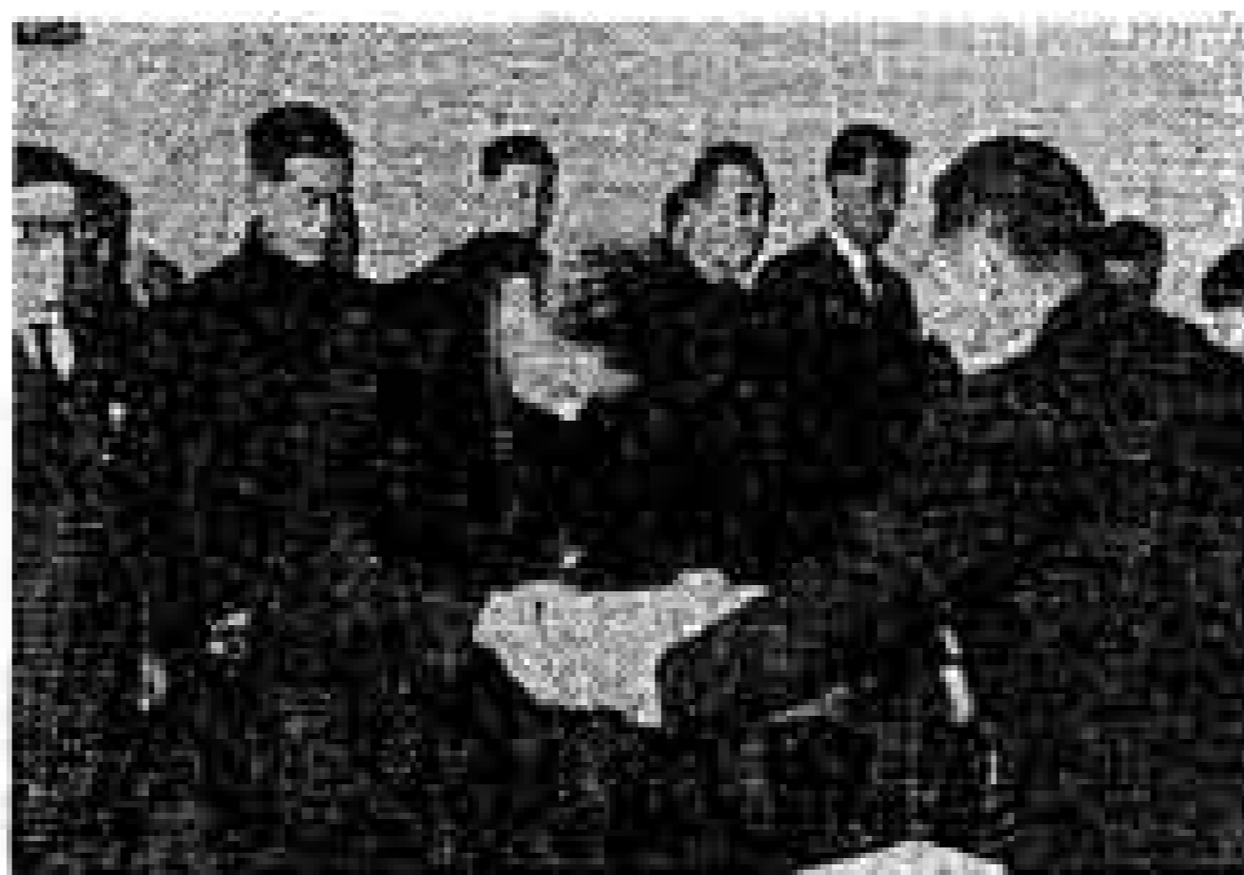
写真は市長から表彰をうける優等に選ばれた方々