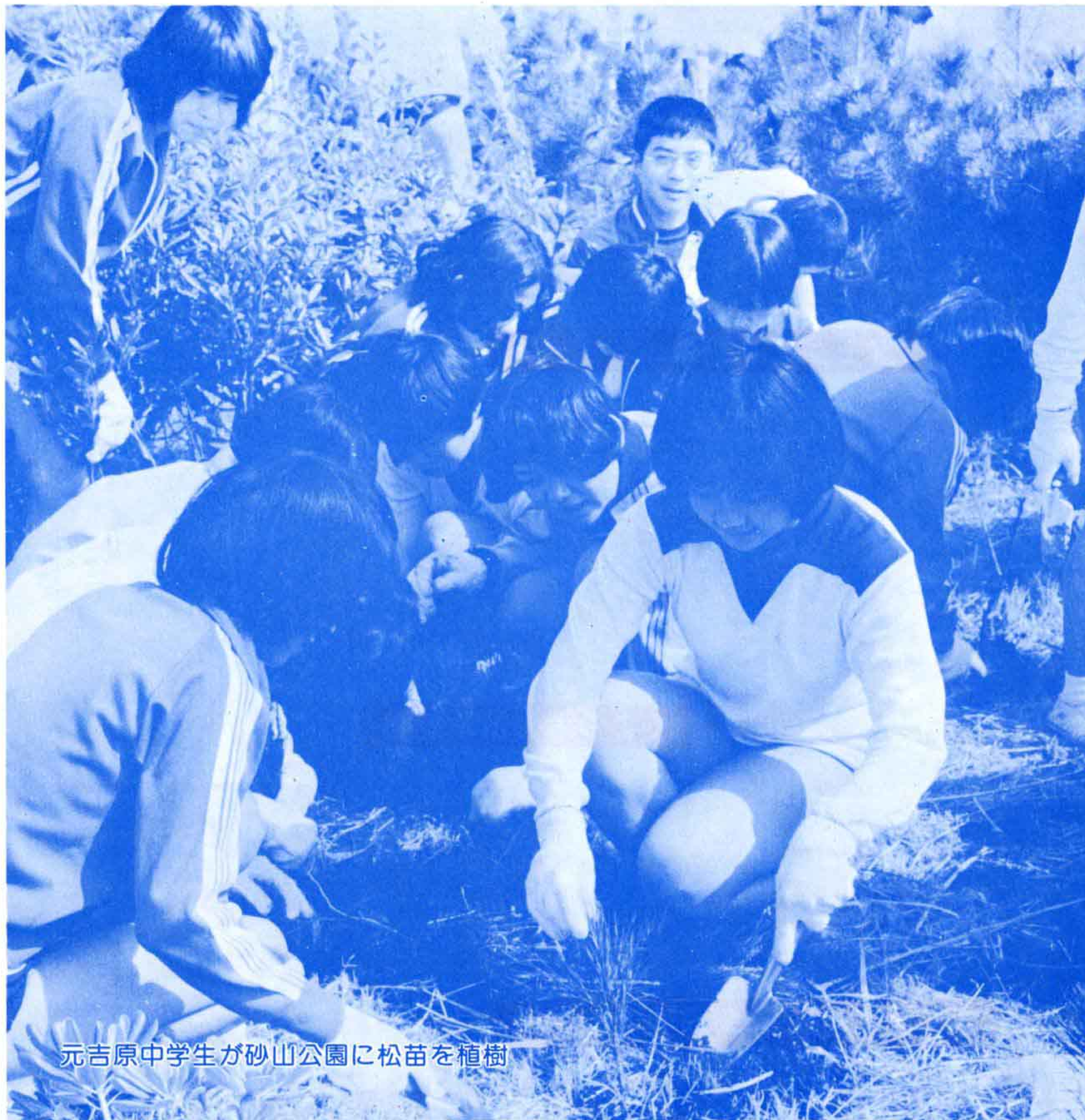
元吉原中学生が砂山公園に松苗を植樹