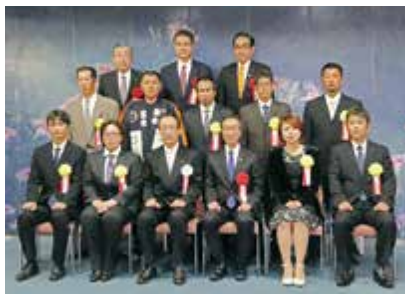
優秀技能者表彰を受賞した皆さん