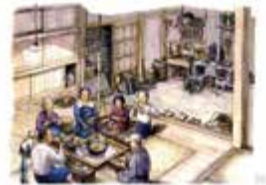
「道具が語る あの日の住まい」から 昭和初期の様子