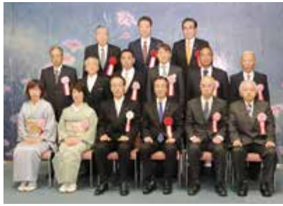
技能功労者表彰を受賞した皆さん