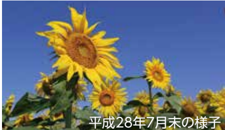
平成28年7月末の様子