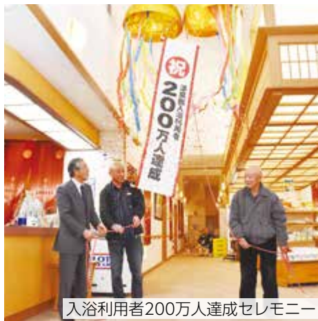
入浴利用者200万人達成セレモニー