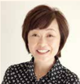
ますだ あけみ 増田 明美 スポーツジャーナリスト 大阪芸術大学教授