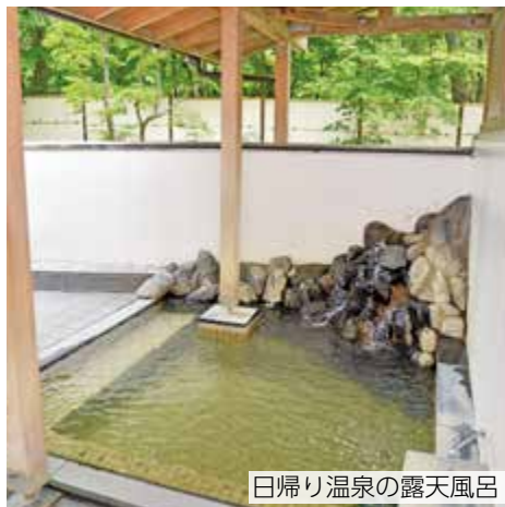
日帰り温泉の露天風呂