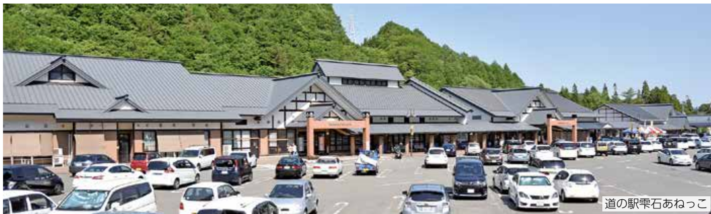
道の駅雫石あねっこ