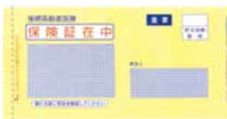
↑保険証が封入される封筒です

8月1日以降に お使いいただく保 険証は「黄色の封 筒」で7月中旬以 降に郵送します。