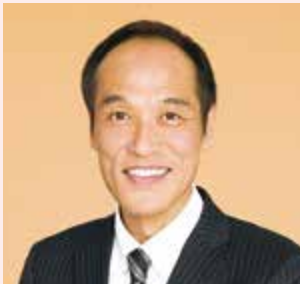
ひがしこくぼ ひでお 東国原 英夫 元宮崎県知事 前衆議院議員