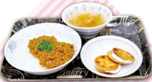
野菜たっぷりドライカレー 栄養満点野菜スープ 簡単マシュマロサンド