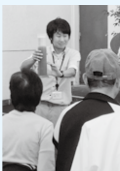
◀東部浄化センター