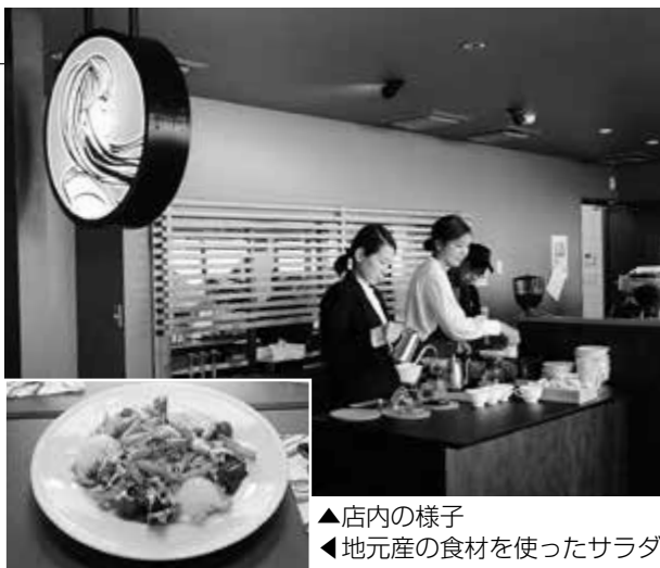
▲店内の様子 ◀地元産の食材を使ったサラダ

今後はお菓子教室など多目的なイベントも開催していく予定です。営業時間は9時から17時まで、定休日は木曜日です。