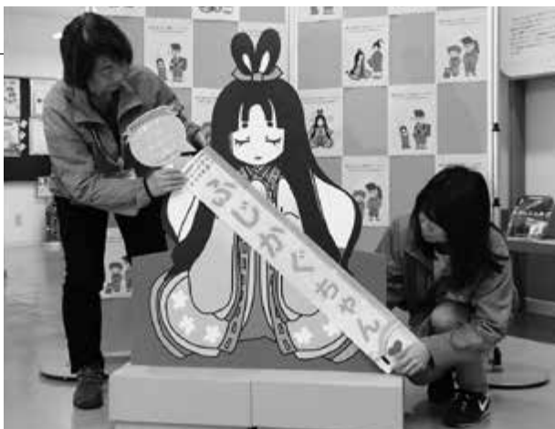
▲キャラクターのパネルにたすきをかけて愛称を披露