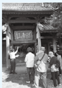
瑞林寺(国の重要文化財)▶