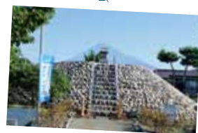
「富士山登山 ルート 3776」の起点 富士塚