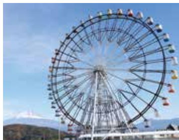
▲観覧車の西側から撮影

昨年2月には、隣接する富士川サイビスエリアに大観覧車「Fuji Sky View」が完成しました。ゴンドラ内からは富士山から駿河湾まで、富士市を一望できます。