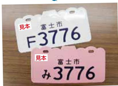
バイクの後ろの 富士山ナンバープレート