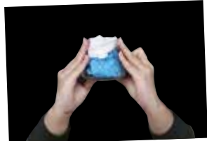
飲み会の始まりは… 富士山カンパイ！