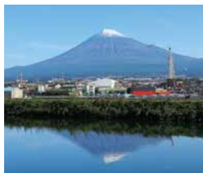
潤井川の水面にうつる 逆さ富士