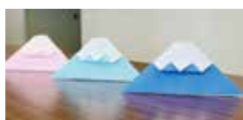
親子で楽しく！ 富士山おりがみ