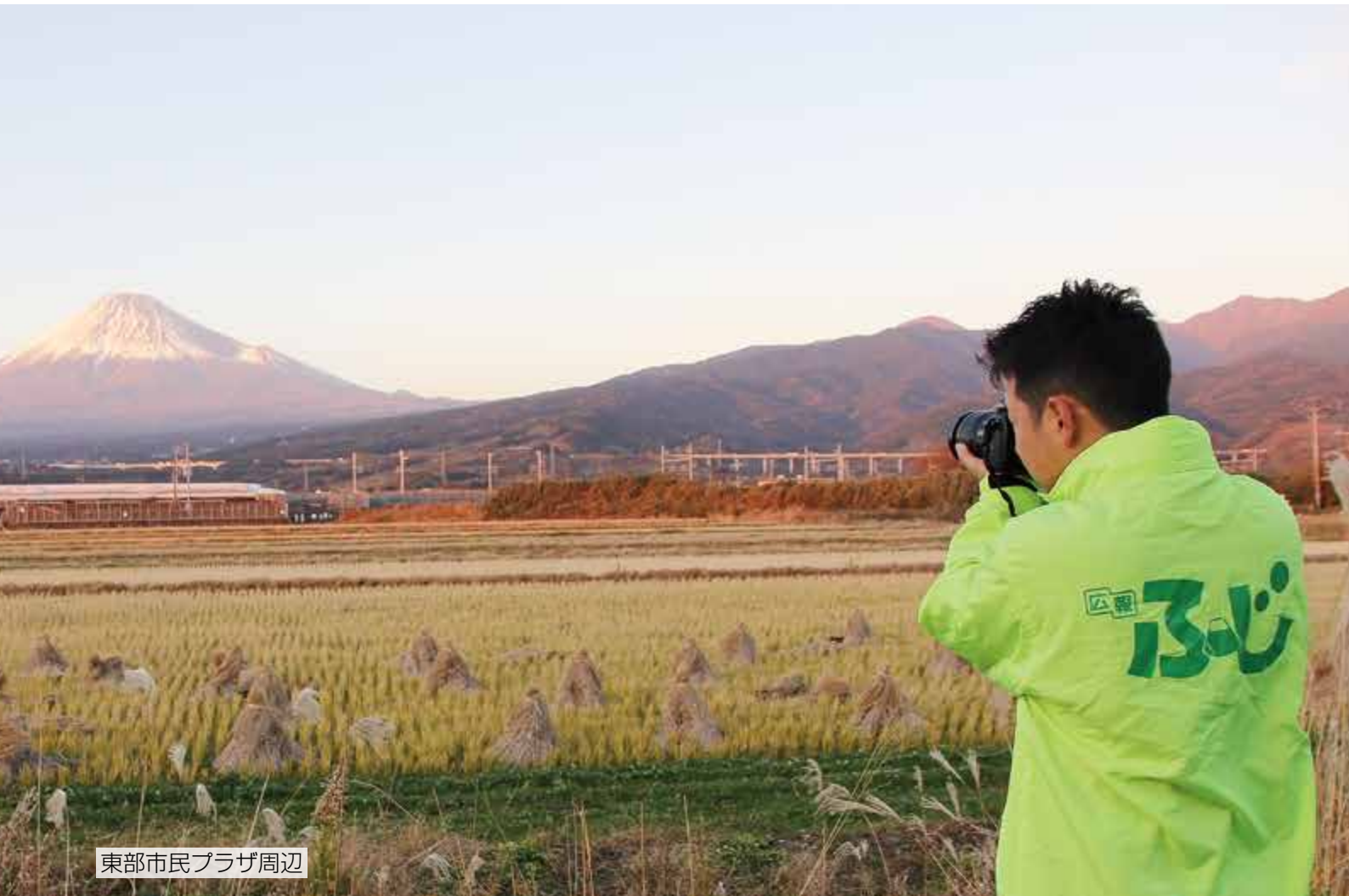
東部市民プラザ周辺

近年ではSNS ※1 の流行により、フォトジェニック ※2 な場所やものが注目されています。富士市の絶景といえば富士山！ということで、今回は、富士山にまつわる市内の場所やものを紹介します。