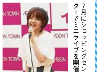
7月にショッピングセンターでミニライブを開催