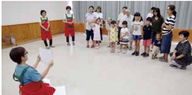
▲動物当てゲームを楽しむ（うたのひろば）

年4回開催している「うたのひろば」では、歌やゲームなどを通して、幅広い世代の人が交流しています。