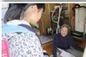
配食サービス（吉永北地区）