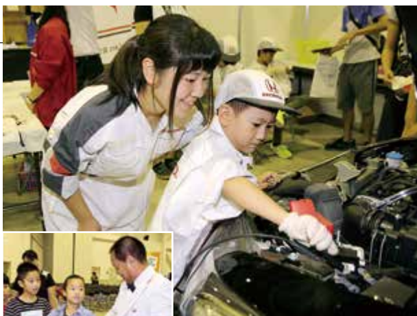
▲整備士の仕事を体験 ◀「匠人」の指導を受ける