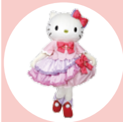
©1976, 2017 SANRIO CO.,LTD. APPROVAL NO.S582119

※開催内容に変更になる場合があります。最新のイベント内容は、下記「紙フェア」特設ウェブサイトでご確認ください。