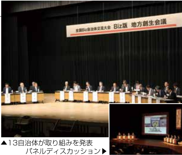
▲13自治体が取り組みを発表 パネルディスカッション▶