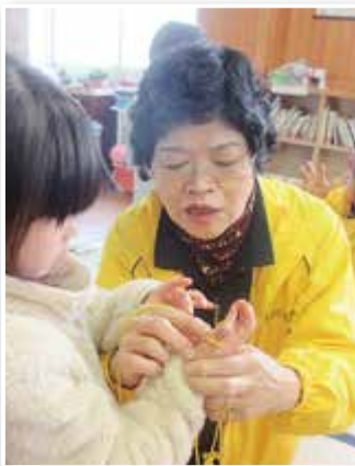
あやとりで交流（吉永北地区）