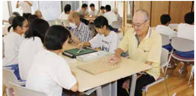
▲ボードゲームで交流する（ぼらんていあスクール）

養護老人ホームするが荘で、小・中学生と高齢者が交流する「ぼらんていあスクール」を開催しています。