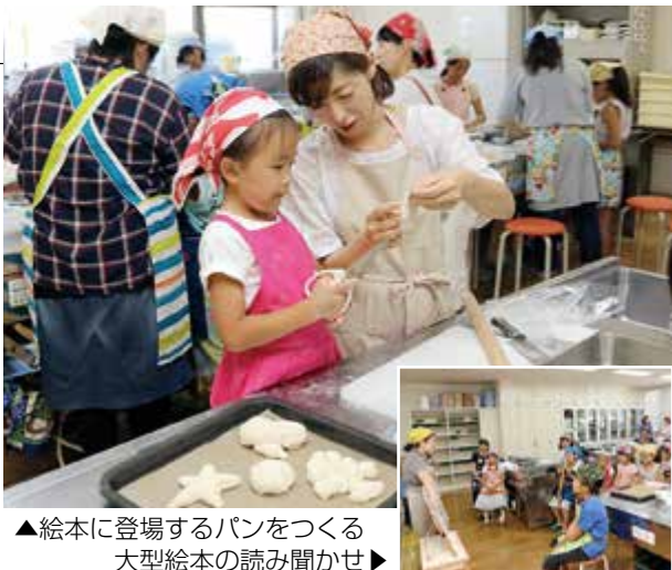
▲絵本に登場するパンをつくる 大型絵本の読み聞かせ▶