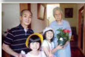
ふれあい活動（神戸地区）