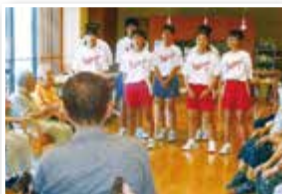
中学生福祉体験（伝法地区）