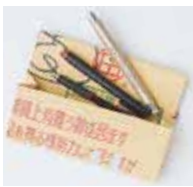
▲段ボール製ペンケース