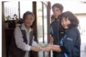
配食サービス（元吉原地区）