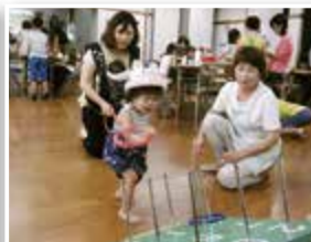
▶グラウンドゴルフで交流（富士北地区）