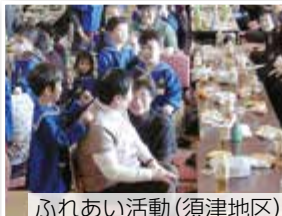
ふれあい活動（須津地区）