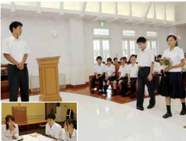
▲チャペルでの模擬結婚式 ◀ライフデザインシートの作成