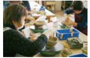
「陶芸室自由開放日」から