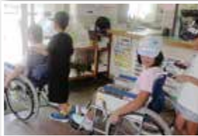
児童福祉体験（富士南地区）