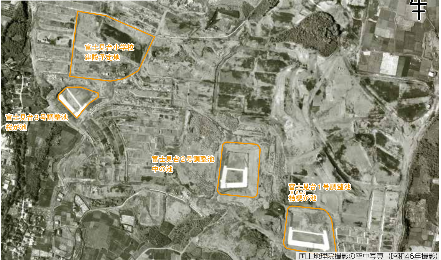
国土地理院撮影の空中写真 (昭和46年撮影)