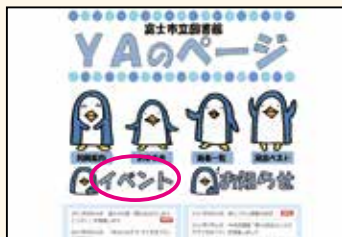
▲ヤングアダルトのページ