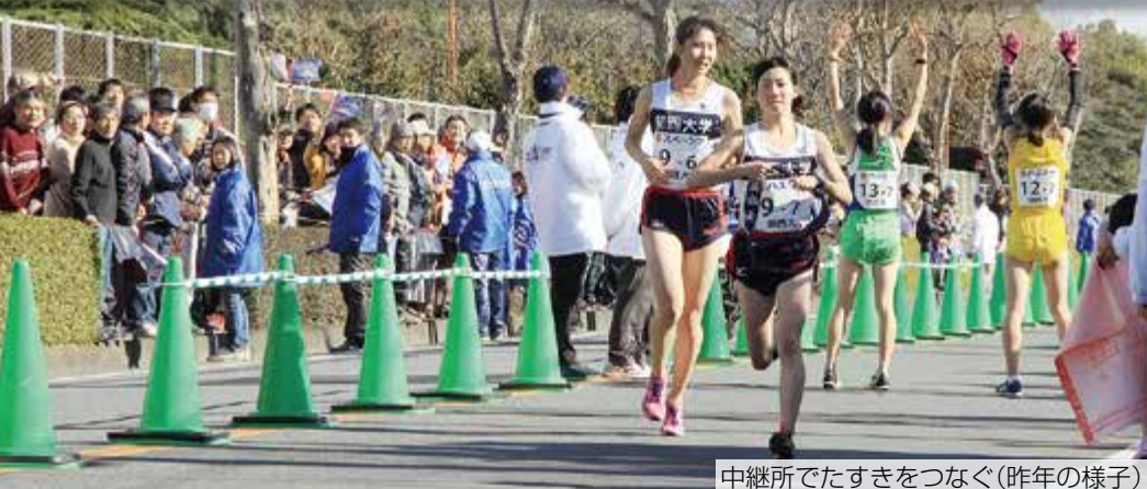
中継所でたすきをつなぐ(昨年の様子)

昨年も熱いレース展開で、さまざまなドラマを生んだ富士山女子駅伝。ことしの大会では、市内のコースの一部が変更され、さらに盛り上がるレースになることが期待されます。また、ことしは静岡県と中国浙江省の友好提携35周年を記念し、静岡県学生選抜と中国浙江省学生選抜の混合チームがオープン参加します。ぜひ、皆さんの温かい応援とご協力をお願いします。