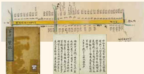
▲ウェブサイト上では、古地図(上)や書籍などを閲覧できる

「デジタルアーカイブ」に、さらに多くの資料を追加します。これにより、図書館資料を検索したときに、貴重な古文書を閲覧することができま