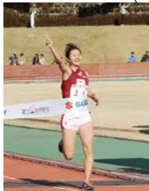
4連覇を果たした立命館大学