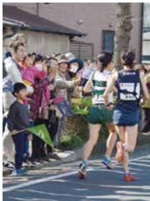
選手に熱い声援を送る