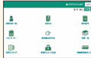
▲シンプルになり、使いやすくなる「利用者のページ」

ウェブサイト上や、図書館内にある蔵書検索用のパソコンの利用者のページ(自分専用のページ)を使って、読書記録の作成などでもできるようになり、より便利になります。