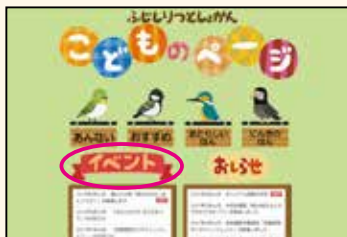
▲小学生以下の子ども向けのページ

※各ページには、お勧めの図書館資料のほか、各年代向けのイベント情報やお知らせも掲載します。