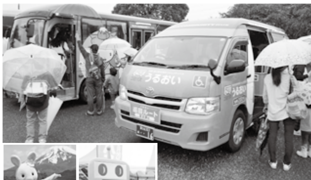
▲バス車両の展示 (昨年の様子)