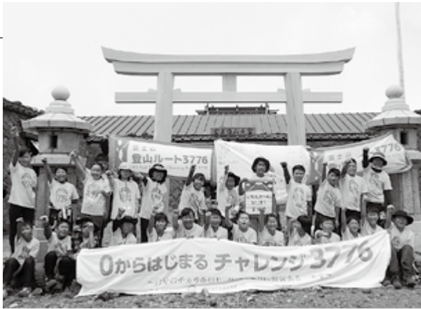
▲ことし7月に建てかえられた富士山頂の鳥居の前で、登頂した喜びを表現する小学生（イベント主催：富士商工会議所青年部）