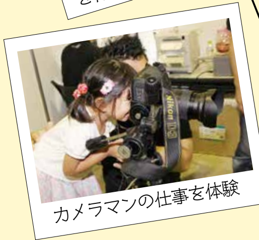
カメラマンの仕事を体験