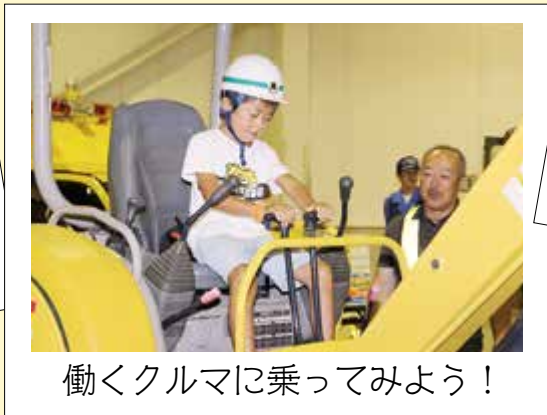
働くクルマに乗ってみよう！