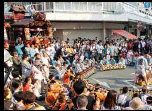
1 誇り高く練り歩く男たち 2 子どもによる元気いっぱいなお囃子 3,10 山車の曳き回しで、にぎやかにお囃子を奏でる 4 宮太鼓の競演に見入る観客 5 激しく神輿を揺さぶる「けんか神輿」 6 「女神輿」では、祭りの継承を願う意気込みを担ぎで表現 7 全身の力を込めて太鼓を打ち鳴らす 8 子どもたちの笑顔が祭りに活気を添える 9 山車を思いきり引っ張る