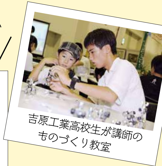
吉原工業高校生が講師の ものづくり教室