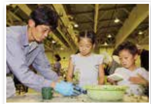
造園業のブースで、苗を植えました！