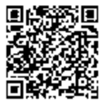
▲二次元バーコードも利用可

とき／開講日は上記をごらんください。19時～20時30分(第1回は18時45分) 計6回 ところ／ロゼシアター中ホール 対象／富士市・富士宮市に在住・在学・在勤の中学生以上の人(中学生は保護者同伴) 定員／700人(応募者多数の場合抽せん) ※2人1組でも申し込み可。 ※定員に満たないときは、各回の入場券を販売する場合あり。 受講料／3500円(全6回) ※受講決定後に納入。 申し込み／7月24日～8月3日に、市ウェブサイトで電子申請するか、参加申込書(左記受付場所)に必要事項を記入し、直接受付場所へ 「市ウェブサイト」くらしと市政↓教育・文化・スポーツ↓社会教育↓富士市民大学↓平成29年度第37回富士市民大学後期講演会 受付場所／①社会教育課、各区まちづくりセンター 9時～21時(土・日曜日は除く) ②富士市役所7階教育総務課、富士宮市役所6階社会教育課 9時～17時(土・日曜日は除く) 問い合わせ／社会教育課 (富士市教育プラザ内) ☎(55)05660