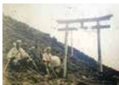
大正9年(1920年)岩淵鳥居講の様子