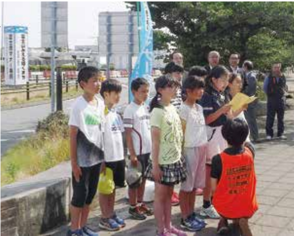
▲富士南小学校児童による活動紹介