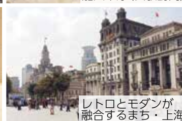
レトロとモダンが融合するまち・上海

詳しくは、チラシ(国際交流室、各地区まちづくりセンターで配布)または市ウェブサイトをごらんください。