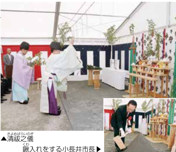
▲清祓之儀 鍬入れをする小長井市長▶