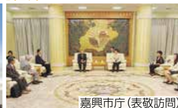
嘉興市庁(表敬訪問)