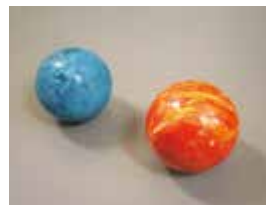
博物館の日から 「泥だんごづくり」