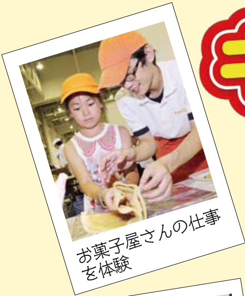
お菓子屋さんの仕事を体験