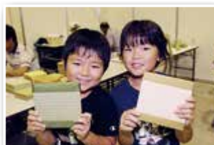
畳の張りかえ体験をしました。