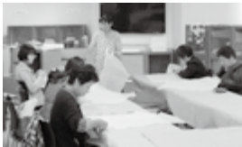
▲作品を制作する参加者