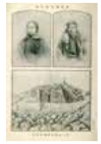
富士登山列伝から