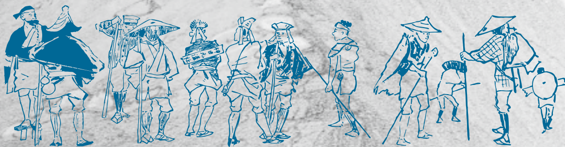
『The capital of the Tycoon』内『ASCENT OF FUSIYAMA』