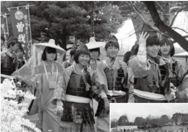
▲武者に扮して歩く中学生 多くの人々が参加した「みんなで踊ろう『富士ばやし』」