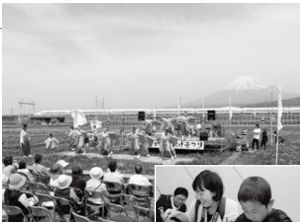
▲特設ステージで演舞を披露 レンゲのしおりづくり体験▶

訪れた人たちは、レンゲ摘みをしたり、レンゲの押し花でしおりづくり体験をしたりして楽しんでいました。