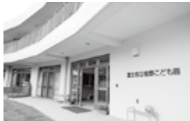
▲昨年度開園した松野こども園