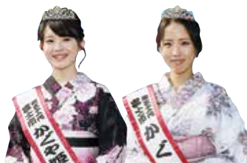
第31代かぐや姫クイーン[左]とかぐや姫