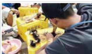
ウニの解体やホタテの掃除を行いました