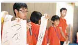
未来を切り拓くための宣言をしました