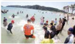
砂の造形大会と海水浴を楽しみました