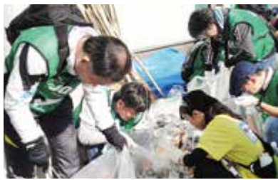
拾ったごみの分別を行うボランティアチームの皆さん

と感謝してもらえるところが何よりうれしいです。無事に富士山頂まで清掃ができるように頑張ります」と思いを語ってくれました。今後の予定は、6月に6合目まで、8月ごろ富士山頂到達を目指すということです。活動について詳しくは、市ウェブサイトをごらんください。【市ウェブサイト】富士じかん↓楽しむ↓富士山登山ルート3776