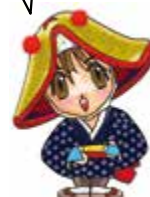
栗石町観光キャラクター「しずくちゃん」

このコーナーでは、平成25年11月1日に友好都市提携を結んだ岩手県栗石町から、旬な情報を定期的にお届けします。