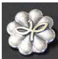
民生委員・児童委員の徽章