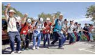
頂上では大島の自然を一望できました