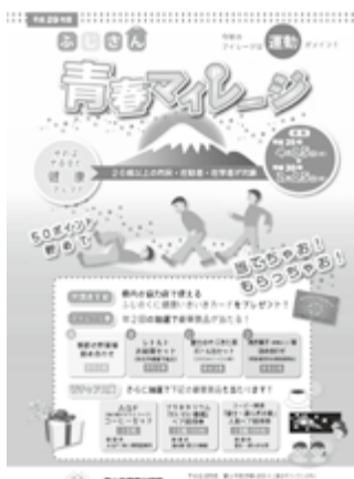
「ふじさん青春マイレージ」用紙

申請方法／用紙をフィランセ健康対策課、各地区まちづくりセンター、保健医療課(市役所4階)に提出するか、ウェブシステムから申請してください