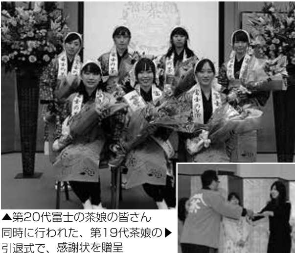
▲第20代富士の茶娘の皆さん 同時に行われた、第19代茶娘の引退式で、感謝状を贈呈