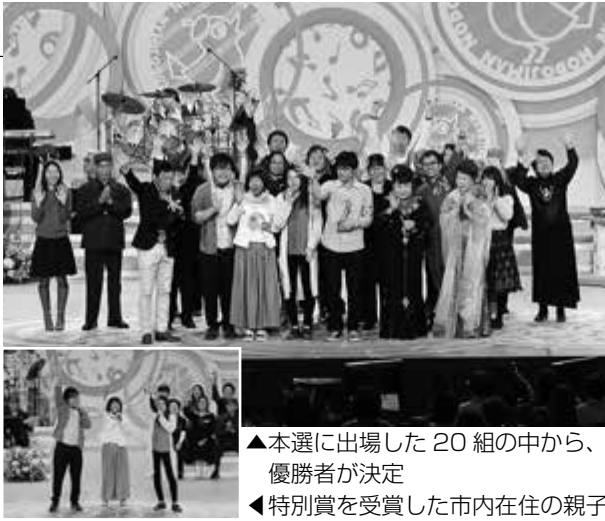
▲本選に出場した20組の中から、優勝者が決定 ◀特別賞を受賞した市内在住の親子