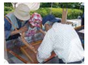
博物館まつりから 「紙漉き体験」