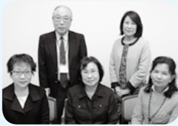
結婚相談員の皆さん