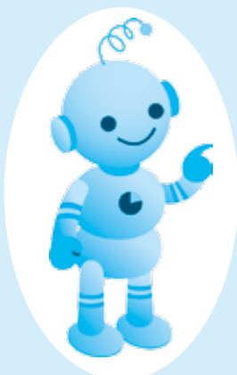
工業統計キャラクター コウちゃん

※調査票にご記入いただいた内容は、統計作成の目的以外(税の資料など)に使用することは絶対ありません。