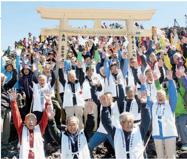
▲鳥居の建立が完了し全員で万歳三唱

岩淵では、12年に一度の申年中に富士山頂へ鳥居を奉納する「岩淵鳥居講」が江戸時代から続けられています。今回は、富士山の世界遺産登録後、初の開催として注目され、岩淵のほか市内外から約180人の参加者が集まりました。当日は、岩淵の八坂神社を出発。富士宮市の浅間大社で登山修祓式を行い、富士宮口新五合目から富士山頂を目指しました。足場の悪い山頂での作業に、参加者たちは四苦八苦するも、鳥居が建つと喜びの声を上げていました。