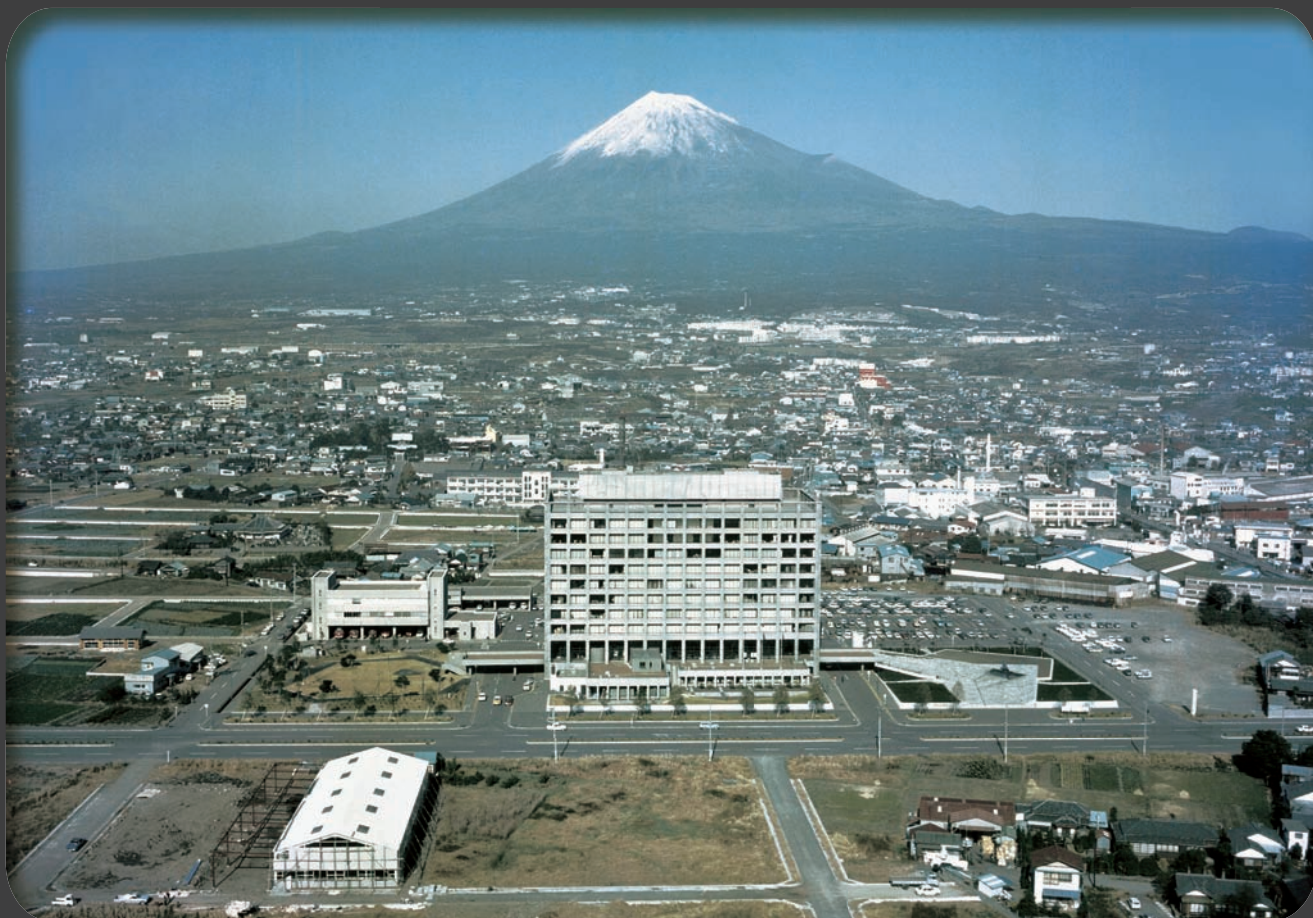
昭和45年 航空写真（市役所上空）