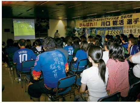
ワールドカップ2006観戦会 (平成18年6月)