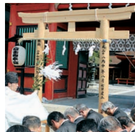
▲浅間大社で登山修祓式

解体した鳥居は、ことし11月、富士山かぐや姫ミュージアムの屋外に再建し、展示される予定です。