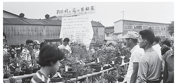
「第1回緑と花の百科展」開催（昭和47年6月）