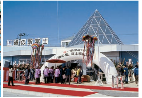
県内初の道の駅「富士」が誕生（平成5年10月）