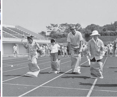
紙の国100祭・紙リンピック（平成4年7月）