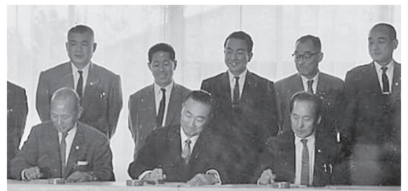
富士文化センター（現富士市交流プラザ）で行われた合併協定書の調印式（昭和41年10月）