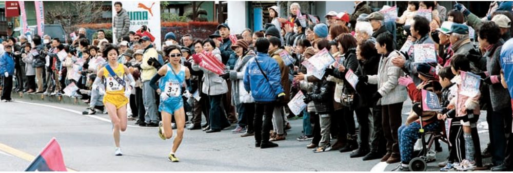
年末恒例の大イベントとなった富士山女子駅伝 (平成25年12月初開催)