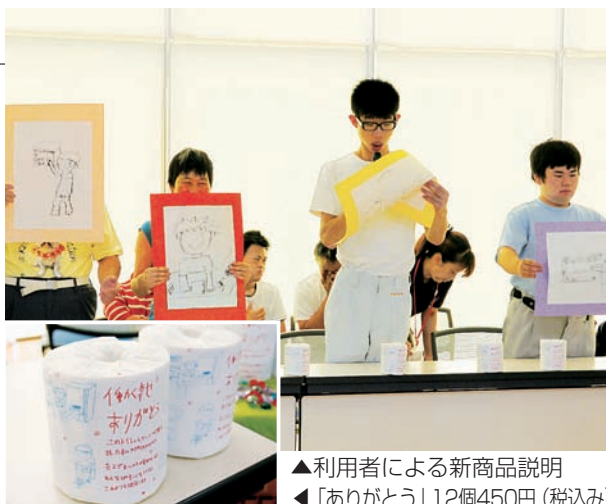
▲利用者による新商品説明 ▲「ありがとう」12個450円(税込み)