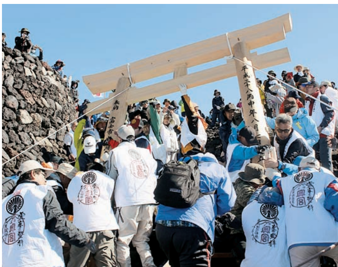
▲力を合わせてロープを引っ張り鳥居を立ち上げる