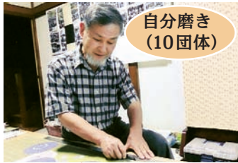
自分磨き (10 団体)