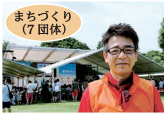
まちづくり (7 団体)