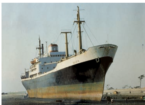
打ち上げられたグラティック号（昭和54年10月）