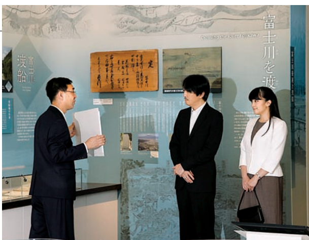
▲常設展示の「富士川を渡る」を御観覧