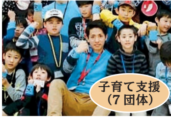
子育て支援 (7 団体)