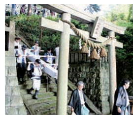
▲岩淵の八坂神社を出発