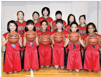
創立50周年を迎える 富士市バスケットボール協会 [写真] 吉原ミニバスケットボール教室

私たちは、一人でも多くの人にバスケットボールを楽しんでもらいたいと、協会運営をしてきました。創立50周年を迎え、記念誌や式典の準備を進めるとともに、来年3月には、3on3の記念大会やバスケットボールクリニックを企画しています。多くの人に参加していただき、親睦を深め、これまで協会を支えてきてくださった諸先輩方に感謝の意を表したいと思っています。