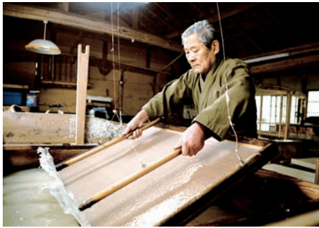
手漉き和紙の様子