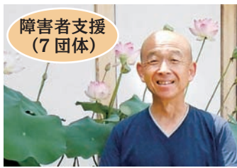
障害者支援 (7 団体)