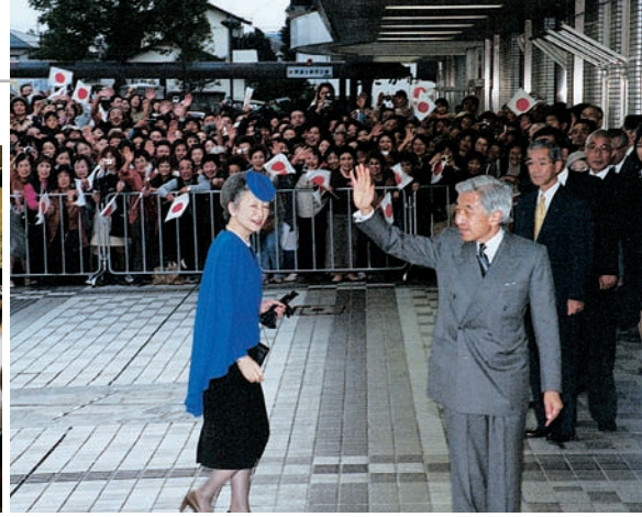
44年ぶりにご来富された天皇・皇后両陛下 (平成13年10月)