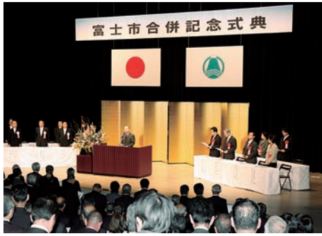
富士市合併記念式典 (平成20年11月)