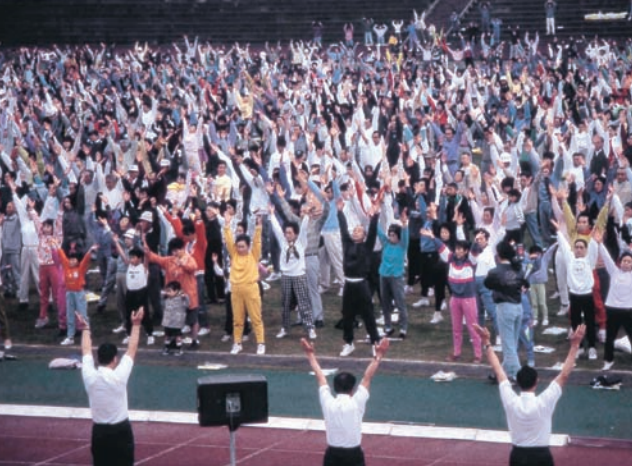
NHK巡回ラジオ体操公開放送（平成5年5月）