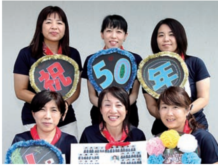
50歳を迎える富士東高校5期生

「富士まつり」が富士本町通りで開催されていたとき、職場のみんなで市民総おどりに参加しました。当時は「富士サンパ」がなく、「富士ばやし」の踊りをひたすら練習しました。職場から渡された生地を使って、踊りの衣装の浴衣をつくったこともありましたね。 現在、医療の現場で働いていますが、高齢社会が進む中、安心して医療を受けられるまちになることを期待しています。