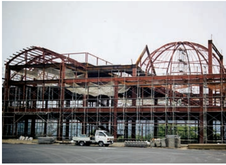
建設中の富士川楽座（平成12年3月オープン）