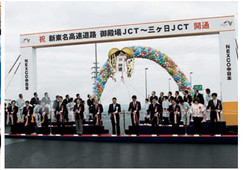
新東名高速道路開通式典 (平成24年4月)