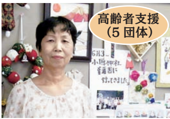
高齢者支援 (5 団体)