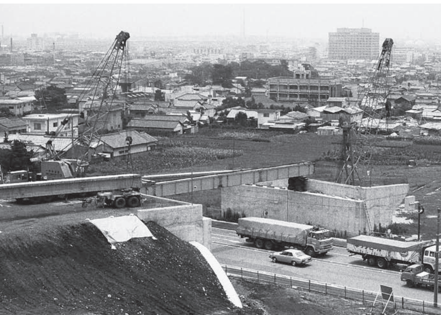
深夜に行われた西富士道路の架橋工事（昭和55年7月）