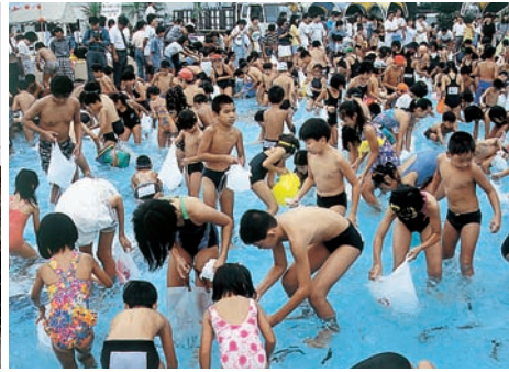
市民プールさよならイベント（平成7年9月）