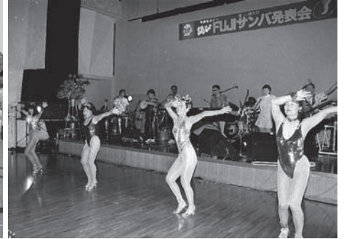
F U J I サンパ発表会（平成3年5月）