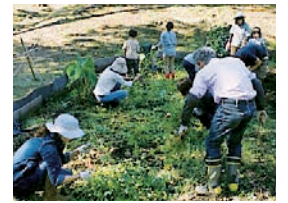
農家の食と年中行事から「そばの収穫」