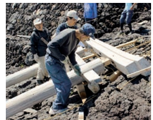
▲12年前に建てた鳥居を、奉納の1週間前に解体撤去