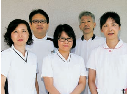
50歳を迎える中央病院職員