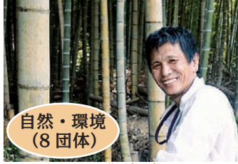
自然・環境 (8 団体)