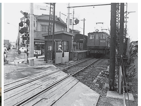
西回りに変更となった身延線（昭和44年9月）