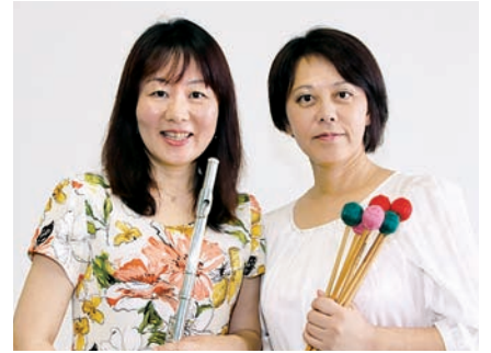
多くの人に音楽の楽しさを伝える50歳

富士東高校5期生36 ホームルーム HRは、とても仲のよいクラスでした。昼休みにみんなバスケットボールをしたり、運動会ではクラスハチマキを手づくりしたり、船で海水浴に行ったりもして、とにかく楽しかったことを覚えています。 当時、携帯電話はなく、娯楽施設なども少なかったため、ボウリング場や決まった店で待ち合わせ、クラスのみんで遊んでいました。これからも、この仲間を大切にしていきたいです。