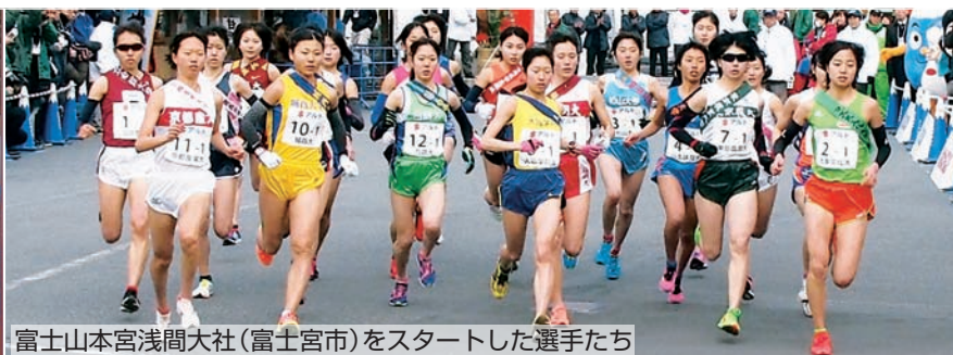
富士山本宮浅間大社(富士宮市)をスタートした選手たち

①全日本大学女子駅伝対校選手権大会(10月30日(日)に仙台市で開催)上位12チーム、②地区学連選抜チーム2チーム、③5000メートルの持ちタイムが上位の大学6チーム、④静岡県学生選抜チーム1チーム(オープン参加) ※開会式は、12月29日(木)の15時からロゼシアターで行います。