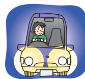
9～2月は16時にライトオン!