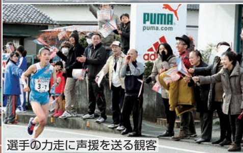
選手の力走に声援を送る観客