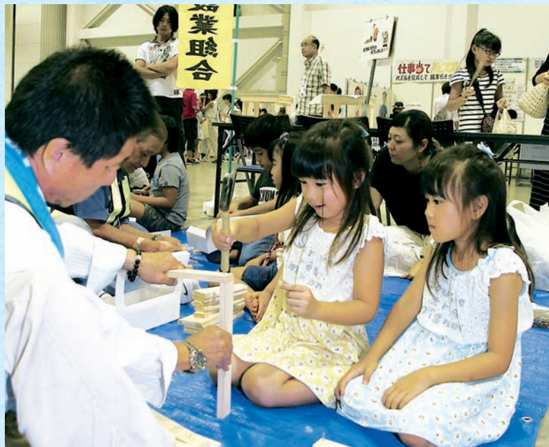
8月20日 キッズジョブ 2016 (ふじさんめっせ)