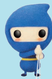
厚生労働省 2つの給付金キャラクター「カクニンジャ」