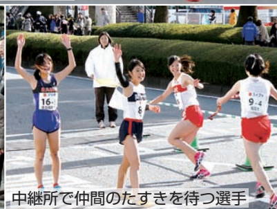
中継所で仲間のたすきを待つ選手