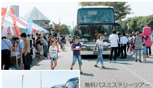
無料バスミステリーツアー