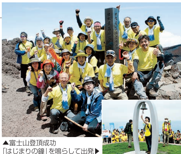
▲富士山登頂成功 「はじまりの鐘」を鳴らして出発▶

「富士山登山ルート3776」メインイベント 7月8〜11日 ぶじのくに田子の浦みなと公園ほか