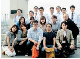
▲プロジェクトメンバー

富士市全体でブランドプロジェクトを推進するため、市長をはじめ市内の各業界の代表者などにより富士市シティプロモーション懇話会を組織しています。毎回のワーキングは、子育て中の母親や若手起業家など、年齢や職業が異なる、さまざまなライフスタイルを持ったプロジェクトメンバーにより進められています。