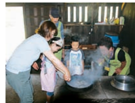
体験講座から 「かまどめしを食べよう!!」