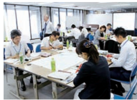
▲市の魅力を出し合う