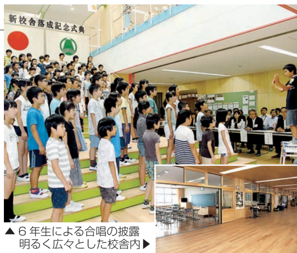
▲6年生による合唱の披露 明るく広々とした校舎内▶