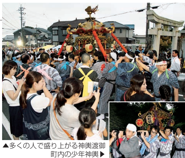
▲多くの人で盛り上がる神輿渡御 町内の少年神輿▶