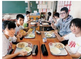
▲自校式「給食」を味わう