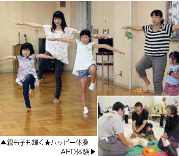
▲親も子も輝く★ハッピー体操 AED体験▶

2014健康まつり 9月21日 フォーリンセ ことは「運動」を重点にして開催された「健康まつり」。会場では、専門の指導者から運動の基礎を学ぶ体験や、自分の体の状態を知るための健康チェックなどが行われ、参加者は、体を動かしながら、運動と健康の大切さを実感していました。 救急・災害医療啓発コーナーでは、災害時の医療の流れや、AEDの使い方の講習などが行われ、来場者は、災害時に自分の身を守ることができるよう、真剣に取り組んでいました。