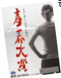
▲青春大賞ポスター