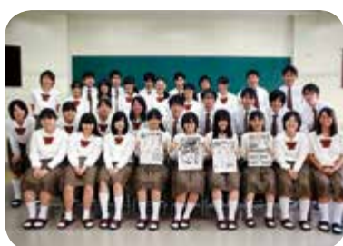
静岡県立富士東 高等学校新聞部

多年にわたり、文化の振興に貢献されています。発行する富士東高新聞は通巻95号を数え、全国高等学校総合文化祭に11年連続で出場するほか、平成25年度の全国高等学校年間紙面審査賞で最優秀賞、全国高校新聞コンクールで優秀賞を受賞するなど、全国的に高い評価を得ており、今後も活躍が大いに期待されます。