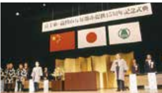
15周年記念式典（嘉興市）

平成21年10月 嘉興市で両市友好都市提携20周年記念式典を開催。富士市から約100人が嘉興市を訪問