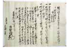
テーマ展から いみがわよしもど 「今川義元の書状」