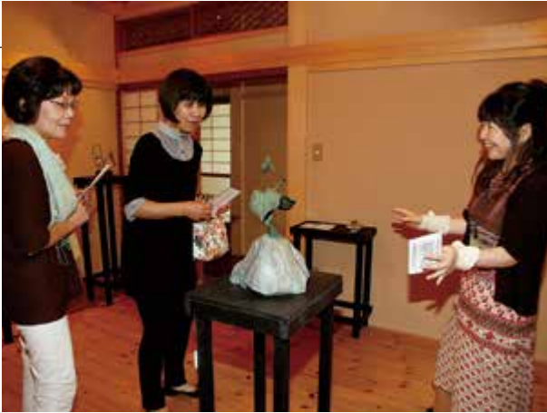
▲木でできた彫刻を鑑賞する来場者

富士芸術村開村10周年記念事業 9月14日 富士芸術村(大淵) 富士芸術村の開村10周年を記念して、式典と記念祭「みつけ茶屋」が開催されました。「みつけ茶屋」では、地元の飲食物や、手づくり小物の販売などのほか、リコーダーやアコーディオンの演奏が披露され、多くの人でにぎわいました。また、この日は、記念事業の一つである「富士山アーティスト・イン・レジデンス作品展」も開催中で、来場者は、富士芸術村スタッフの解説を受けながら、若手芸術家の作品の数々を鑑賞しました。