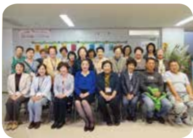
富士市消費者 運動連絡会

多年にわたり、市民生活の安全・安心のため、学び・行動する消費者として時代に応じた社会問題に積極的に取り組み、市民の暮らしの向上に尽力されました。 この間、富士市生活展の開催など、消費生活に関するさまざまな普及啓発活動を行い、市民の安全で安心な消費生活の向上に多大な貢献をされました。