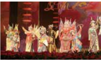
20周年記念式典（嘉興市）