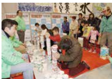
▲トイレットペーパー積み上げコンテスト