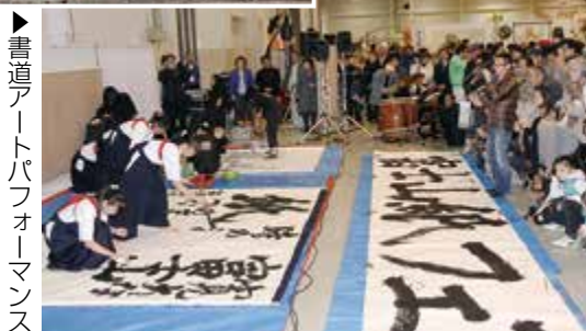
書道アートパフォーマンス