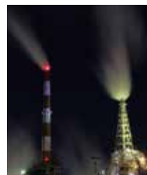
▲煙突ライトアップ

10月24日（金）・25日（土）の2日間にわたり（18〜21時の予定）、日本製紙（株）富士工場の煙突をライトアップします！