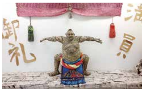
紙の芸術作品 （作ニッ山チ工「満員御礼」）

紙をテーマにした各種イベント、展示、販売を行います。 ふじさんめっせに来場するときは、紙でつくった飾りを身につけ、富士山紙フェアを盛り上げよう！