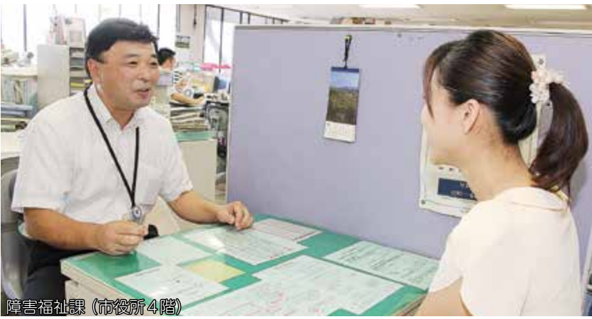
障害福祉課（市役所4階）

もし、子どもの発達について気になることがあれば、 障害福祉課（市役所4階） や、 こども療育センター 、 子どもが通う学校 、 福祉施設などにご相談ください 。