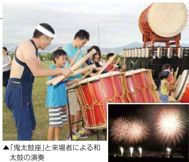
▲「鬼太鼓座」と来場者による和太鼓の演奏