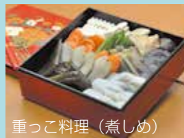
重っこ料理(煮しめ)