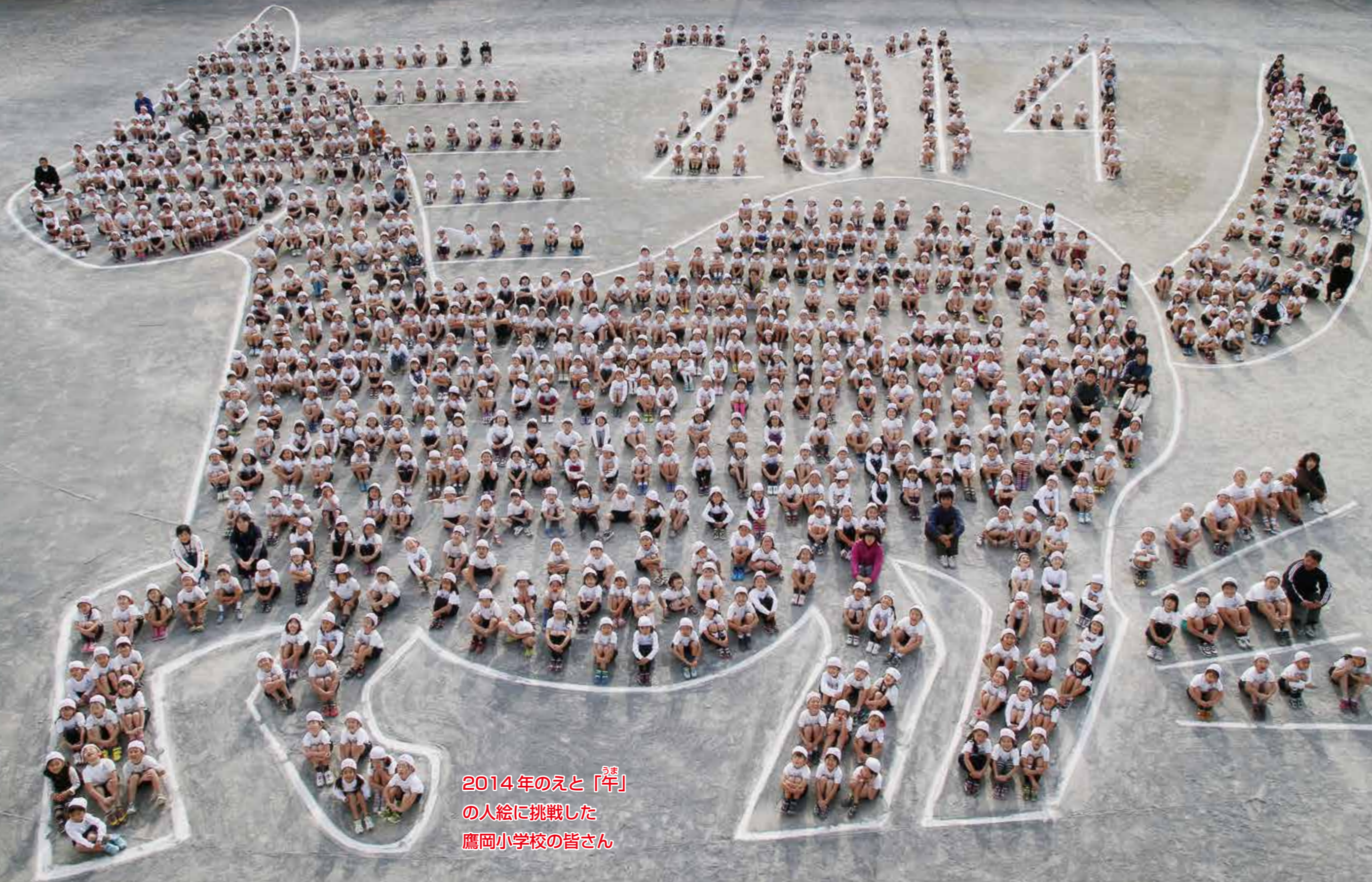
2014年のえと「 うま 馬」 の人絵に挑戦した 鷹岡小学校の皆さん

■ 新年のご挨拶/元日号お年玉プレゼント ■ 特集 富士市民のお正月 ■ 暮らしのたより